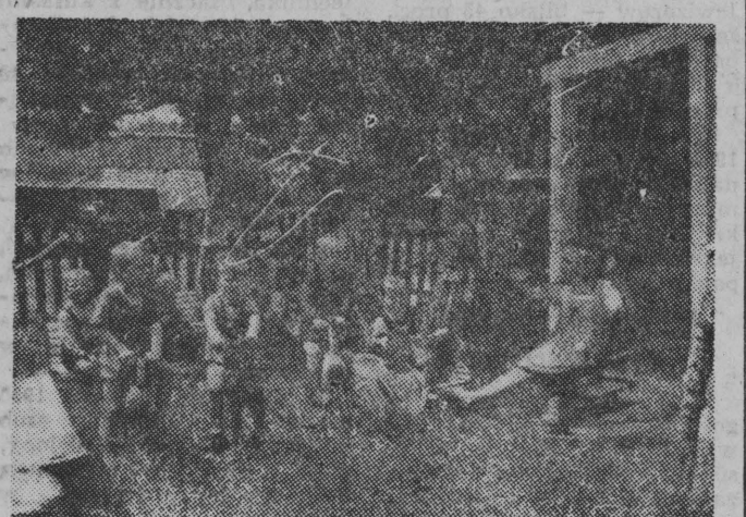
Matki w polu mają mało roboty, zwłaszcza teraz, przy żniwach, a w wiejskim przedszkolu gromadzą dzieciaki pod okiem wychowawczyń...