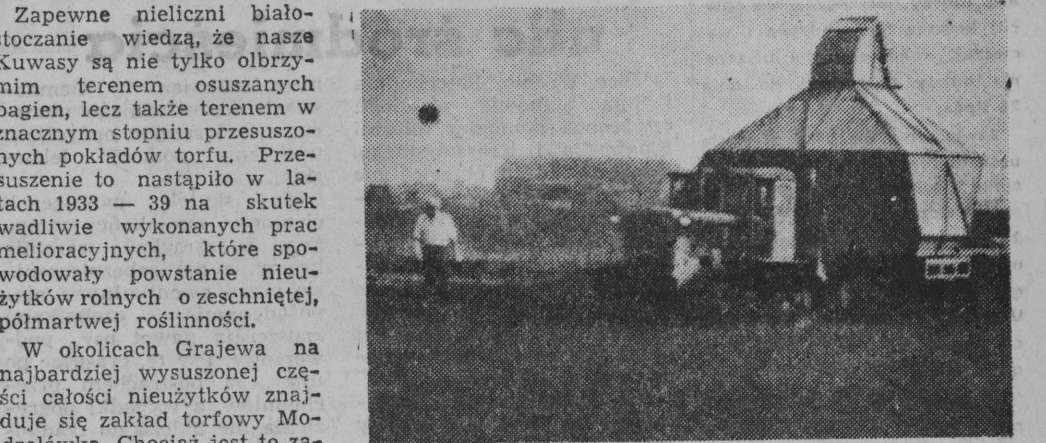
NA ZDJĘCIU: maszyna UMPF-4 podczas pracy.