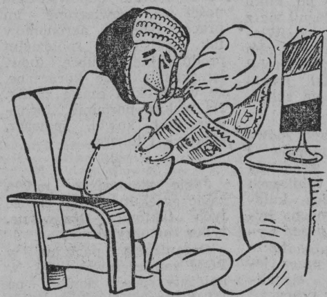
Oto jak można poświęcać się dla kultury!

W 78 izbach mieszkalnych białostockiego „wieżowca” już niedługo, bo w początkach przyszłego miesiąca, zamieszkają nowi lokatorzy. (Hr)