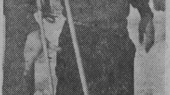
NA ZDJĘCIU: zawodnik białostockiego Startu, który w biegu na 12 km zajął II miejsce.

Na podkreślenie zasługuje dobra organizacja zawodów tak pod względem wytyczenia tras, jak i opieki nad zawodnikami.