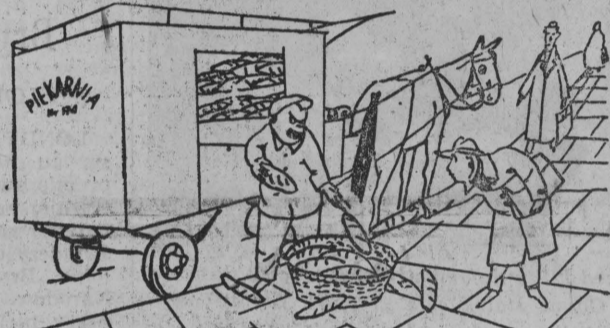
— Nie dotykać pieczywa brudnymi rękami... rys. Tadeusz Kobak

Widziałem niedawno w „Szpilkach” taki rysunek: W Białymstoku taka sytuacja mogłaby się zdarzać chyba codziennie. Sam widziałem jak furman ustawił