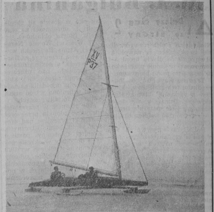
Sekcja żeglarska LPZ-Szczecin otrzymała ostatnio sprzęt bojerowy. Młodzi entuzjaści jazdu na bojerach trenują na jeziorze Dąbskim w Szczecinie.