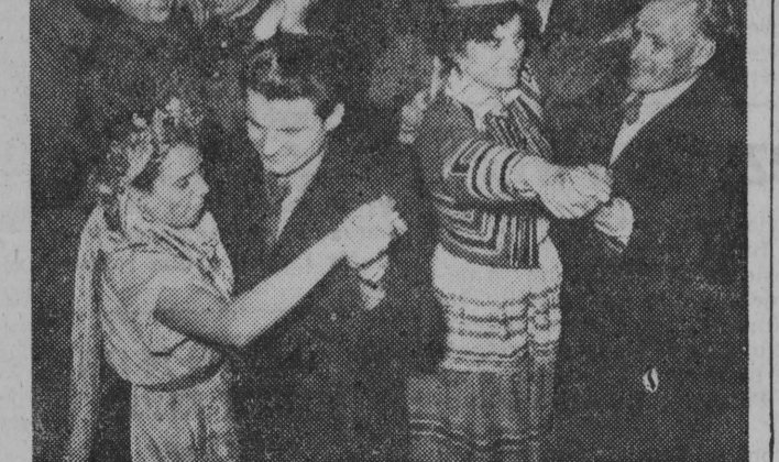
W czwartym dniu Zjazdu po zakończeniu obrad - wesoło bawili się delegaci na zabawie zorganizowanej dla nich w salach AWF.

Na sale treningowe i pływalnie, stadiony i boiska! Godnie reprezentujcie młodzież polską na II Międzynarodowych Sportowych Igrzyskach Przyjaźni, organizowanych z okazji Festiwalu.