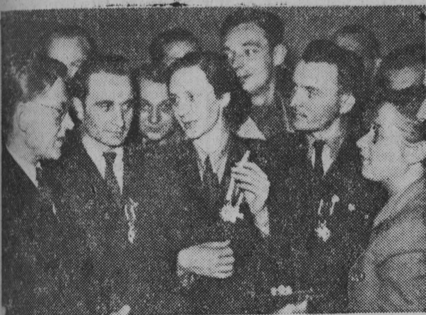
Dnia 1 lutego 1955 r. w ostatnim dniu Zjazdu, Przewodniczący Rady Państwa Aleksander Zawadzki dokonał dekoracji odznaczeniami państwowymi kilkudziesięciu uczestników Zjazdu.

W szerokiej dyskusji zebrani omówili zadania mobilizacji społeczeństwa białostockiego do walki przeciwko remilitaryzacji Niemiec zachodnich i walki o zakaz broni masowej zagłady.