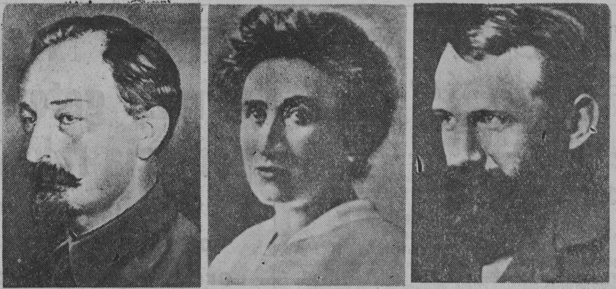
Pamiętajmy o historycznych zasługach rewolucyjnej, internacjonalistycznej SDKPiL — przewodniczki KPP, PPR i PZPR, o olbrzymim znaczeniu realizowanego przez SDKPiL i jej wodzów — Feliksa Dzierżyńskiego, Różę Luksemburg i Juliana Marchlewskiego — sojuszu z rosyjskim rewolucyjnym ruchem robotniczym.

Felicja Lewandowska, młoda dziewczyna ze wsi Topolany, w pow. białostockim, zakontraktowała 3 tuczniki na miesiąc styczeń. Tuczniaki sprzedała już państwu, przy czym 64 kg żywności odliczono jej na pokrycie zaległości z roku ubiegłego. Za sprzedane państwu zakontraktowane tuczniaki Felicja Lewandowska otrzymała około 4 tysięcy złotych w gotówce oraz