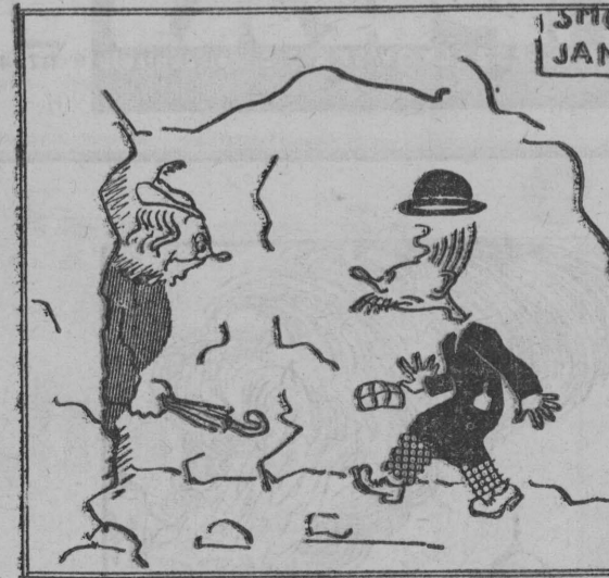
Jama ciemna I głęboka I w niej hilpco Ujrzał... smokół