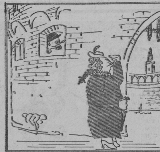
Teraz siedzi W Barbakanie („Mama” szukać — Nie przestanieli).