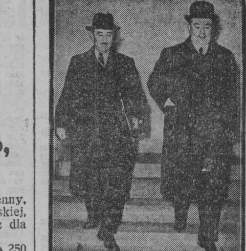
Nowy premier belgijski Pierlot (z prawej strony) w towarzystwie ministra skarbu opuszczają gmach parlamentu

Przedwczoraj Blücher, jego żona wraz z kilkoma dawnymi oficerami swego sztabu i komisarzami politycznymi wyjechać mieli specjalnym poocięciem do Chabarowska.