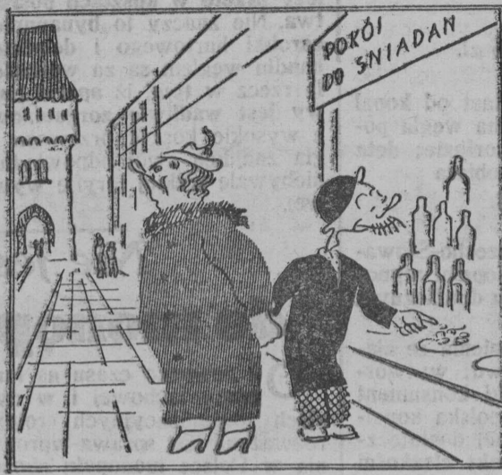
Na wystawę Pańczyk młoty (Gdybyż „mamy” tu ale był).