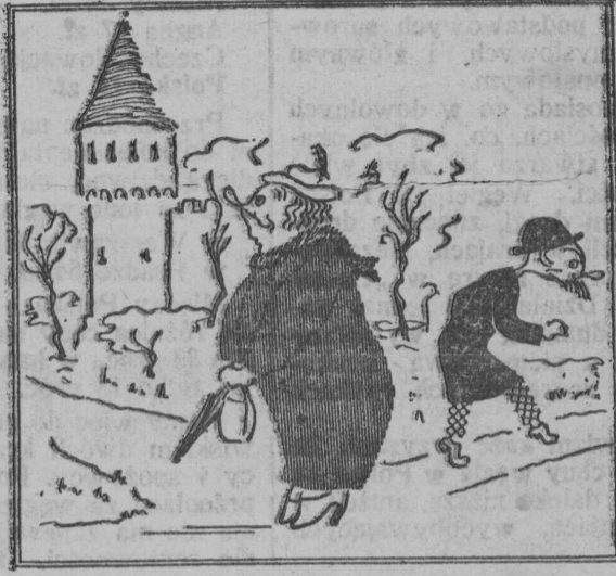
Oto sztuka, Daję słowo; „Zgubić” w mieście Wyżerkowa.