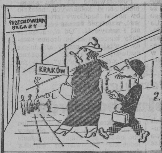
Podróżując, Wyżerkowie zatrzymali się w Krakowie.