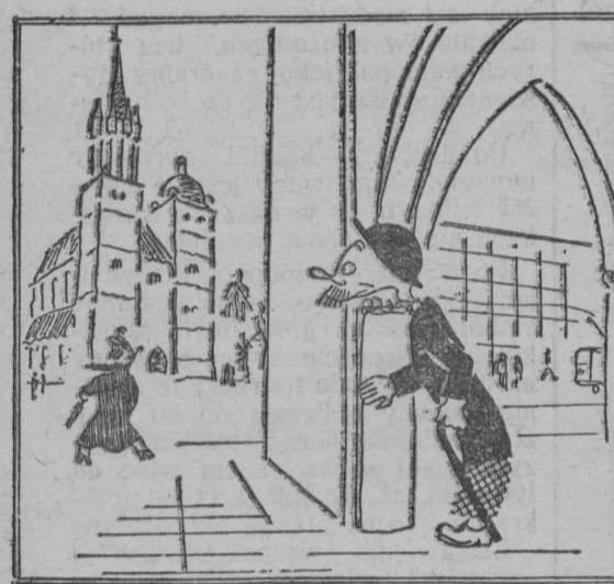
Ona sztuka Po ulicach, On się ukrył W Sukienkach.