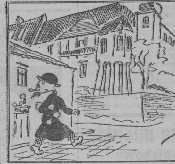
Labiryntem Plantów, ale, Uciec chce Wyżerko dalej...