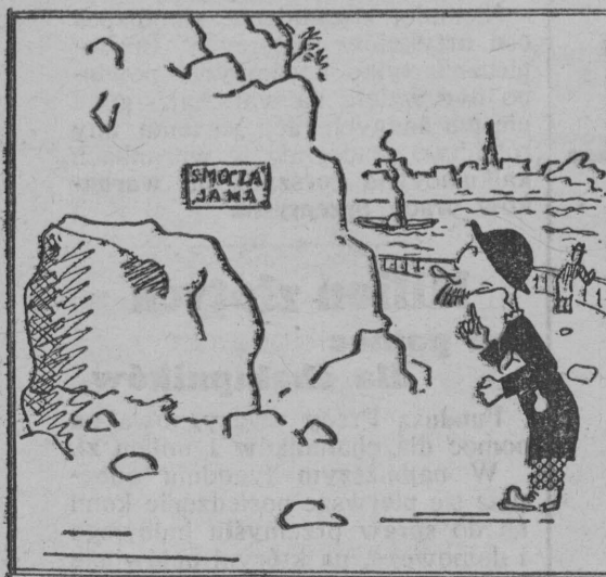
Świętne miejsce: „Smocza jama”, Tu nie wejdzio Nawet „mama”.