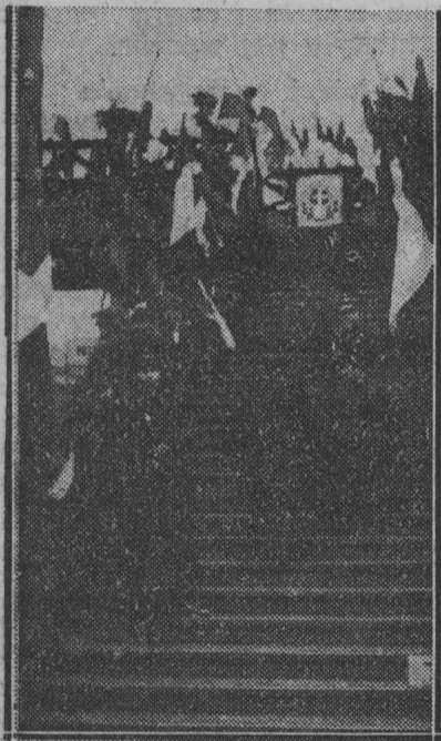
Odświętnie udekorowane schody, wiodące z dolnych peronów Dworca Głównego

Od wczoraj bawi w Warszawie minister spraw zagranicznych Italii hr. Galeazzo Ciano wraz z małżonką, córką Mussoliniego.