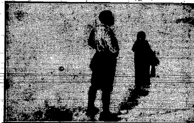
Musiolini wśród śniegów Italji, w Alpach włoskich, gdzie wyjechał na krótki urlop wypoczynkowy.