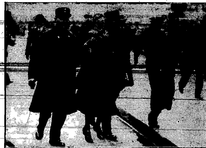
Manifestacje szoferów i szoferek pa ryskich przeciw nowej taksie, zakończyły się licznymi aresztowaniami.