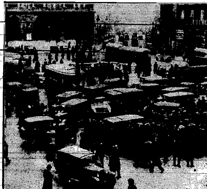
Galimatjas pojazdów na placu Operey w Paryżu, wywołany włoskim strajkiem taksówek.