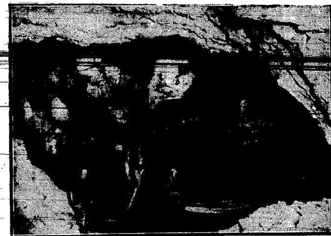
Podziemne jezioro świeżo odkryte w Waskey pod Bristolem (Anglja).