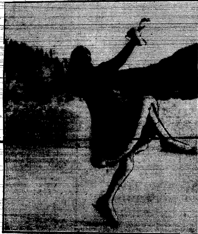
„Wziewarka” — czy tancerka?

Dla niego zima — to mróz w domu, mróz w kościach, przemoczzone buty i odmrożone ręce. Okres najcięższy do prze-