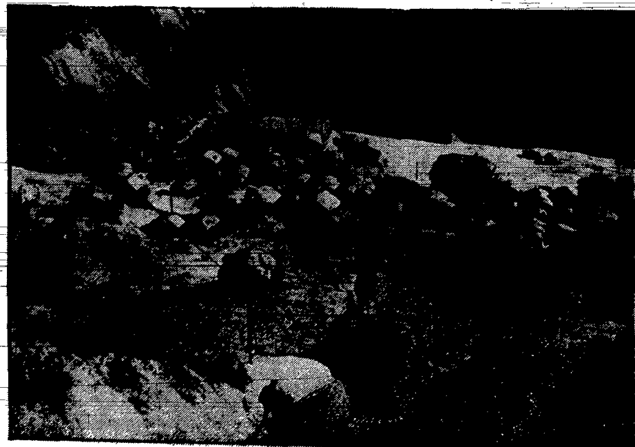
Wieś śpi pod czapami śniegu