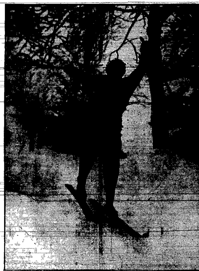
Szus z pagórka