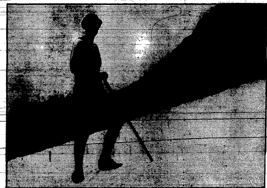
Na śniegu... w trykocie...