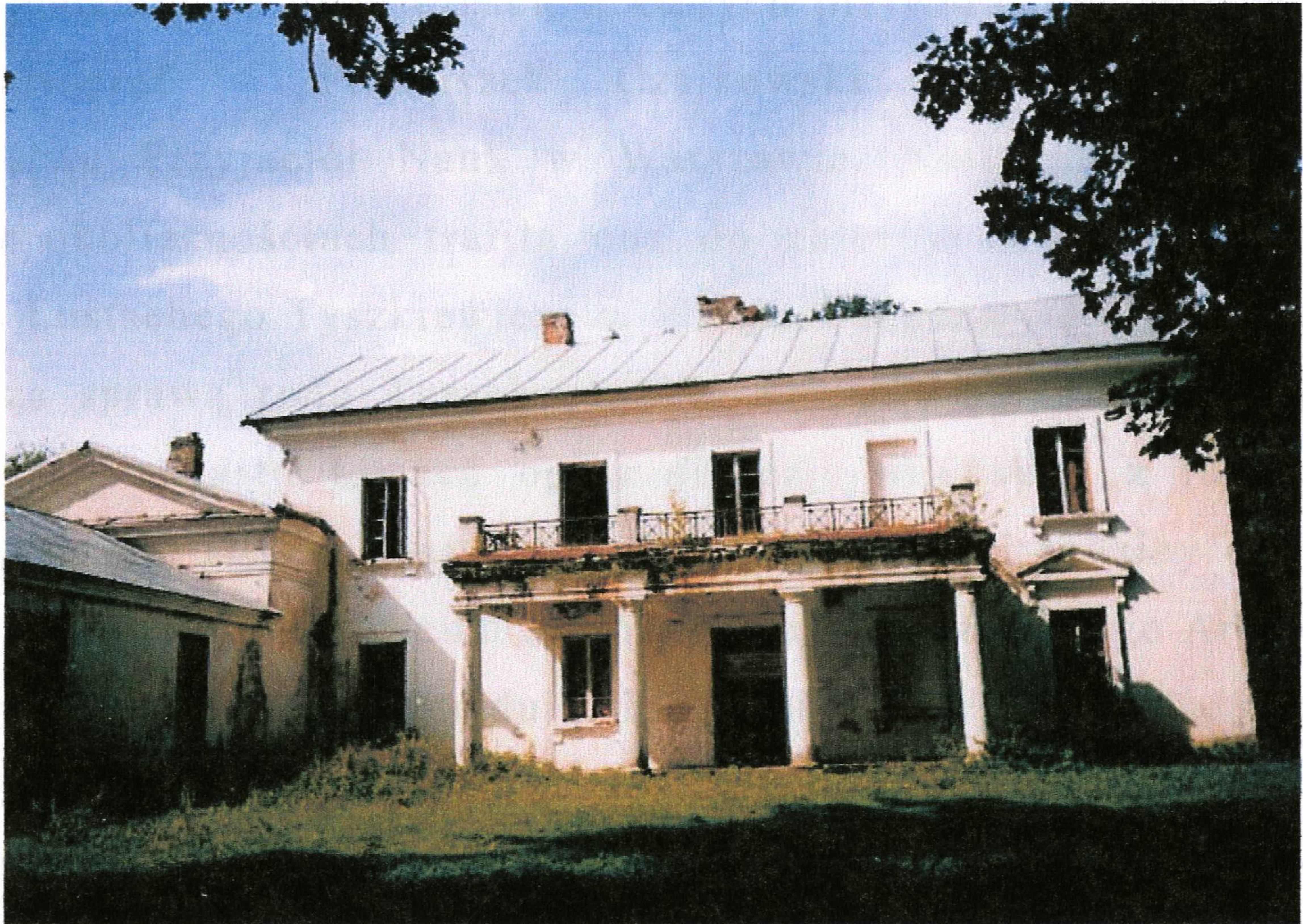
Fot. 1. Biblioteka z końca XVIII wieku w majątku Chreptowiczów w Szczorsach.