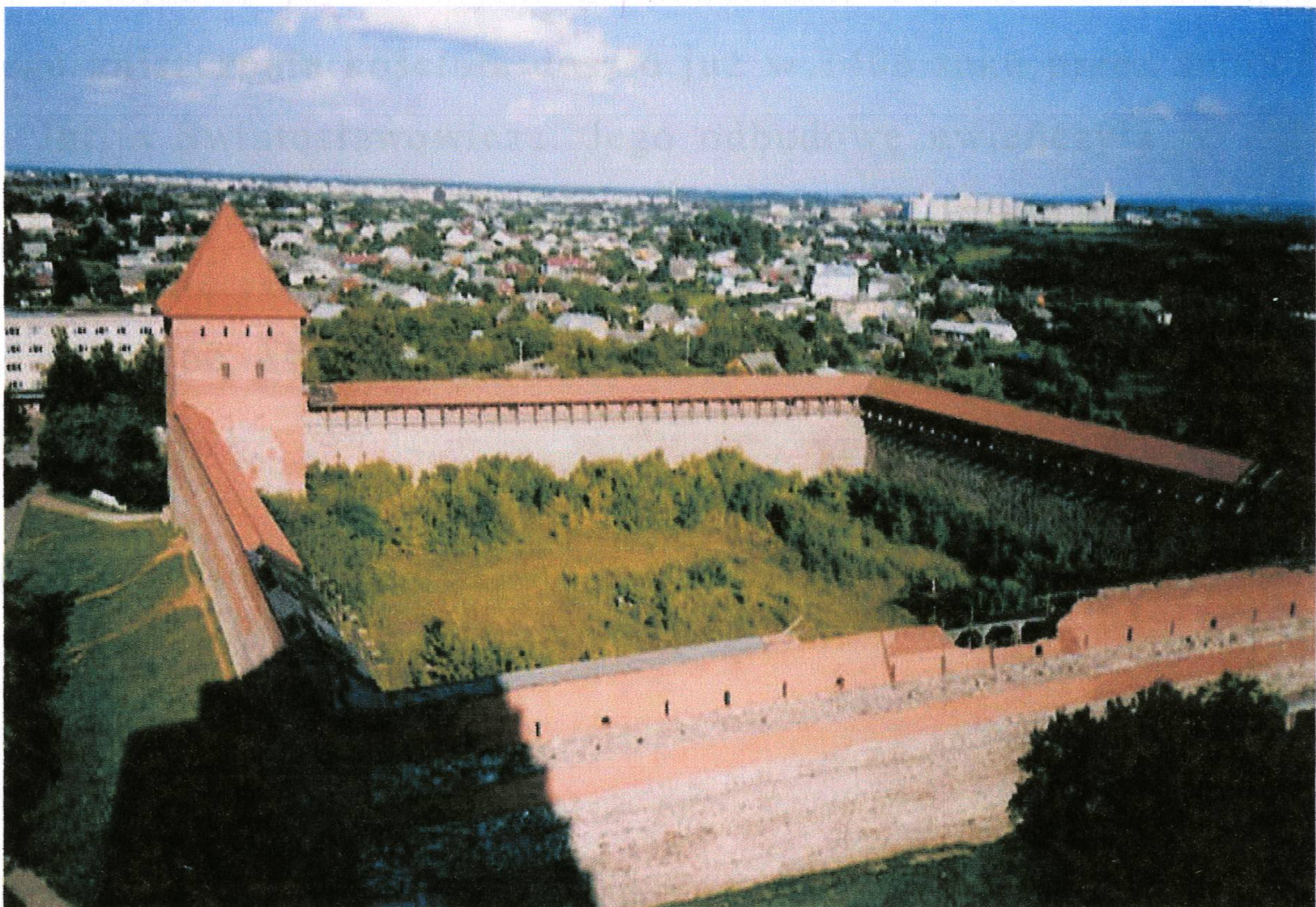
Fot. 3. Zamek książąt litewskich z lat trzydziestych XIV wieku w Lidzie.