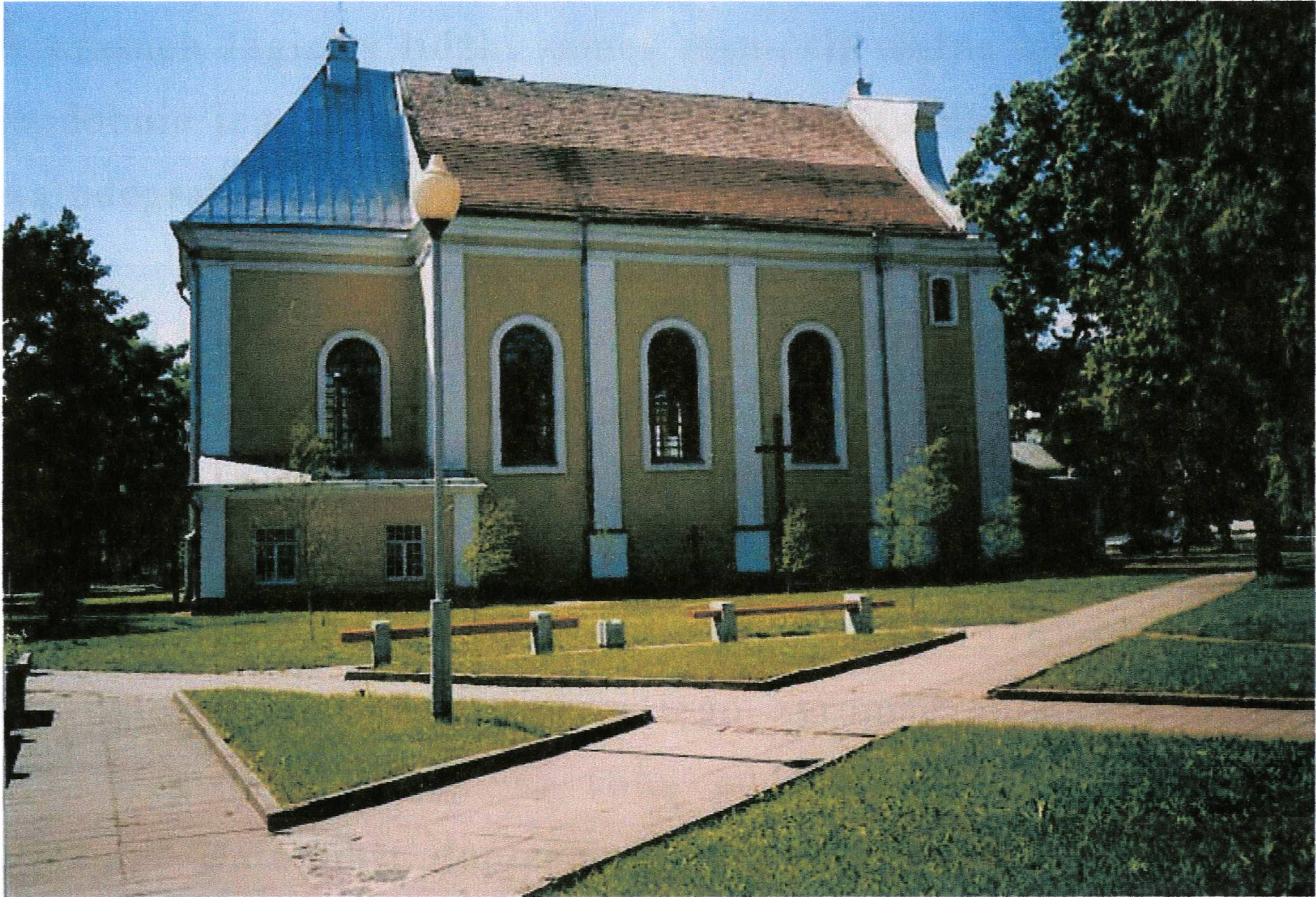
Fot. 2. Kościół farny w Lidzie p. w. Podwyższenia Krzyża Św. z 1770 r.