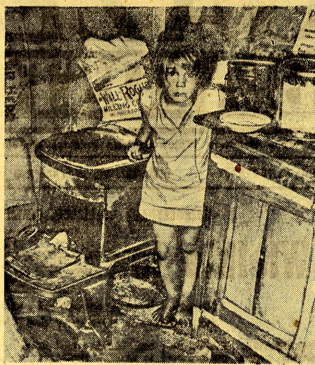
W wyniku stałego wzrostu tempa zbrojeń, na które rząd USA preliminuje 74 proc. budżetu, stale pogarszają się warunki życia ludności.