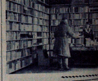
Księpiarnia rolnicza przy ul. Przechodzącej dysponuje dużą ilością fabrycznej literatury. Tu można też spisać mieszkańców całego województwa przy dokonywaniu zakupów.

W tym roku są deklarowane na czyny społeczne 10 tys. złotych. Dotychczas wydatków osiągnięto 17 000 zł. W tym roku plan 60 tys. zł i nadwyżki budżetowej przekazano na cele fundacji czynnów społecznych.