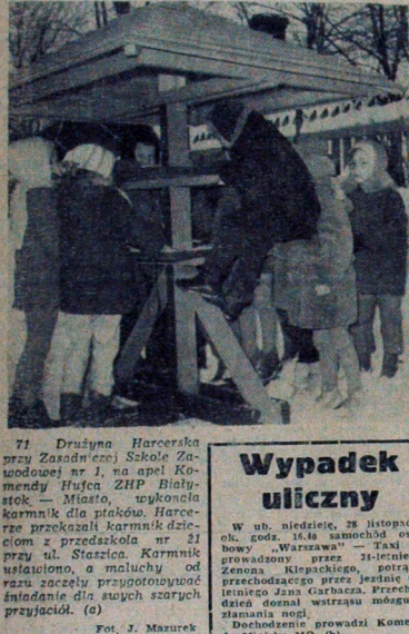
71 Drużyna Harcerska przy Zasadniczej Szkole Zawodowej nr 1, na apel Karłowicza. W tle: ZHP Białostok — Miasto, wykonca karmnik dla ptaków. Harceci przekazali karmnik dzieciom z przedskola nr 21 przy ul. Szlacheckiej. Karmnik ustawiono, a maluchy od razu zaczęły przysiotowywać śniadanie dla stuch szarych ptaszków. (a)