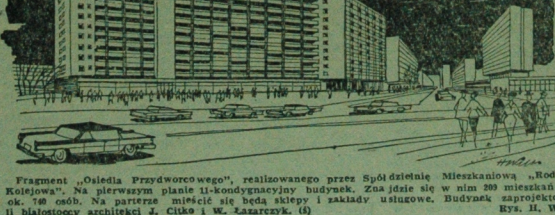
Fragment „Osiedla Przdworcowego”, realizowanego przez Spółdzielnię Mieszkaniową „Rodzina Kolejowa”. Na pierwszym planie 11-kondygnacyjny budynek. Znajduje się w nim 20 mieszkań dla 150 osób. Na parterze mieści się sklep i zakłady usługowe. Budynek zaprojektował Białostoccy architektki J. Ciuła i W. Łaszczak. (6)