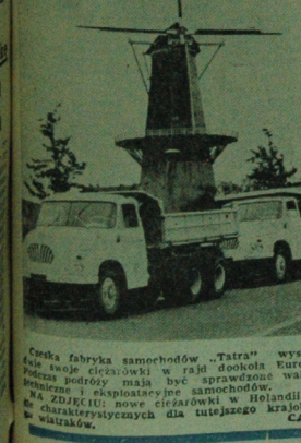
Całkowita fabryka samochodów „Tatra” wysłała swoje ciężarówki w rali „Teoooka Europy. Właściciele podrozny mają być sprawdzony walory wozów i eksploatacyjne samochodów. Właściciele i eksploatacyjne w Holandii na charakterystycznych dla tutejszego krajoznawstwa.