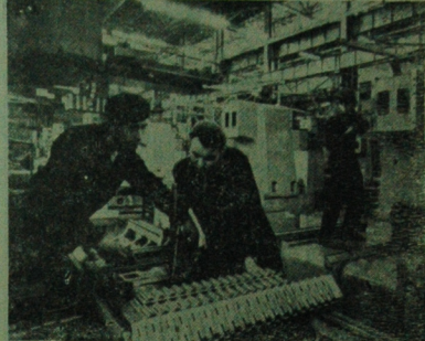
Jednym z eksponatów wystawionych przez radziecki przemysł na Międzynarodowych Targach Poznańskich będzie siłownia elektryczna o mocy 24 MW. NA ZDJĘCIU: kontrola techniczna nowo wyprodukowanej maszyny.