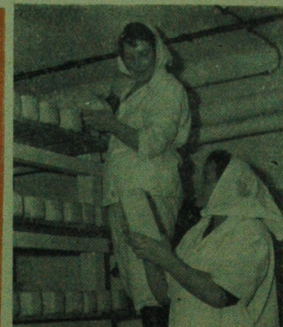
Pod względem wielkości produkcji przemysłu spożywczej, zajmując w naszym województwie pierwsze miejsce (wytworzył blisko 18 proc. ogólnej produkcji przemysłowej). Ostatnio wybudowaliśmy kilka nowoczesnych zakładów mleczarskich.

W okresie czteroletniej działalności zrzeszenie skupiło 1400 chałupników z powiatów: bielskiego, białostockiego, hajnowskiego, siemiatyńskiego, dąbrowskiego, a ostatnio także gminy, w tym także, sejnęńskiego i augustowskiego. Zakładając, że w tym czasie wielu artykułów biorą udział także człon-