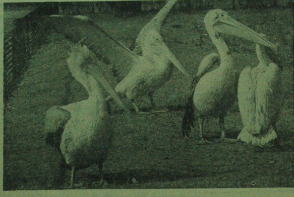
Gromada pelikanów na potanym spacerze.