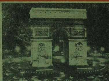
Plac Gwiazdy w Paryżu otrzymał nową oświetlono. Dookoła Banku Triumfałowego ustawiono 24 nowoczesne kandelabry.

W rudno wprost uwierzyć w fakt, iż spór o kopalnię miaz (6-1 miliardów ton) organizmów morskich, odnawiających się szybciej niż lasa, a flora i fauna, człowiek wykorzystuje na swe potrzeby tylko ułamek procenta, doświadczy 435 proc. Roczny światowy połów organizmów morskich wynosi bowiem około 41 miliardów ton (wg danych z 1961 r.). Z tego ryby stanowią 24 miliony ton, a wiatoloty 7 mln ton, reszta to młczaki, wodorosty, denne, plankton, żółwie, kłki itp. Wielkość połowów rybackich w latach 1936-41, wzrosła o 40 proc. i ma się znacznie zwiększać.