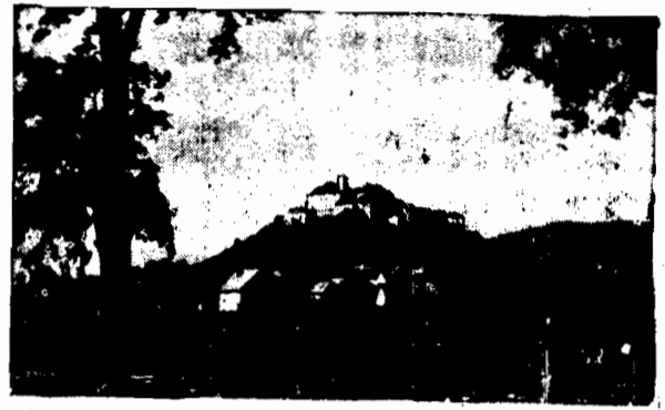
Jak już wiadomo oddział wojsk czeskich, wspierany przez ochotnicze bojówki rządu Wołoszyna, zaatakował niespodziewanie terytorium węgierskie...