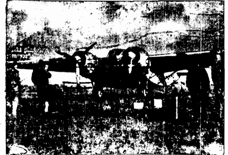
Na lotnisku w Southampton odbył się próbný lot oryginalnego samolotu pancernego, którego kadłub zbudowany jest również w kształcie skrzydła, co powiększa jego nośność.