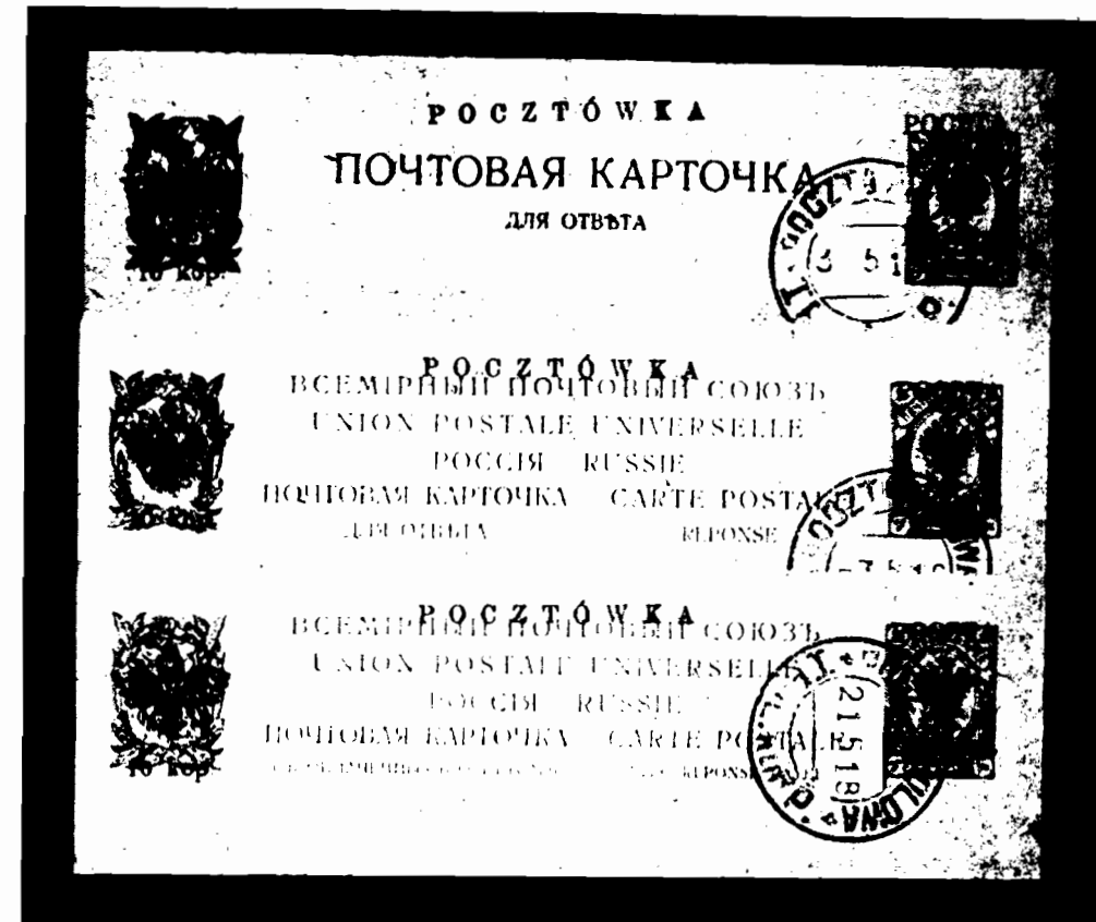
Rys. 18. Pocztówki w kolejności od góry: 1) Nr 5 — za 10+10/3+3 kop.; kartka druga na odpowiedź; 2) Nr 6 — za 10+10/4+4 kop.; kartka druga na odpowiedź; 3) Nr 6 — za 10+10/4+4 kop.; kartka pierwsza dla wysyłającego.

6. 10+10 kop. na 4+4 kop. czerwona, karton piaskowy, nadruk polski a. Zasadnicza pocztówka rosyjska jak w Nr 3, tylko w środku pięciowierszowy napis i to na pierwszej kartce: