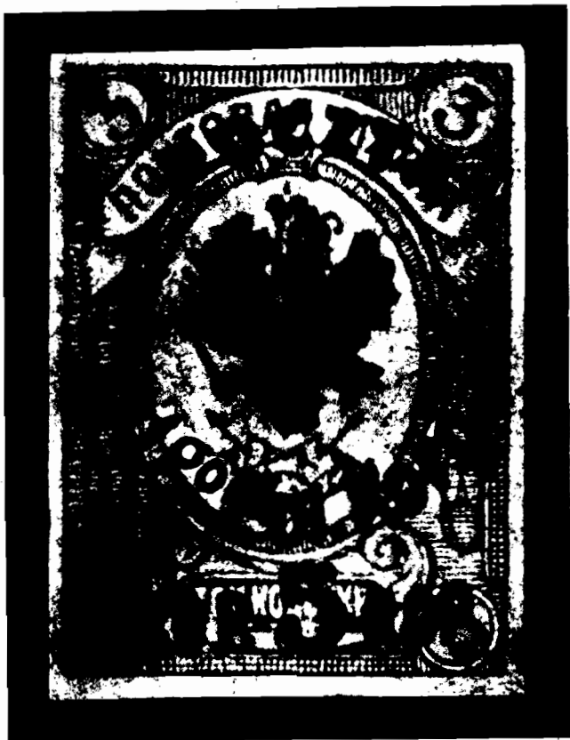
Rys. 16. Powiększony polski nadruk z próbnodruku pocztówki, wykonanego przy I wydaniu znaczków.

Na tej podstawie musimy przyjąć, że już przy pierwszym wydaniu znaczków projektowano także i przedruk całostek, powodem zaś niewydania ich równocześnie z pierwszymi znaczkami była techniczna trudność przedruku litograficznego pojedynczych całostek, względnie brak w owej litografii odpowiednich urządzeń, skutkiem czego można było wydać je dopiero po przeniesieniu przedruku do drukarni w twierdzy.