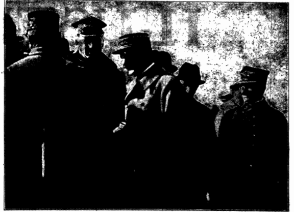
Generał Sosnkowski, minister spraw wojskowych rozmawia z francuskim generałem Weygandem.

W początkach zeszłego miesiąca Naczelnik Państwa Polskiego, Józef Piłsudski, na serdeczne zaproszenie Rządu francuskiego, odbył podróż do Paryża. W osobie Naczelnika Państwa Francja podejmowała z niezwykłą serdecznością i okazałością swą młodszą siostrzycę Polską, z którą od tak dawna już łączą ją węzły przyjaźni niejednokrotnie krwią obywateli obu bratnich państw zadokumentowane. Wizyta Naczelnika Państwa w Paryżu odbiła się szerokim echem w całym świecie politycznym i wzmożniła nasze starżowisko w szeregu państw Europy.