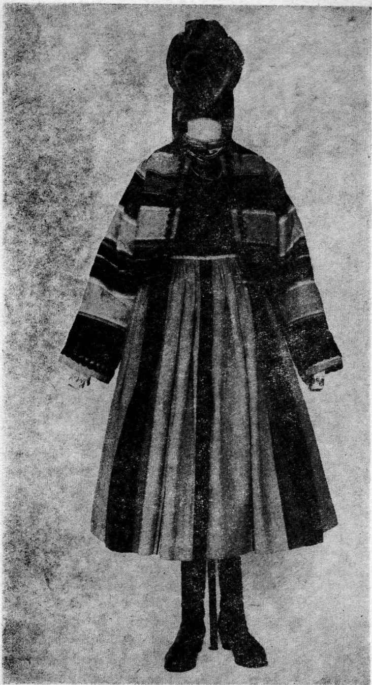
Strój łowicki (kobiety) 1900–1920