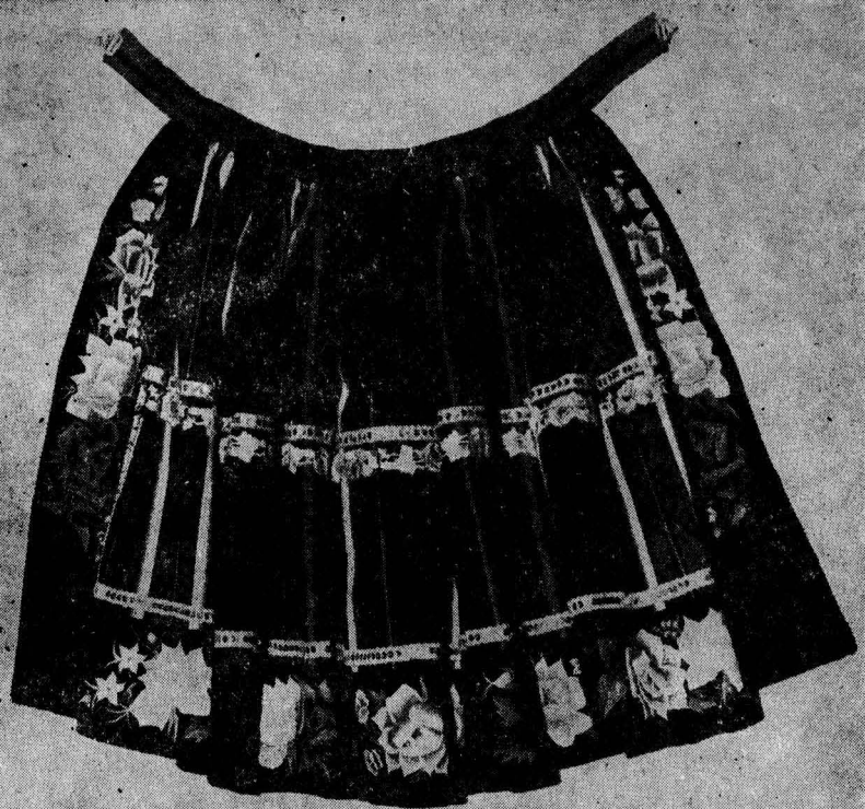
Zapaska łowicka lata 1950-te

chaicznych ubiorów, cechuje go ogromna prostota. Strój kobiecy wykonany z białego płótna lnianego zdobiony na brzegach szlaczkami czerwonego lub czarnego haftu o prastarych motywach esownicy lub ślimacznicy. Znamienne jest także nakrycie głowy: „chamelka” – niewielka obrączka z kory lipowej, owinięta haftowaną „zawiązką”, nakryta z góry siatkowym denkiem i nakryta długim płóciennym szalem – „zawiciem”.