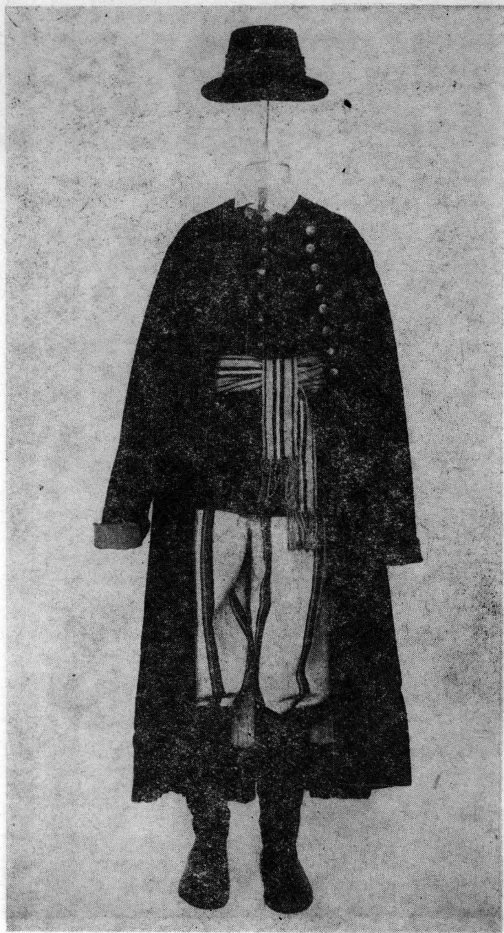
Strój łowicki (męski) 1900–1920