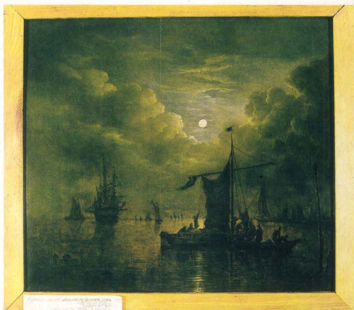
Dirck Camphuysen - Okręty na morzu, wł. Muzeum Narodowego w Poznaniu.

Zakłady Przemysłu Zielarskiego "Herbapol"