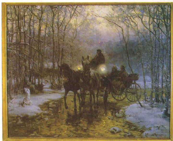
Alfred Wierusz-Kowalski - Wyjazd powozem, 1890, wł. Muzeum Okręgowego w Białymstoku