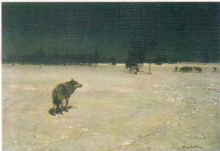
Alfred Wierusz-Kowalski - W lutym na Litwie, wł. Muzeum Narodowego w Poznaniu