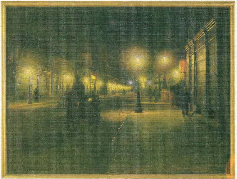
Ludwik de Laveaux - Paryż w nocy, ok. 1893, wł. Muzeum Sztuki w Łodzi