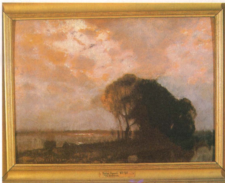
Stefan Popowski - Pejzaż - noc księżycowa, 1922, wł. Muzeum Okręgowego w Białymstoku