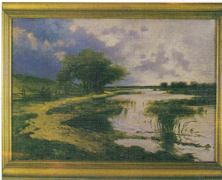
Marcei Harasimowicz - Pejzaż z rozlewiskiem, 1927, wł. Muzeum Narodowego we Wrocławiu.