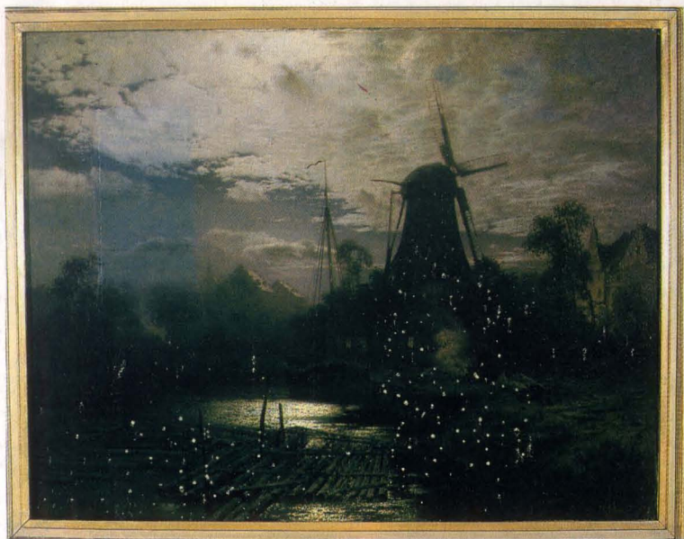
Louis Douzette - Krajobraz nocny z wiatrakiem, wł. Muzeum Narodowego we Wrocławiu