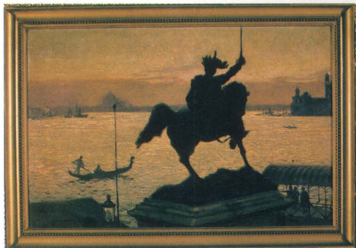
Józef Rapacki - Widok z Wenecji, 1913, wł. Muzeum Narodowego w Poznaniu.