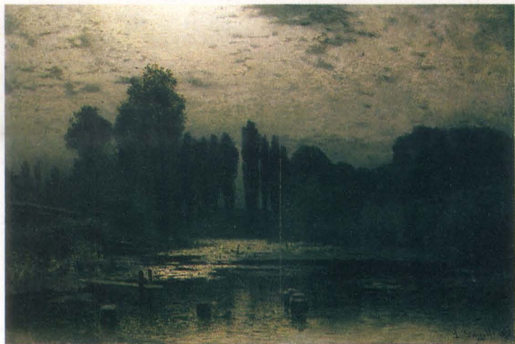
Louis Douzette - Noc księżycowa, 1876, wł. Muzeum Narodowego we Wrocławiu