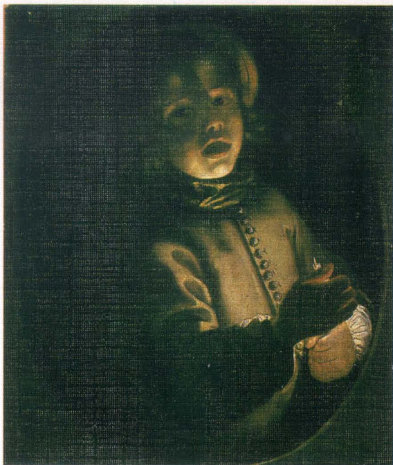
Gottfried Schalcken - Chłopiec ze świecą, wł. Muzeum Narodowego w Poznaniu