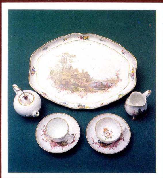
5. Porcelana, Miśnia, poł. XVIII w. Meissen porcelain, half of the 18th cen.