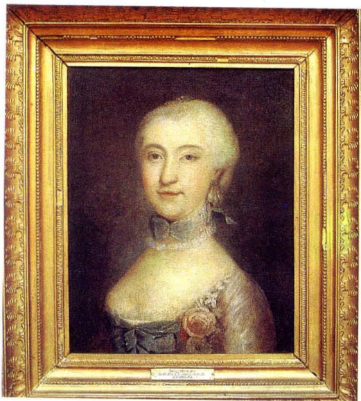
2. Portret Izabeli z Poniatowskich Branickiej, autor nieznan, II poł. XVIII w. The portrait of Izabela Branicka, born Poniatowska, the author unknown, second half of 18th cen.