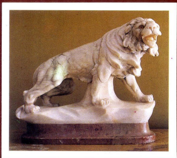
4. Lew marmur, XVII w. A lion, marble, 18th cen.