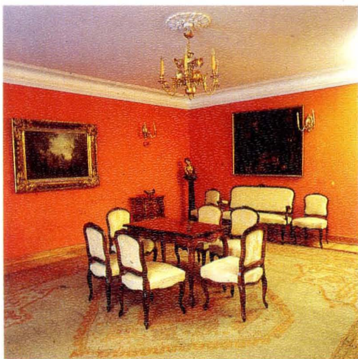
7. Apartamenty I piętra Private rooms, the first floor

Opracowanie graficzne: Andrzej Onchimowicz Dariusz Sobociński