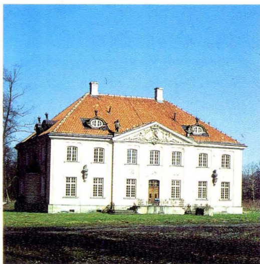
9. Muzeum Wnętrz Pałacowych w Choroszcz Museum of Palace Interiors in Choroszcz

Muzeum Wnętrz Pałacowych w Choroszcz Oddział Muzeum Okręgowego w Białymstoku Czynne codziennie w godz. 10 - 15 oprócz poniedziałków dojazd z Białegostoku autobusem PKS