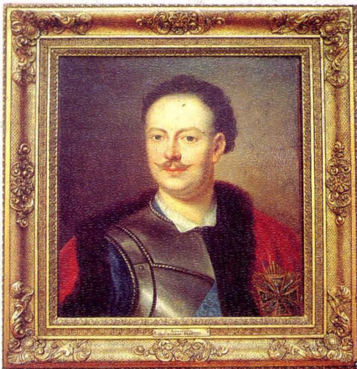
1. Portret Jana Klemensa Branickiego, autor nieznamy, ok. poł. XVIII w. The portrait of Jan Klemens Branicki, the author unknown, about half of the 18th cen.