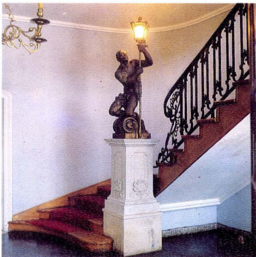
6. Klatka schodowa The staircase