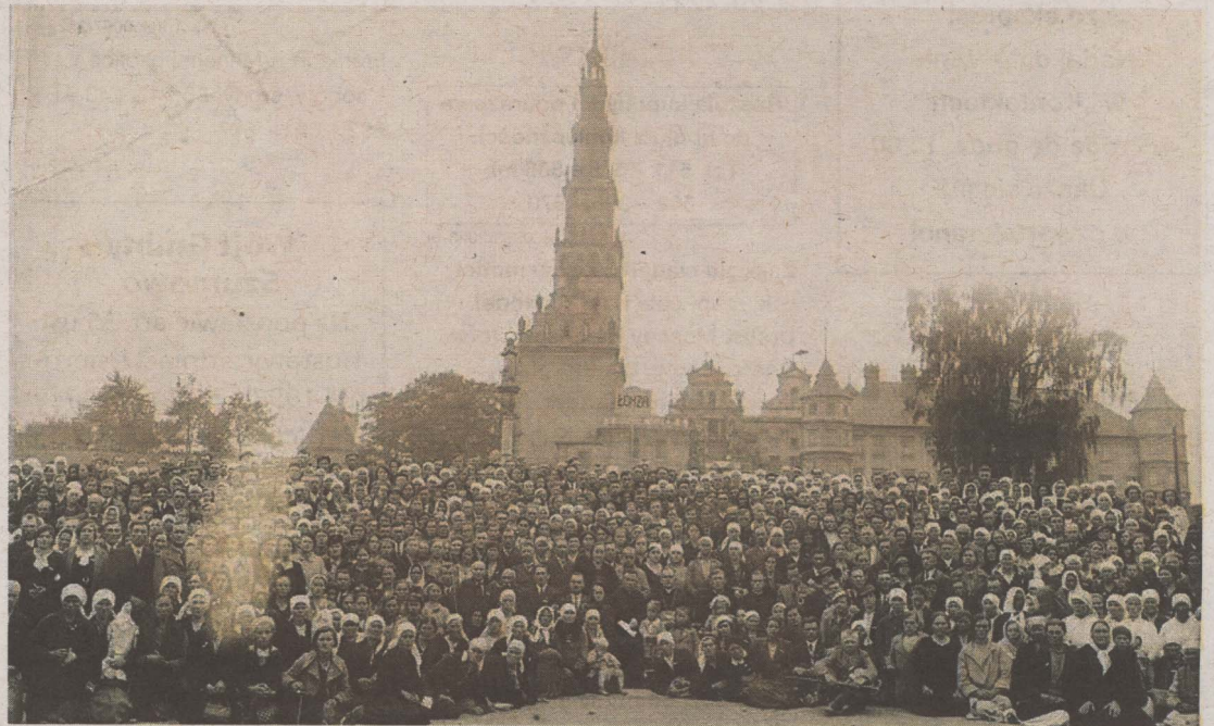
Pielgrzymi z Łomży na Jasnej Górze, lata trzydzieste XX w.

Dochodziła godzina 14.00, gdy jeden z pielgrzymów stanął z krzyżem przy wyjściu z placu katedralnego. Za nim formowała się procesja z chorągiewkami. Blżej czoła ustawili się najstarsi pątnicy.