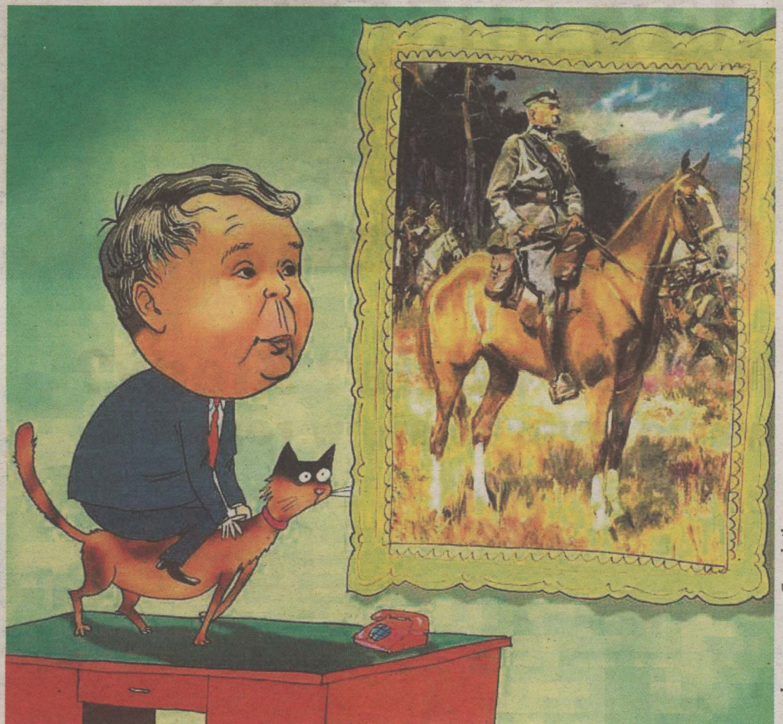
Wódz Jarosław Chelpliwyy po szarzy na najpotężniejszego wroga Donalda Rzyżego pod Stawiskami, pozuje malarzowi Leonardo da Vinci do portretu