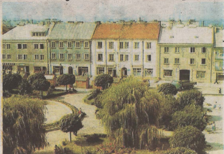
Stary Rynek (wówczas Plac Żeglickiego) w Łomży, lata 80.

Autostopowicze z Wrocławia: – Siedzimy tu już prawie dwie godziny i nikt nie chce nas zabrać. To najdłuższa przerwa na trasie. Łomża podoba nam się bardzo, bo jest zielona.