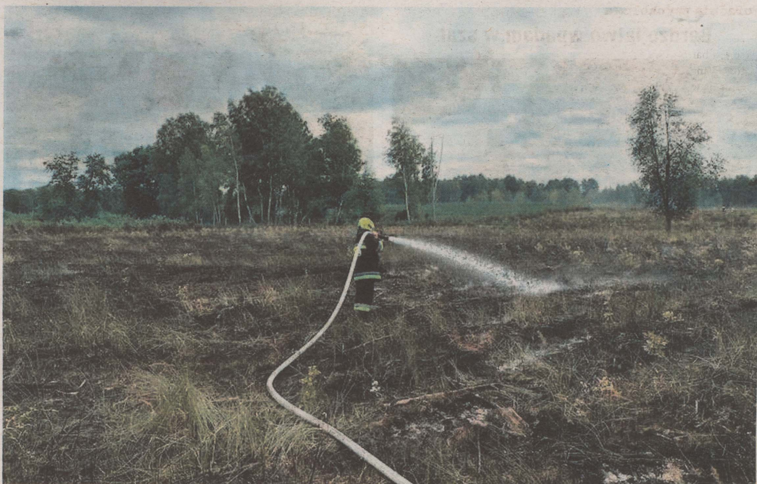
8 zastępów strażaków i samolot gaśniczy Dromader z Nadleśnictwa Białystok gasiło pożar w kompleksie leśnym Czerwony Bór (gm. Zambrów). Spłonęło około 3 ha młodnika oraz pojedyncze drzewa. Przyczyna pożaru na razie nie jest znana. W lasach i na polach jest sucho i bardzo łatwo o pożar. Tylko w ostatnich trzech tygodniach w powiecie zambrowskim doszło do kilku pożarów.