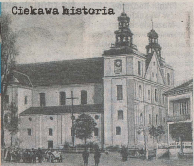
„Nalewka chrzcielna” i kościół ewangelicko-augsburski w Łomży, z którego naczynie pochodzi.