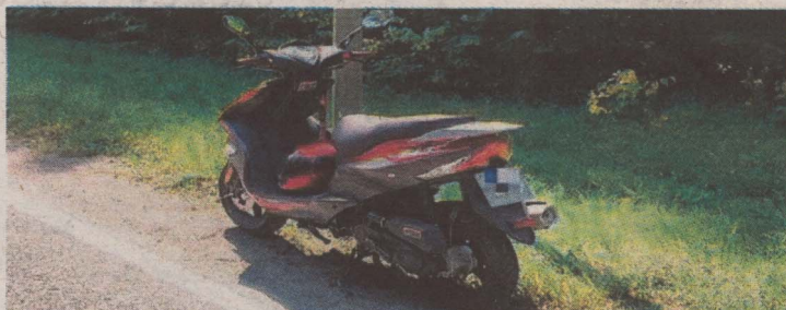
Tym skuterem pognali do ukochanej na drugi koniec Polski.

Dwaj bracia (lat 16 i 27) po kłótni z rodzicami wyszli z domu, wsiedli na skuter i odjechali w nieznanym kierunku. Gdy nie wrócili do domu, rodzice o zaginięciu synów zawiadomili policję w Wysokiem Mazowieckiem.