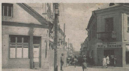
Ulica Białegostoku w czasie niemieckiej okupacji

Niemcy utworzyli getto w Białymstoku 26 lipca 1941 roku. Zamknęli w nim ok. 40 tysięcy