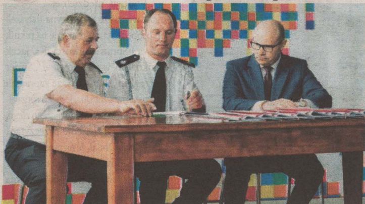
Marszałek Artur Kosicki podpisuje umowę na dotację ze strażakami OSP w Skłodach Borowych (gm. Nowe Piekuty).

Na drugą edycję otwartego konkursu ofert „Kapliczki Podlaskie 2023 – ocalić od zapomnienia”, którego celem jest ratowanie małej architektury sakralnej nie wpisanej do rejestru zabytków, wpłynęły 32 zgłoszenia. Dofinansowanie na łącznie 100 tys. zł otrzymało 16 zgłaszających organizacji pozarządowych.