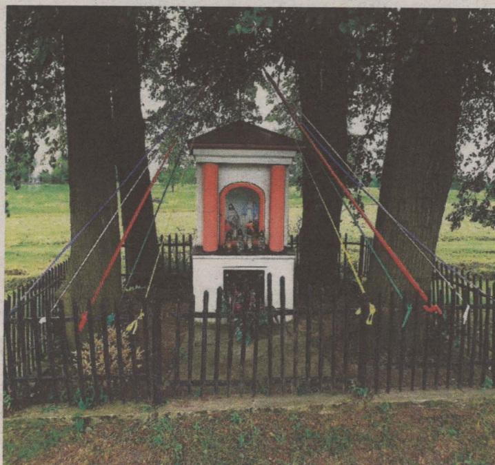
Kapliczka przy drodze w Starym Gromadzinie, wzniesiona na pamiątkę ofiar, pod którą w 79 rocznicę mordu władze samorządowe i mieszkańcy 24 lipca złożyli kwiaty i zapalili znicze.

Pod koniec wojny gen. A. Własow poddał się Ameryka-