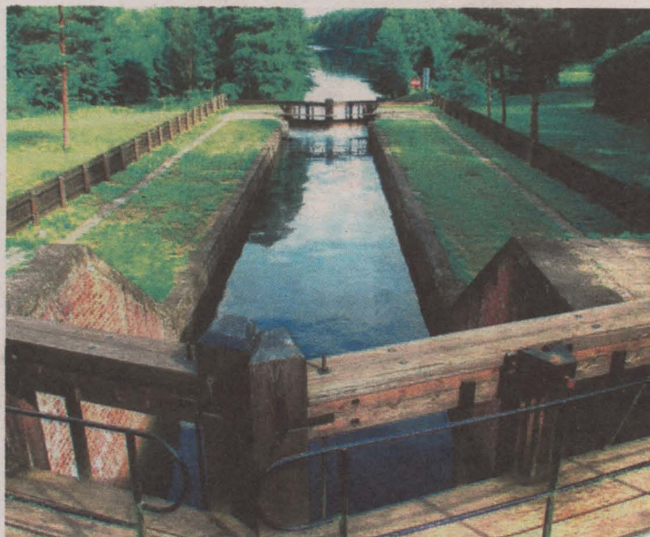
Śluza Paniewo.

Kanał Augustowski dzieli granicę pomiędzy Polską i Białorusią. W granicach Polski mamy 80 km z 14 śluzami. Jedna śluza przebiega w pasie granicznym, a 3 znajdują się po stronie białoruskiej.