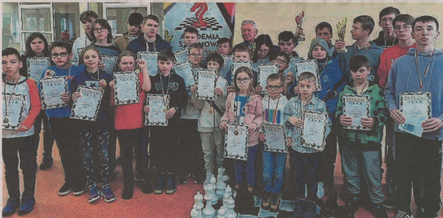
Najlepsi szachiści XXVIII Feryjnego Festiwalu Szachowego 2023

112 szachistów z łomżyńskich szkół i przedszkoli, a także z Konarzczy, Zambrowa, Grajewa, Czyżewa, Śniadowa, Szumowa, Szczuczyna, Wysokiego Mazowieckiego, Ełku, Białegostoku i Warszawy rozegrało 441 partii szachowych w czterech kategoriach: zaawansowanych, średnio zaawansowanych, przedszkolaków i startujących pierwszy raz oraz szachów błyskawicznych.