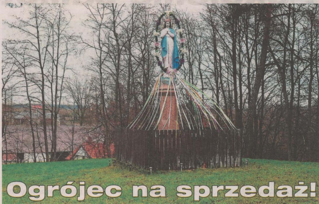
Kapliczka w Ogrójcu

Epidemia cholery na tereny Polski (kraj był pod zaborami) przysłała w XIX w. z Rosji. Nie wiadomo dokładnie, kiedy dotarła do Bronowa, prawdopodobnie ok. 1860 r. Zmar-