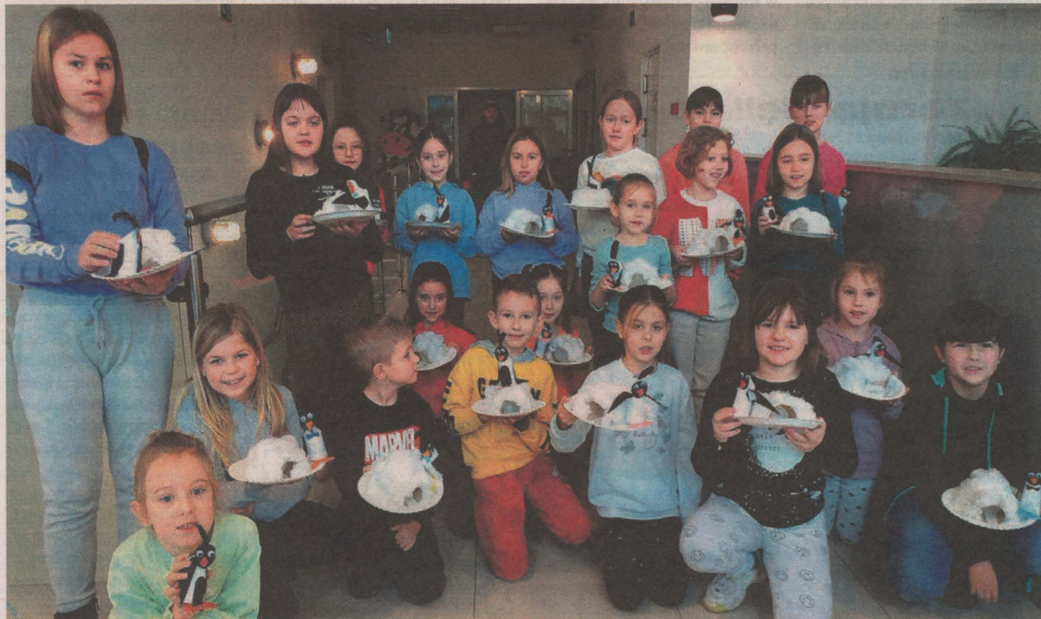
Pingwiny na talerzu? Tak, tak! Nie mylicie się. Przed chwilą tworzyliśmy Zimową Krainę!

Minął pierwszy dzień ferii zimowych z Grajewskim Centrum Kultury, które zaczęły się „Gry bez komputera”. Młodzi ludzie świetnie się bawili bez... komputera i internetu! W kolejnych dni miłośnicy śpiewu spróbowali swoich sił w karaoke, pasjonaci sztuk plastycznych wzięli