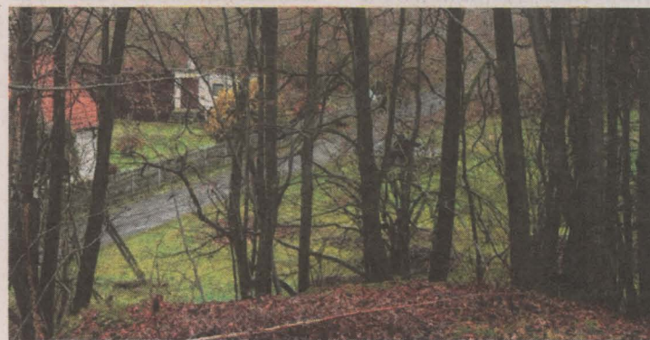
Widok z Ogrójca na ul. Młyńską; na końcu wzniesienia cmentarzisko okolone drzewami