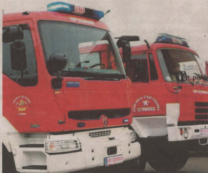
Takie cacka dostali strażacy w Szumowie i Łętownicy