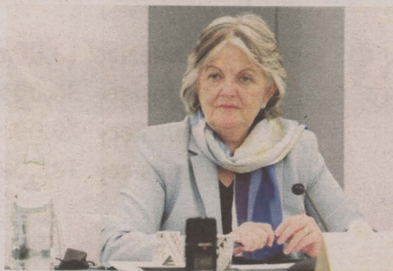
Elisa Ferreira, komisarz ds. spójności i reform

Inne kluczowe filary modernizacji, które otrzymają wsparcie, to potencjał badawczo-innowacyjny oraz rozwój rozwiązań cyfrowych w przedsiębiorstwach i sektorze publicznym. 12,9 mld