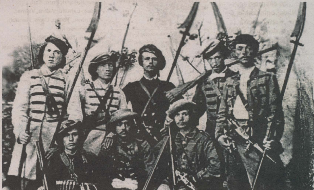
Kosynierzy 1863 roku