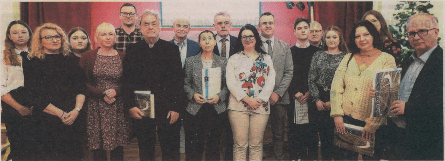
Laureaci i jury Konkursu Fotograficznego „Założenie 2022”

Wyniki V Ogólnopolskiego Konkursu Fotograficznego „Założenie 2022”, zorganizowanego przez Zarząd Główny TPZŁ, ogłoszone zostały w czasie uroczystego Spotkania Noworocznego z podsumowaniem, gratulacjami i życzeniami.