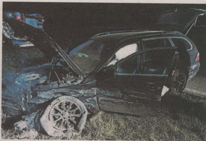
Znowu paliło się auto na S8 Warszawa – Białystok: na wysokości miejscowości Gosie Małe (gm. Kołaki Kościelne) niespodziewanie pojawił się ogień pod maską audi Q5, jadącego z przyczepą kempingową w kierunku Białegostoku. Kierowcy (69 lat) z powiatu kieleckiego i podróżującej z nim żonie, nic się nie stało. Choć samochód został ugaszony, nie nadaje się do dalszej eksploatacji. Ocalała przyczepa kempingowa.