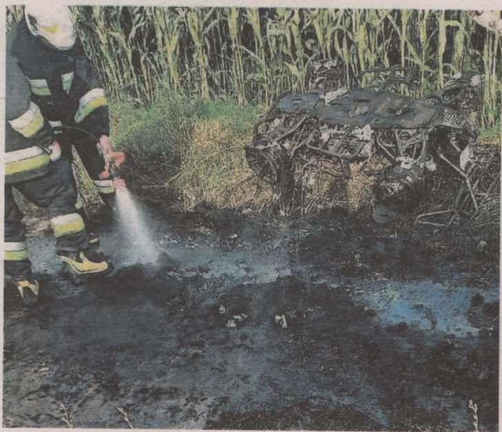
Tyle zostało z guada, który zapalił się na polnej drodze w okolicach Dąbrówki Kościelnej (gm. Szepietowo). Kierowcy nic się nie stało.