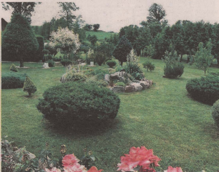
Trzecie miejsce Jamiołki Piotrowięta nr 7

Właściciele posesji w Kruszewie-Wypychach nr 14 A zajęli pierwsze miejsce w konkursie gminy Sokoły na najpiękniejszą posesję. Drugie miejsce należy do gospodarzy posesji w Sokołach przy ul. Solidarności 12. Dwie równorzędne trzecie nagrody jury przyznało właścicielom posesji w Kruszewie-Wypychach nr 24 oraz