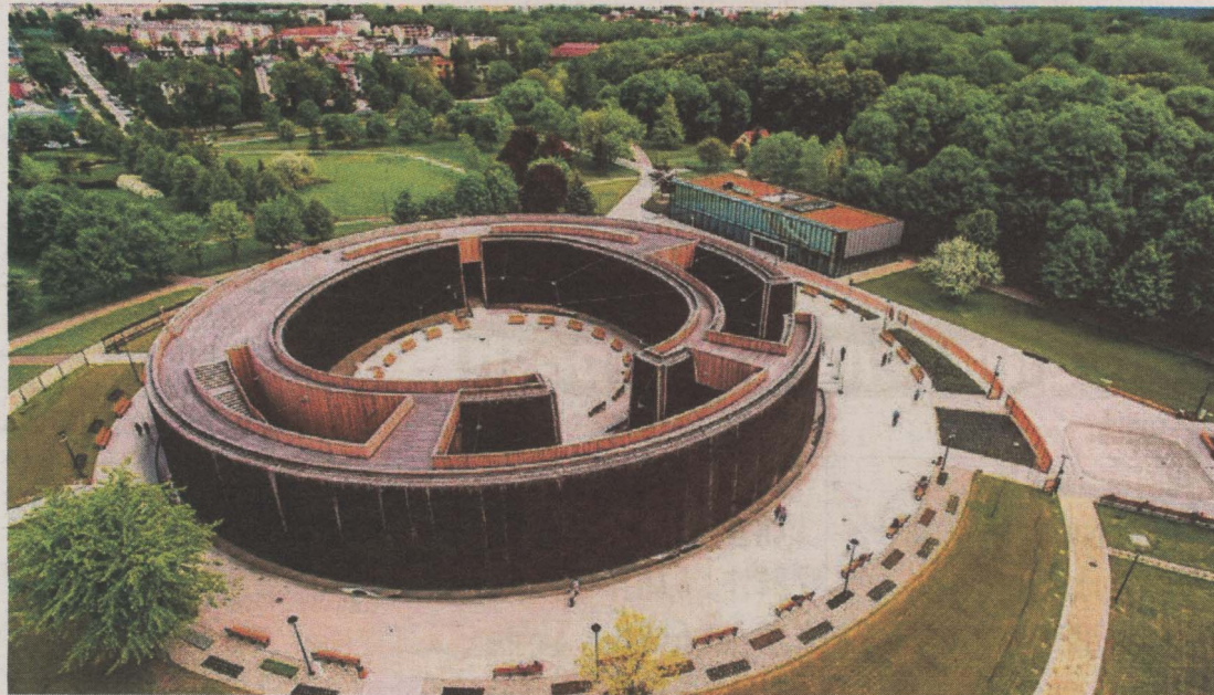
Tężnia solankowa w Busku Zdroju