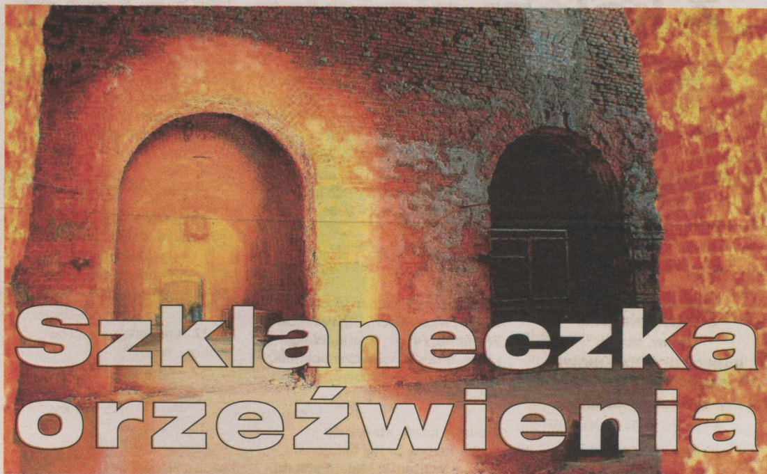
Piwnice browaru Lutosławskich, zniszczonego przez Niemców 11 września 1944; stan w 2009 roku.

Nie tylko piwo serwowała restauracja hotelu „Metropol” (założony w 1910 r.).