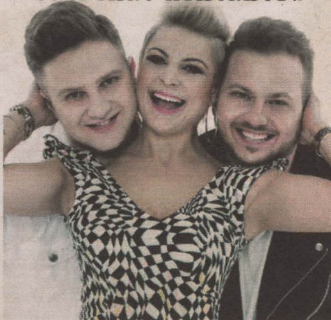
Piękni i Młodzi