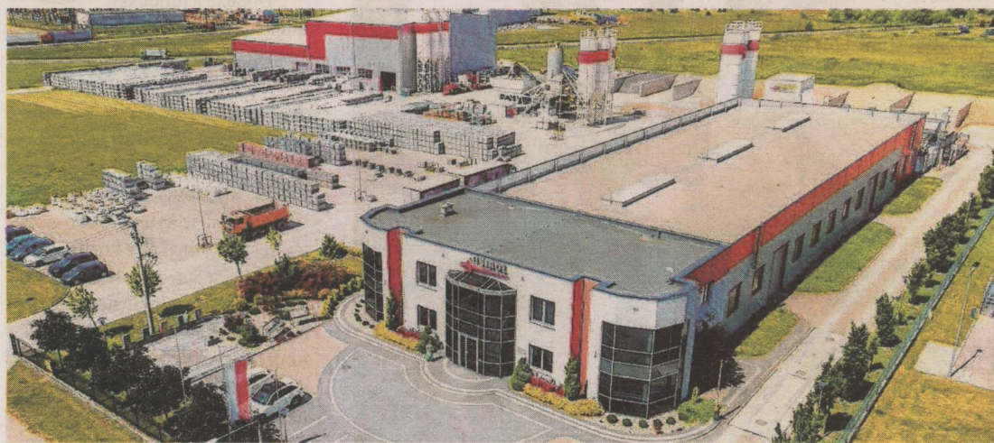
Unirol istnieje od 1989 r., zatrudnia około 60 osób.

Grajewskie przedsiębiorstwo Unirol rozpoczęło produkcję świecącej po zmroku kostki brukowej. Stało się to możliwe, bo zawiera specjalne luminofory, które pochłaniają energię w dzień, a w nocy emitują ją w postaci światła. Dzięki temu, na przykład miejskie chodniki i drogi rowerowe, mogą być bardziej bezpieczne. Unirol zainwestował w innowacje po-