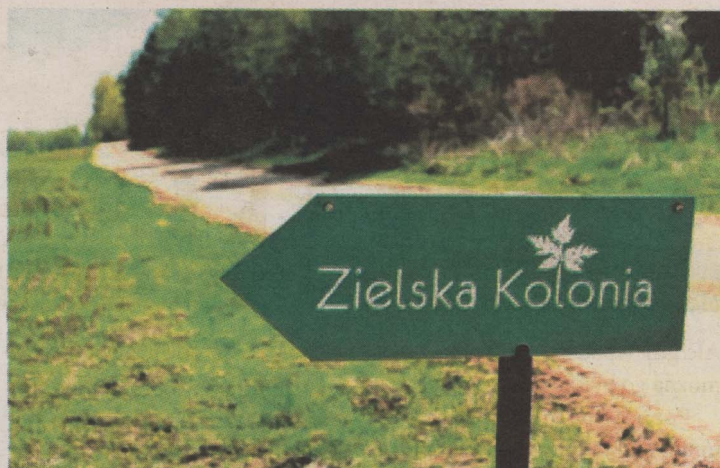
Drogowskaz w Knyszewiczach prowadzi wprost do rodzinnego domu

Powoli poszerzała domową produkcję, zwiększał się krąg klientów zainteresowanych jej wyrobami. W założeniu działalności wspomogła ją Lokalna Grupa Działania „Szlak tatarski”.