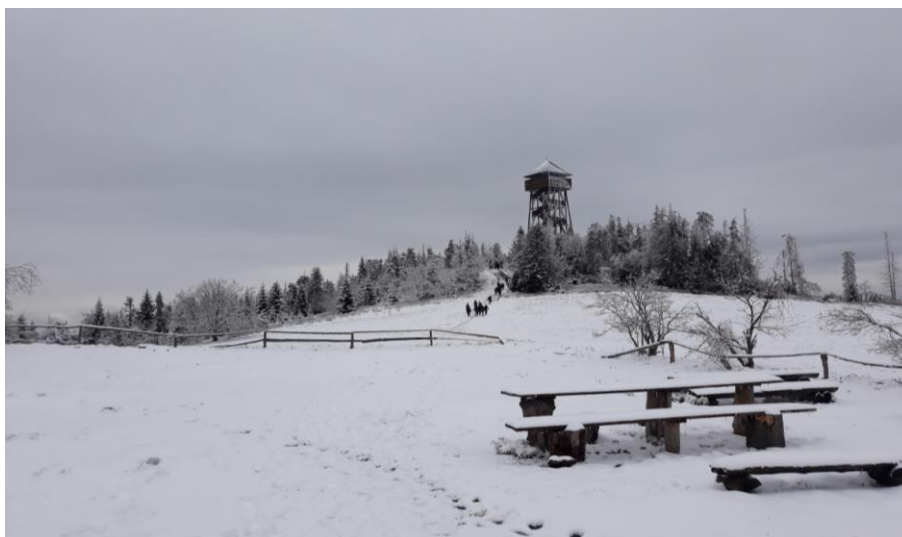
Wieża widokowa na Lubaniu (1211 m n.p.m)