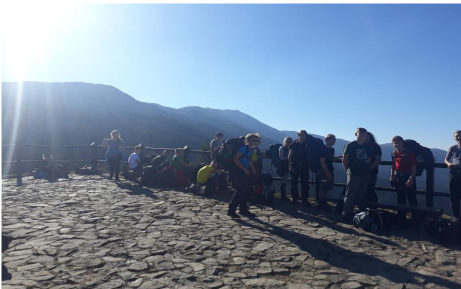
Punkt widokowy na Sokolicy (1367 m n.p.m.).