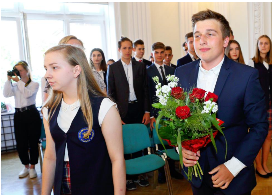
Delegacje klas trzecich do złożenia kwiatów pod tablicami pamiątkowymi – występ!