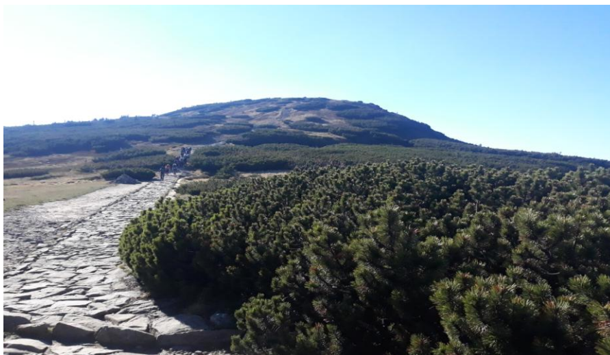
Już niedaleko. Ten kamienny chodnik wyprowadza na Babią Górę.