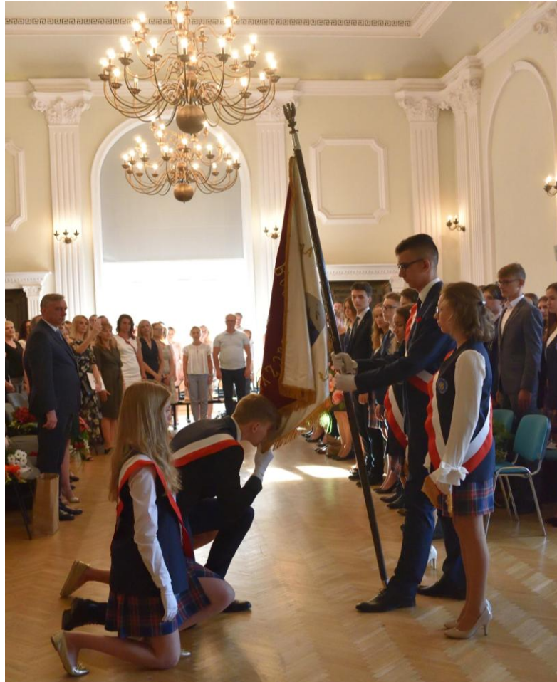
Pożegnanie Sztandaru Szkoły...