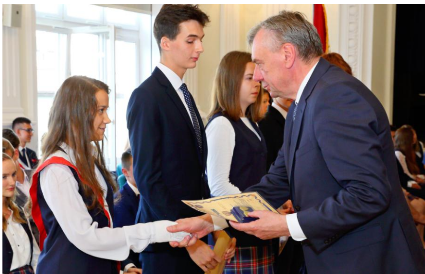
Wytężona praca przynosi piękne wyniki. Nagrodzonych było wielu...