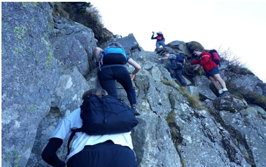
Emocje były... Pod czujnym okiem przewodnika.