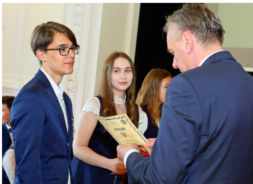
Czas je wręczyć...