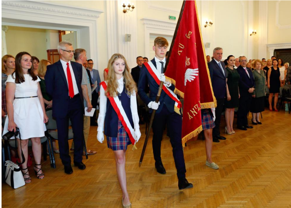
Sztandar Szkoły – wprowadzić!