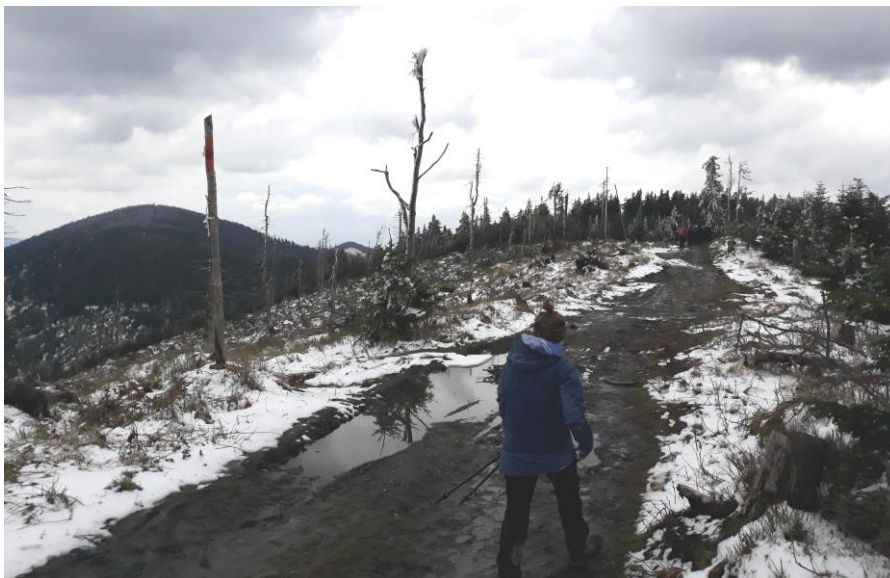
W drodze na Radziejową (1262 m n.p.m ). Widoczna po lewej.