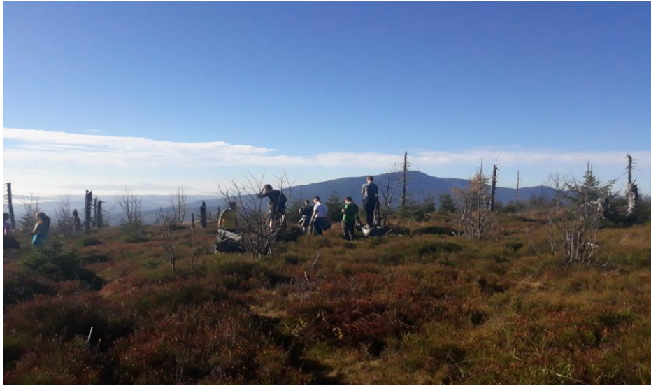
W oddali ukazała się Królowa Niepogody...