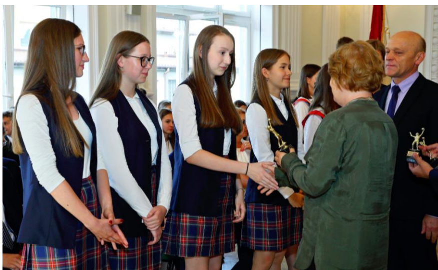
Pamiętaliśmy także o sukcesach sportowych.