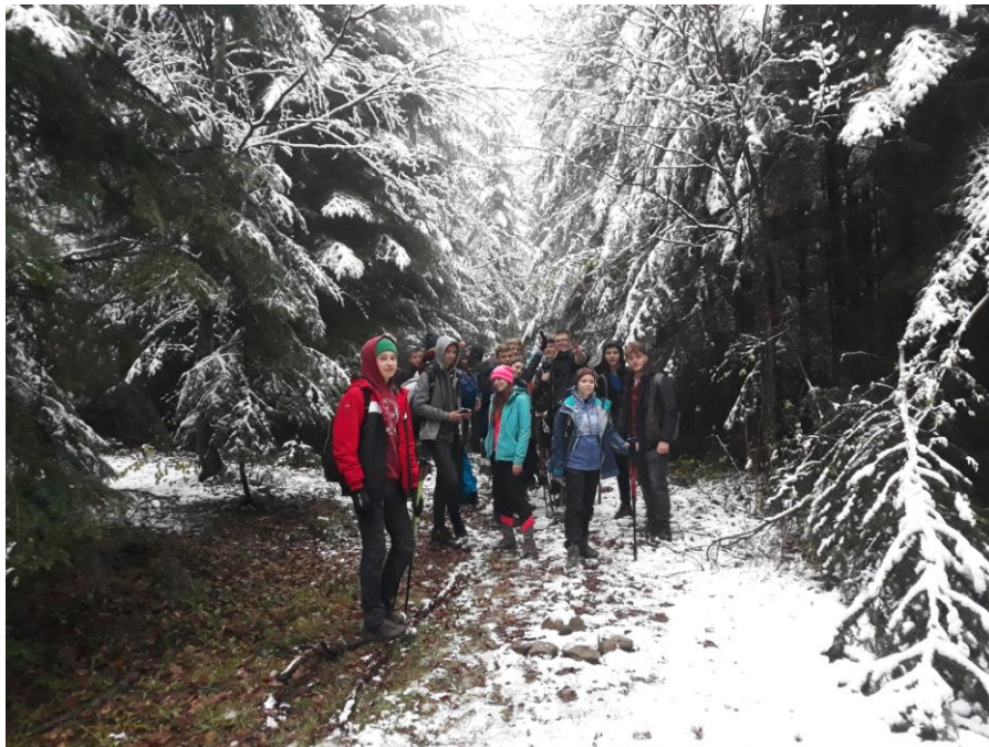
Ostatnio mamy szczęście do śniegu i w maju, i w październiku.