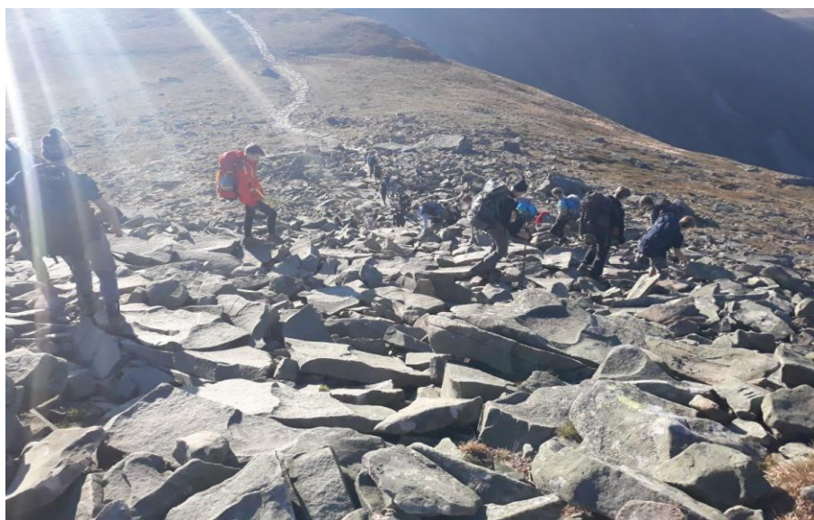
I już po drugiej stronie... Zejście z kopuły szczytowej.