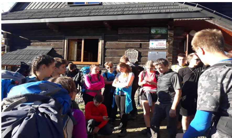
Przed Schroniskiem na Hali Krupowej. Omawianie planu dnia.