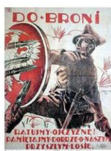
1918-20 R. CZEŚĆ IM I CHWAŁA! ŁOMŻA 1921.

Takie spojrzenie na listopadowe Narodowe Święto Niepodległości od wielu lat wyznacza sposoby jego przeżywania w Zespole Szkół nr 1 w Łomży, czyli w I Liceum Ogólnokształcącym i Publicznym Gimnazjum nr 6 im. Tadeusza Kościuszki. Jest to spojrzenie, z różnych ujęć, na dokonania tych, którzy z miłości do Polski nie pozwalali jej rozpaść się zwątpieniem, że kiedyś będzie wolna i którzy w ciemnych czasach zaborów budowali ją, by mogła na nowo odrodzić się, gdy pojawią się ku temu sprzyjające okoliczności. To jednocześnie utrwalanie uczuć patriotycznych i stwarzanie możliwości ich wyrażania oraz wspólnego przeżywania. Tak też było w naszej Szkole i teraz – w setną rocznicę odzyskania przez naszą Ojczyznę wolności.