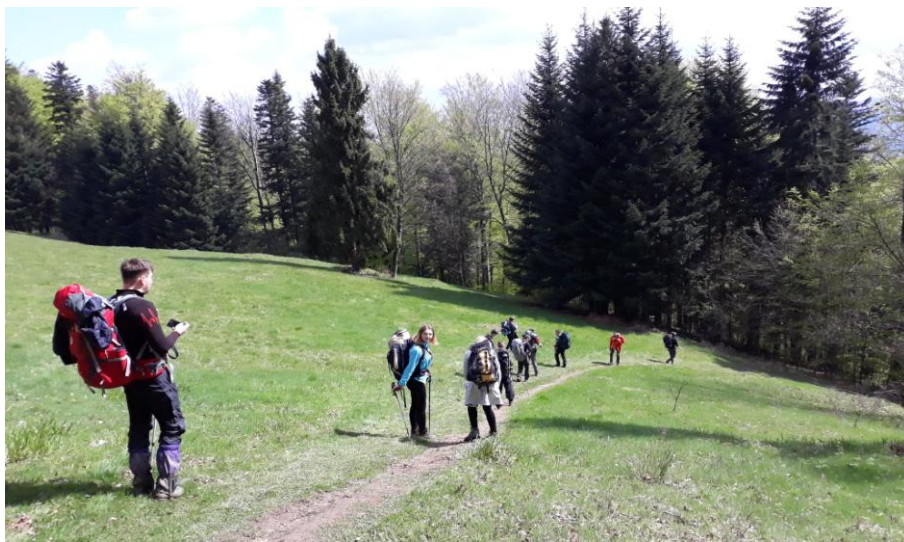
A jeszcze niżej całkiem zielono...