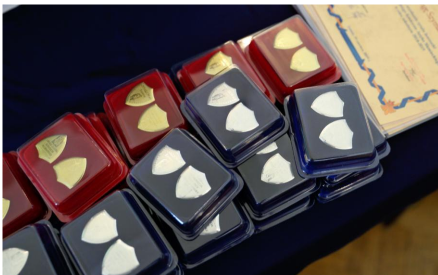
A Złote i Srebrne Tarcze już czekają...