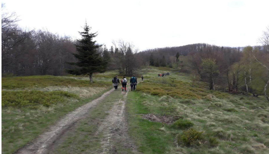
A tu wędrujemy na Halę Łabowską.