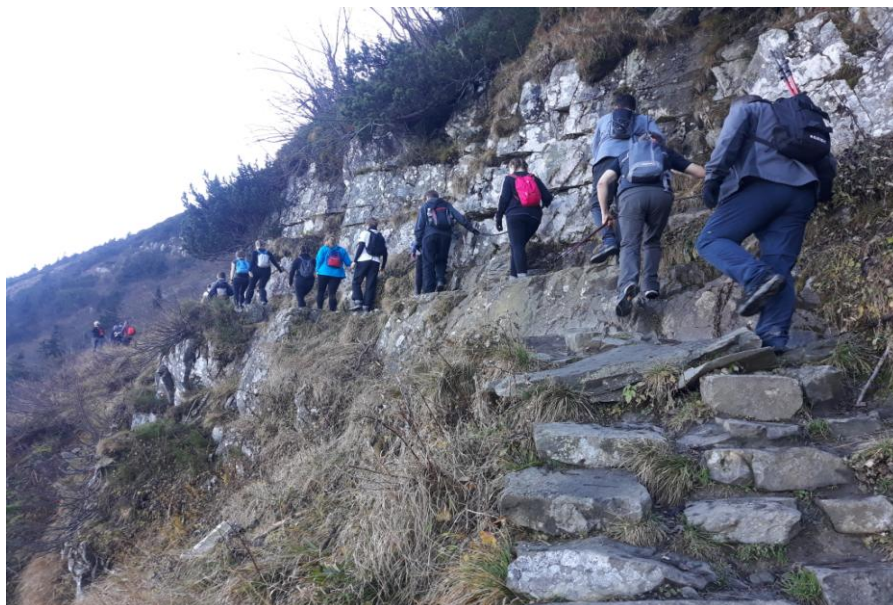
Perć Akademików, czyli odrobina Tatr w Beskidzie Żywieckim.