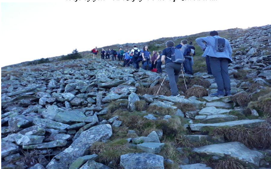
Diablaka jeszcze nie widać, ale to już końcowy odcinek tego szlaku.