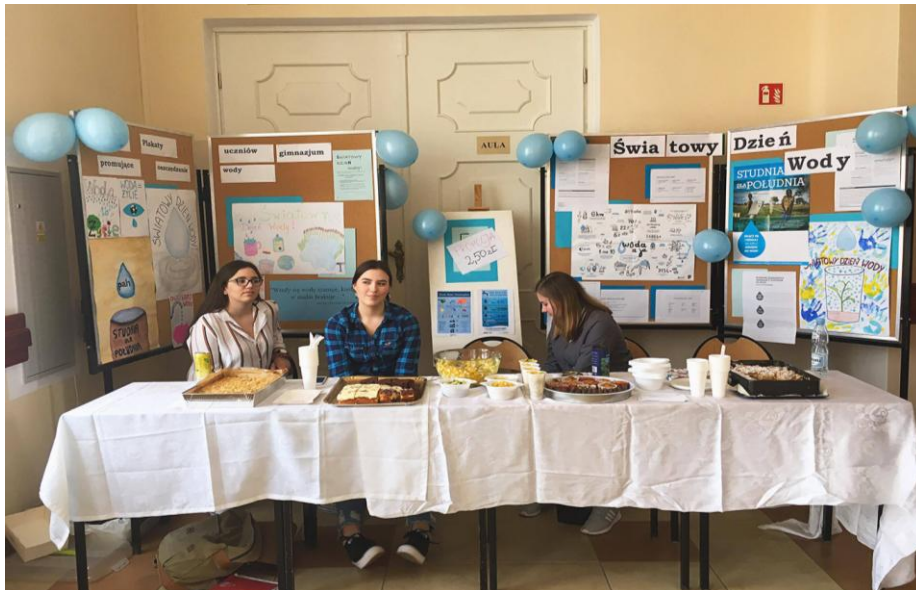
Uczniowie PG 6 w trakcie jednej z akcji (kawiarenka z okazji Światowego Dnia Wody).