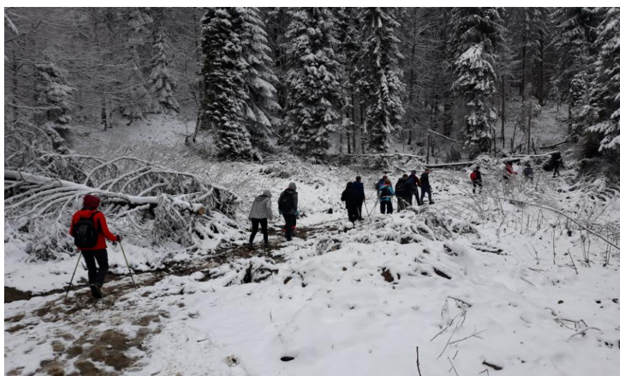
No to ruszamy w stronę kolejnego rajdu... Spotkajmy się na szlaku!!!