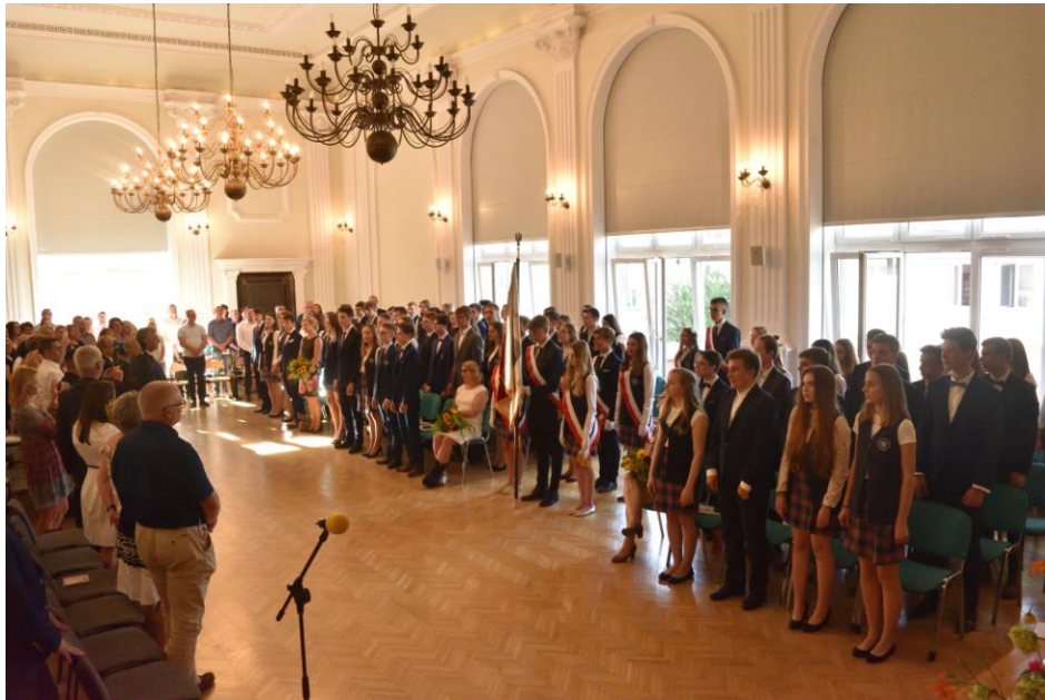
Pamiętna uroczystość zakończenia nauki w Publicznym Gimnazjum nr 6.