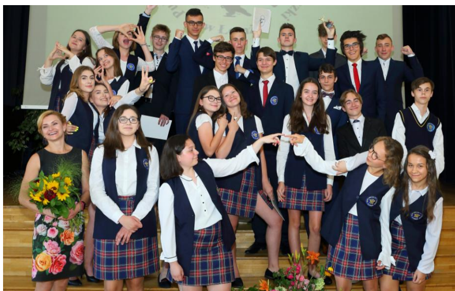
„Nie odnajdzie więcej nas ta sama chwila...”