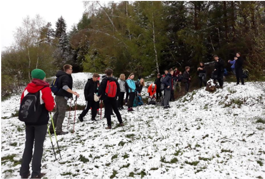
Na wysokości ok. 1000 m n.p.m. spotkaliśmy śnieg!