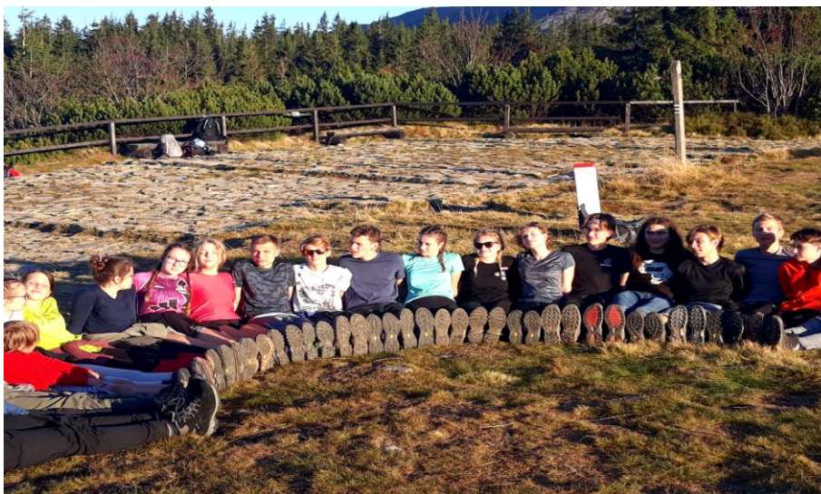
Sprawdzenie stopnia przyczepności butów na Przełęczy Brona. Żegnaj Babia Góra!