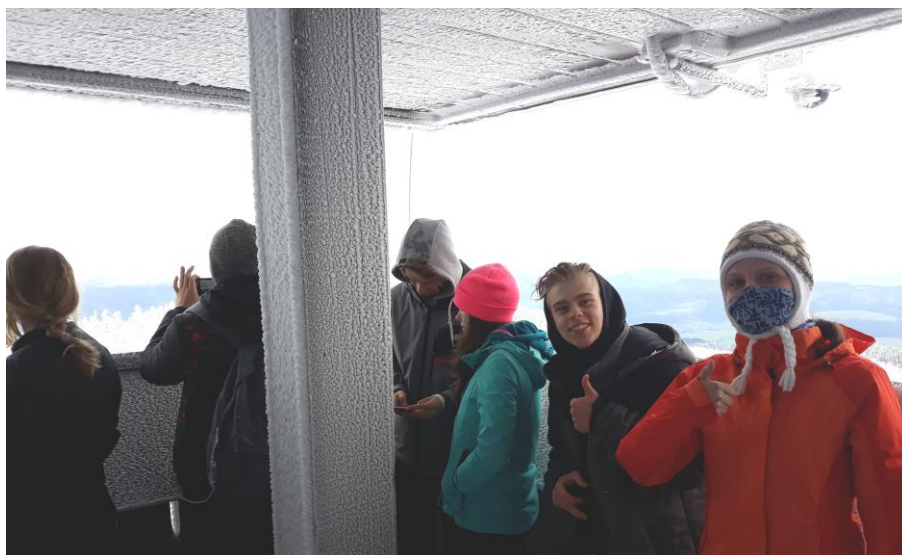
Na wietrznej i oszronionej wieży...