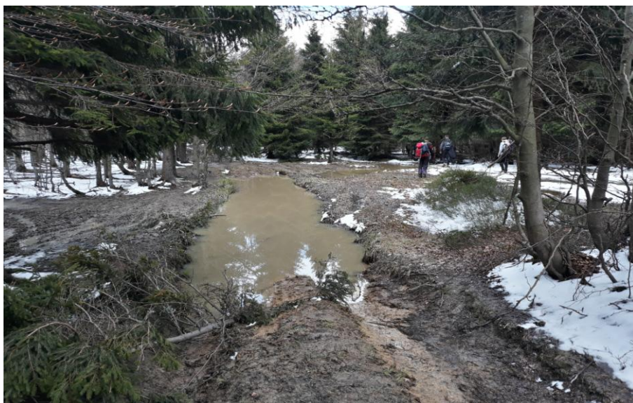
Na rajdach wiosennych niestety bywa również tak...