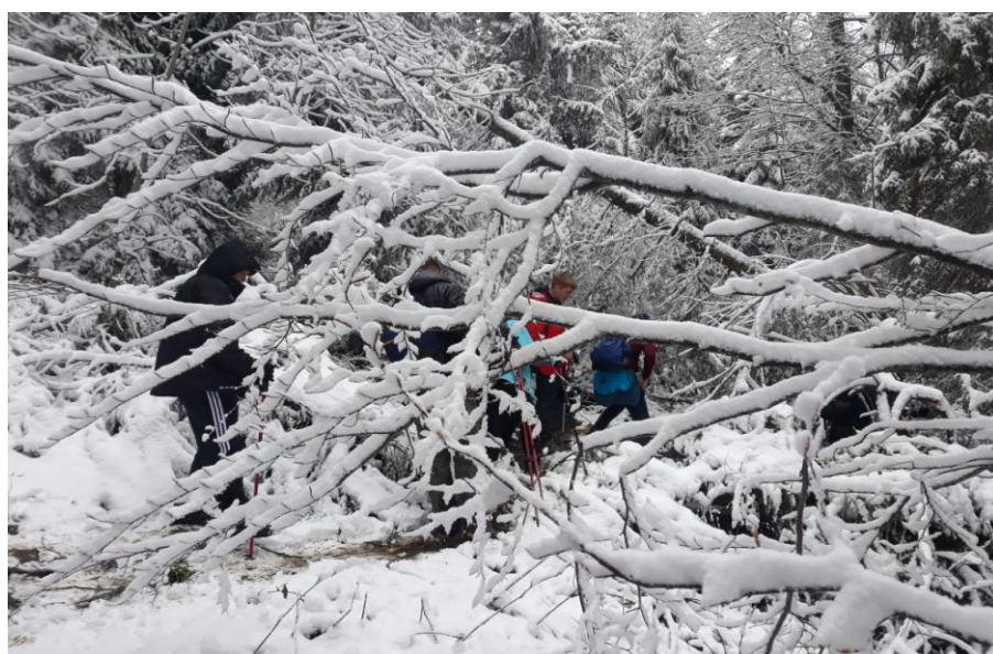
Majowe klimaty w Beskidzie Sądeckim.