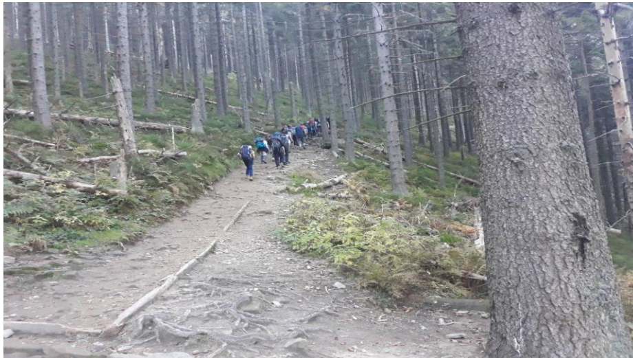
Początek podejścia na Babią Górę z Przełęczy Krowiarki.