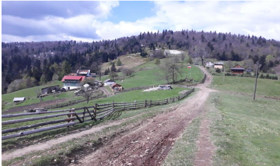
A 300 m niżej na przełęczy Przysłop – wiosna.