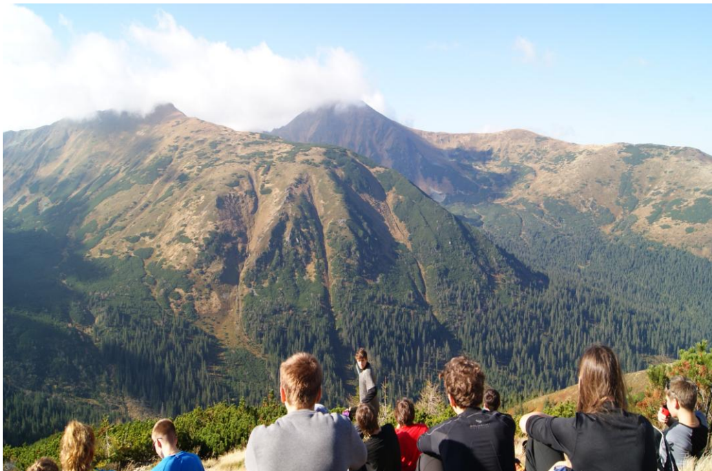
Jesienne widoki w Tatrach Zachodnich potrafią zachwycić...

8 października – rano, kiedy góralskie dzieci wędrowały w stronę szkół, my dotarliśmy do stolicy polskich Tatr. Wysiedliśmy u wylotu Doliny Małej Łąki, a po uiszczeniu opłat wstępu do Parku Narodowego, ruszyliśmy w trasę. Maszerując przy dobrej pogodzie do góry, niektórzy wreszcie się obudzili, a po osiągnięciu Przysłopu Miętusiego (1187 m n.p.m.) mogli odpocząć, zjeść śniadanie oraz podziwiać piękne, jesienne widoki na Kominiarski Wierch i Czerwone Wierchy. Dróżka, zwana Ścieżką nad regłami, sprowadziła nas później na dno Doliny Kościeliskiej. Od tego miejsca czarny szlak jest jednak zamknięty z powodu zniszczeń, jakich dokonał halny z grudnia tamtego roku, zostaliśmy więc zmuszeni, aby dojść do schroniska na Polanie Ornak.