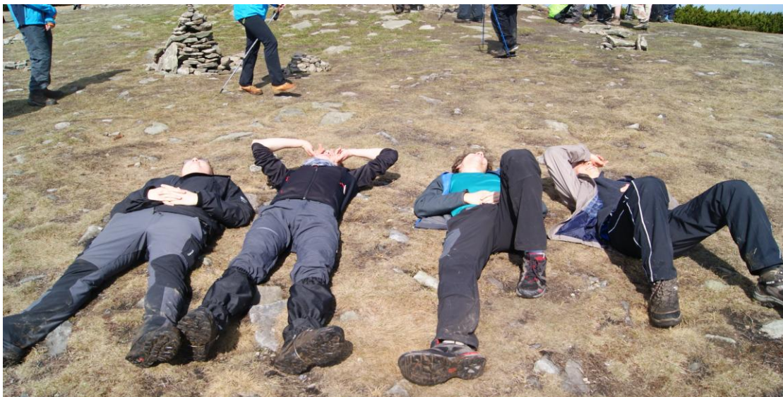
Czyżby braki kondycyjne? Czy po prostu słoneczne kąpiele?

7 maja – rano wita nas piękną pogodą. Może jest trochę wietrznie, ale dość słonecznie. Po śniadaniu, na lekko, ruszamy na Pilsko. To po Babiej Górze drugi szczyt Beskidu Żywieckiego i znany ośrodek narciarski. Wędrujemy żółtym szlakiem, trawersującym zbocze góry i po kilkunastu minutach wchodzimy w leżące centralnie na szlaku duże płyty śniegu. Jest ślisko i grząsko. Ci z nas, którzy nie mają kijków trekkingowych, przeżywają swój mały Everest. W kosówce śniegu już nie ma, więc bez problemów zdobywamy oba wierzchołki Pilska (1543 i 1557 m n.p.m.). Po obowiązkowej sesji zdjęciowej schodzimy czarnym szlakiem wzdłuż wyciągów narciarskich. Jest dość stromo, o czym kilka osób przekonuje się na własnych odwołkach. Miejscami leżą rozległe płyty śniegu, które posłużyły do czyszczenia garderoby sposobem pupozjazdów. W schronisku zabieramy plecaki i objuczeni rozpoczynamy dalsze wędrowanie.