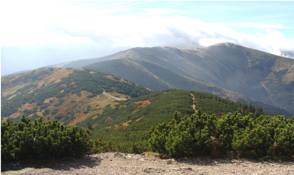
Tatry czekały na nas z podejrzanym wałem chmur nad granią