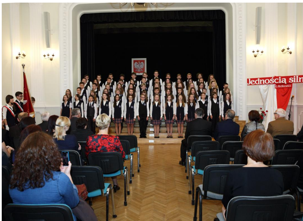
Trzeba przyznać, że gimnazjaliści prezentują się bardzo ładnie