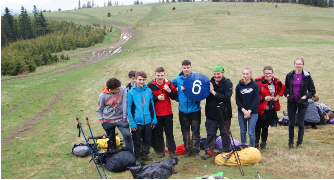
Grupa z PG 6 gotowa do boju!