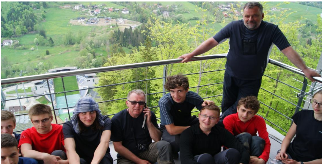
Na wieży widokowej skoczni w Wiśle Malince

9 maja – po śniadaniu ruszamy w kierunku Wisły (czytaj: miasta). Trochę szlakiem, trochę poza nim, ale po paru godzinach docieramy do dzielnicy Malinka słynącej z nowej skoczni narciarskiej. Takiej okazji nie można było przepuścić. Część grupy pilnuje plecaków, a chętni wjeżdżają wyciągiem krzesełkowym na górę, aby następnie (za drobną opłatą) wejść jeszcze na taras widokowy na wieży skoczni. Obiekt wygląda imponująco. Po powrocie i nawiązaniu kontaktu z kierowcą, robimy się na bóstwa, czyli przygotowujemy do drogi powrotnej. Jeszcze postój w centrum Wisły, jeszcze pizza, jeszcze lody i trasa do domu. Wyszadzamy warszawiaków, zambrowiaków i 10 maja nad ranem szczęśliwie docieramy do Łomży.