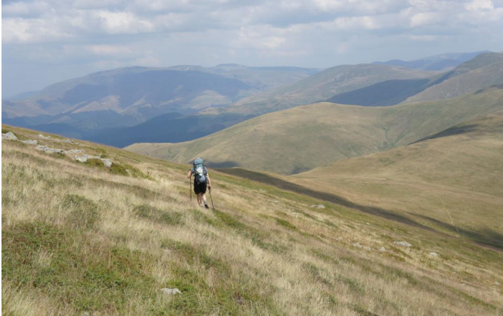
Na poloninach pasma Godeanu

Na początku sierpnia 2015 r. grupa składająca się z części kadry, absolwentki naszej szkoły oraz klubowych przyjaciół wybrała się na trekking do Rumunii. To druga klubowa wyprawa w Karpaty Południowe. Poprzednio byliśmy w Alpach Rodniańskich, a tym razem w pasmach Godeanu i Retezat. Zdobyliśmy między innymi: Varful (szczyt) Godeanu – 2229 m n.p.m., Vf. Bucura – 2433 m n.p.m., Vf. Papusa – 2508 m n.p.m. oraz Vf. Peleaga – 2509 m n.p.m. Na kilku zdjęciach pokazujemy klimat rumuńskich gór.