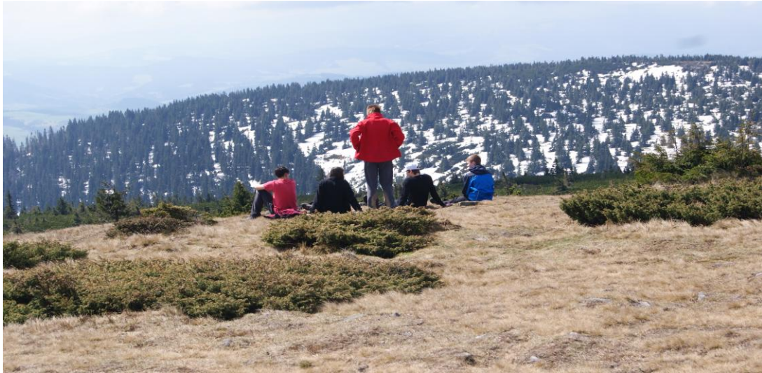
Odpoczynek na szczycie Pilska

7 maja – rano wita nas piękną pogodą. Może jest trochę wietrznie, ale dość słonecznie. Po śniadaniu, na lekko, ruszamy na Pilsko. To po Babiej Górze drugi szczyt Beskidu Żywieckiego i znany ośrodek narciarski. Wędrujemy żółtym szlakiem, trawersującym zbocze góry i po kilkunastu minutach wchodzimy w leżące centralnie na szlaku duże płyty śniegu. Jest ślisko i grząsko. Ci z nas, którzy nie mają kijków trekkingowych, przeżywają swój mały Everest. W kosówce śniegu już nie ma, więc bez problemów zdobywamy oba wierzchołki Pilska (1543 i 1557 m n.p.m.). Po obowiązkowej sesji zdjęciowej schodzimy czarnym szlakiem wzdłuż wyciągów narciarskich. Jest dość stromo, o czym kilka osób przekonuje się na własnych odwołkach. Miejscami leżą rozległe płyty śniegu, które posłużyły do czyszczenia garderoby sposobem pupozjazdów. W schronisku zabieramy plecaki i objuczeni rozpoczynamy dalsze wędrowanie.