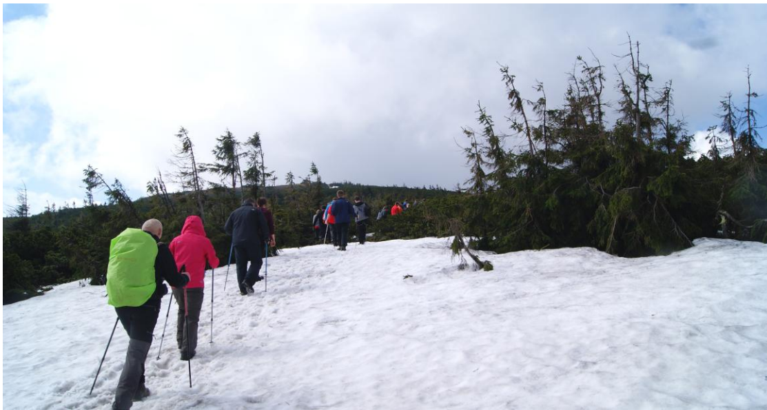
Wiosenne wejście na Pilsko