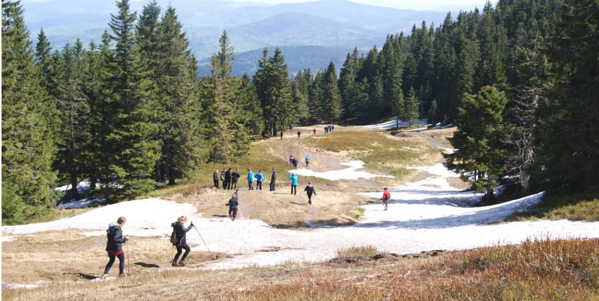
Wiosna w Beskidach

Szlak między Halą Miziową a schroniskiem na Rysiance przechodziliśmy wiosną już kilka razy i zawsze były na nim miejsca, w których nawet w maju rzucaliśmy się śnieżkami. Jednak w tym roku śniegu leżało wyjątkowo dużo. Poza tym był mokry i zapadał się pod idącymi. Jak ktoś miał szczęście, wpadał po kolana lub po pas, o czym przekonała się grupa naszych gimnazjalistów – specjalistów od mokrych przygód. Na Hali Rysianka (1290 m n.p.m.) mieliśmy postój, a następnie schodziliśmy stopniowo aż do schroniska na Hali Boraczej (860 m n.p.m.). Tutaj wypadł nasz drugi nocleg, jednak warunki w poprzednim schronisku były lepsze.