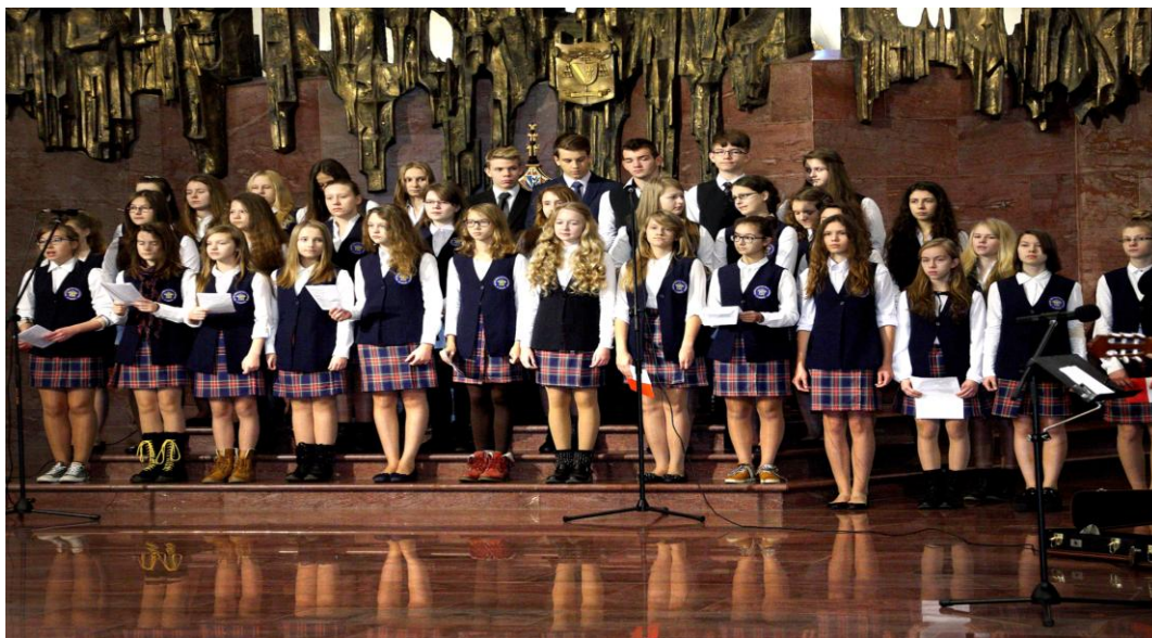
Szkolny chór przed głównym ołtarzem łomżyńskiej katedry