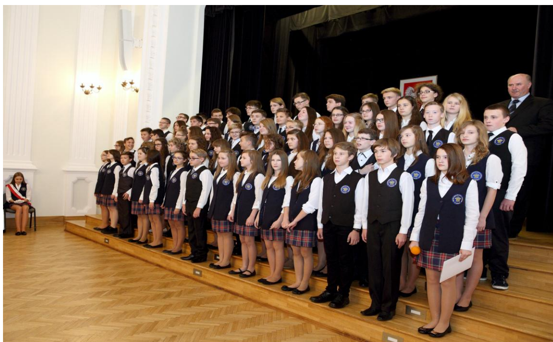
Na chwilę przed rozpoczęciem części popołudniowej gimnazjaliści ustawiają się na schodach szkolnej auli i oczekują na przybycie Dyrekcji, Rady Pedagogicznej oraz zaproszonych Gości