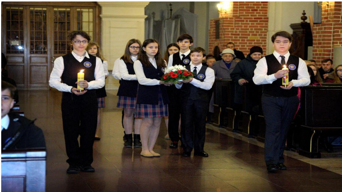
Msza święta w łomżyńskiej katedrze tradycyjnie rozpoczyna ten niezwykle dzień

Do listopadowej uroczystości ślubowania uczniów klas pierwszych przywiązuje się w naszej szkole wyjątkowe znaczenie. Uroczystość ta wpisuje się w szkolną tradycję, w ceremoniał i wyzwala silne emocje u wszystkich zaangażowanych w jej przygotowanie. Ślubowanie jest doskonałą okazją do współpracy nauczycieli, wychowawców, rodziców i całej społeczności uczniowskiej, gdyż wydarzenie to staje się tradycyjnie świętem całej społeczności Publicznego Gimnazjum nr 6 im. T. Kościuszki.