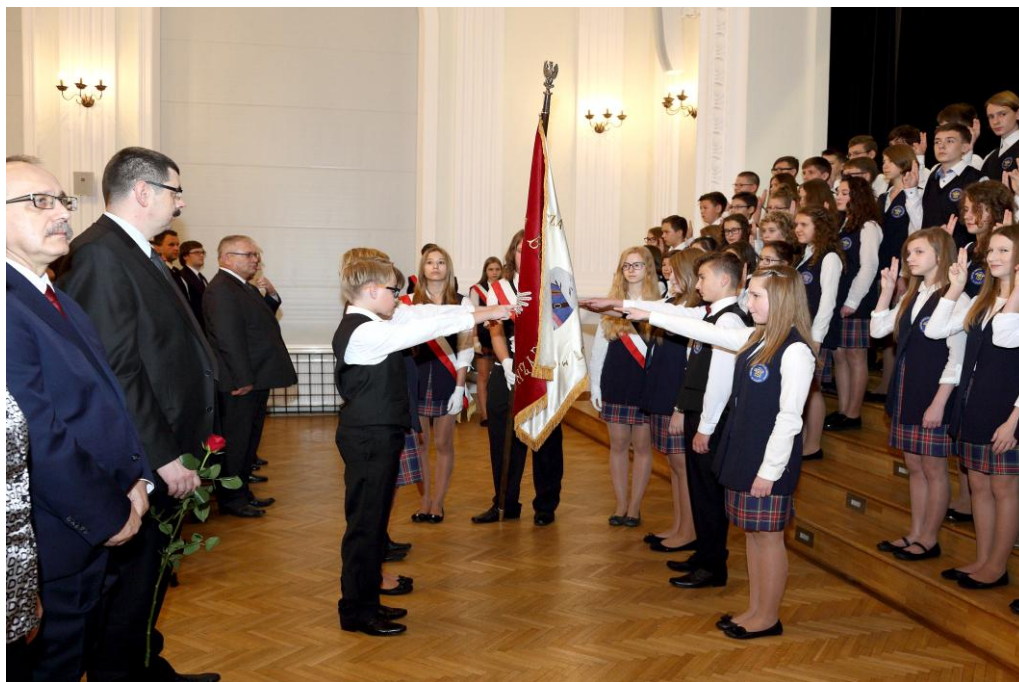
Ta chwila... Uroczystość ślubowania przedstawicieli obu klas pierwszych na sztandar Szkoły to najważniejsza część uroczystości