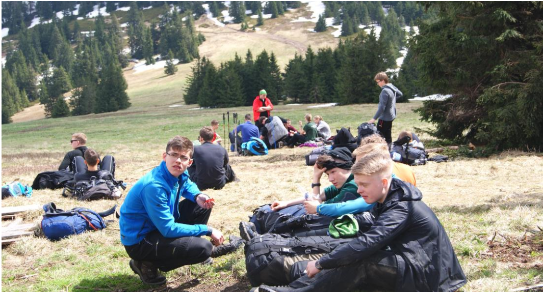
Odpoczynek po podejściu

9 maja – po śniadaniu ruszamy w kierunku Wisły (czytaj: miasta). Trochę szlakiem, trochę poza nim, ale po paru godzinach docieramy do dzielnicy Malinka słynącej z nowej skoczni narciarskiej. Takiej okazji nie można było przepuścić. Część grupy pilnuje plecaków, a chętni wjeżdżają wyciągiem krzesełkowym na górę, aby następnie (za drobną opłatą) wejść jeszcze na taras widokowy na wieży skoczni. Obiekt wygląda imponująco. Po powrocie i nawiązaniu kontaktu z kierowcą, robimy się na bóstwa, czyli przygotowujemy do drogi powrotnej. Jeszcze postój w centrum Wisły, jeszcze pizza, jeszcze lody i trasa do domu. Wyszadzamy warszawiaków, zambrowiaków i 10 maja nad ranem szczęśliwie docieramy do Łomży.