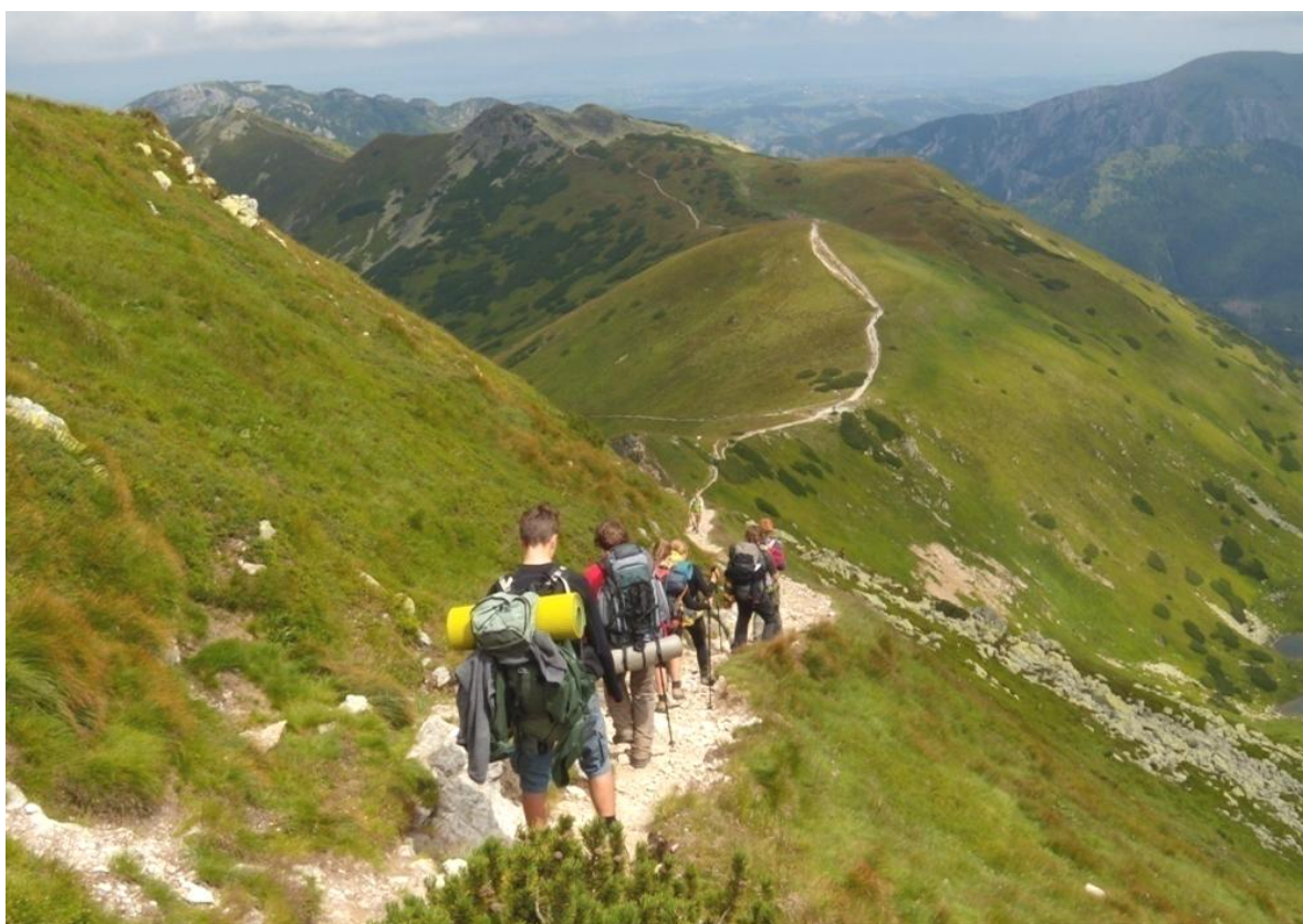
Tatry Zachodnie. Widoczna w dole przełęcz jest już po polskiej stronie