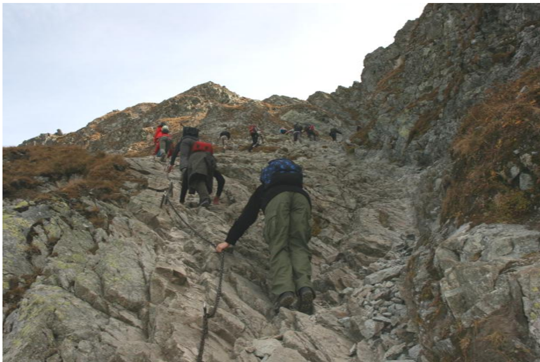
Łańcuchy w drodze na Szpiglasową Przełęcz

widokowo piękna, ale długa i obawialiśmy się, czy zdążymy przed zmrokiem. Przy dobrym tempie i sprzyjającej pogodzie udało nam się zrobić tę trasę w niecałe 7 godzin, a ostatni dotarli do schroniska na krótko przed zapadnięciem ciemności. Jak na dzień po nocnej podróży – mnóstwo wrażeń, ciekawa trasa i niezła kondycja.