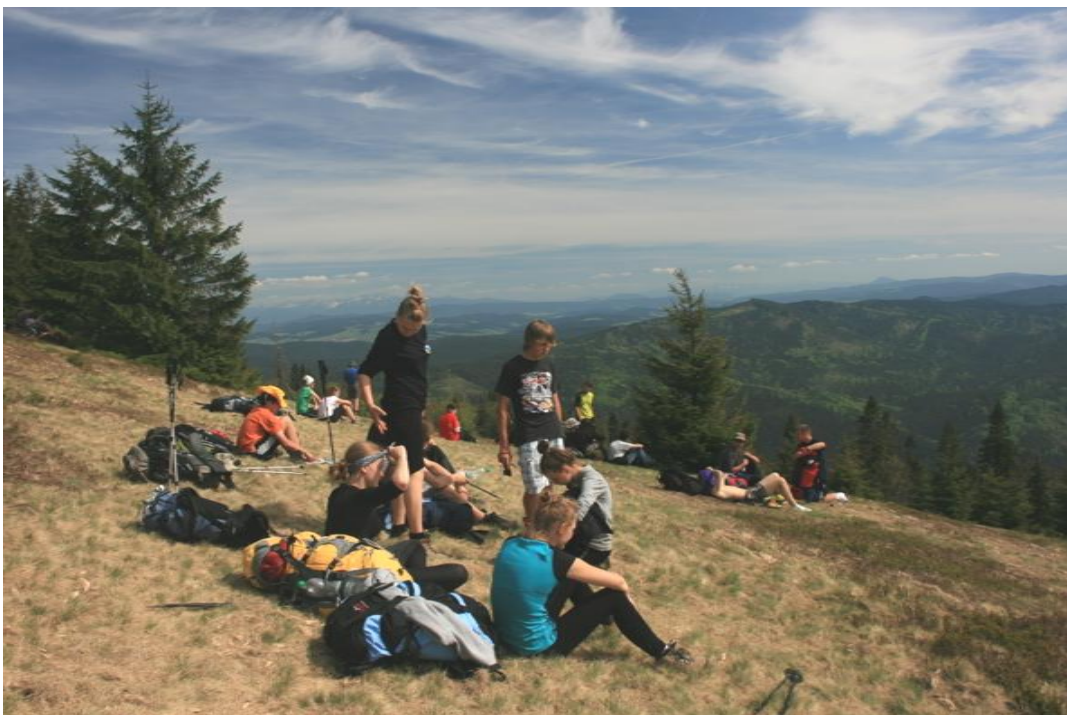
W drodze na Rysiankę