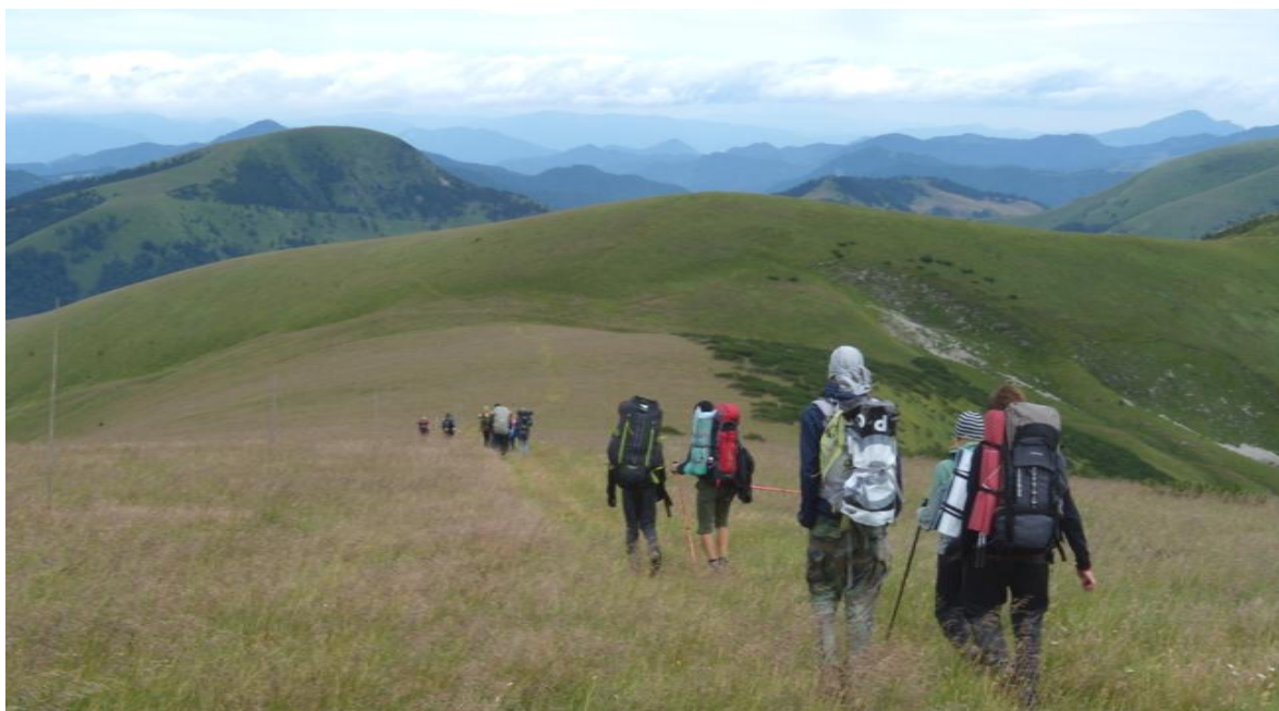
Granią Wielkiej Fatry...