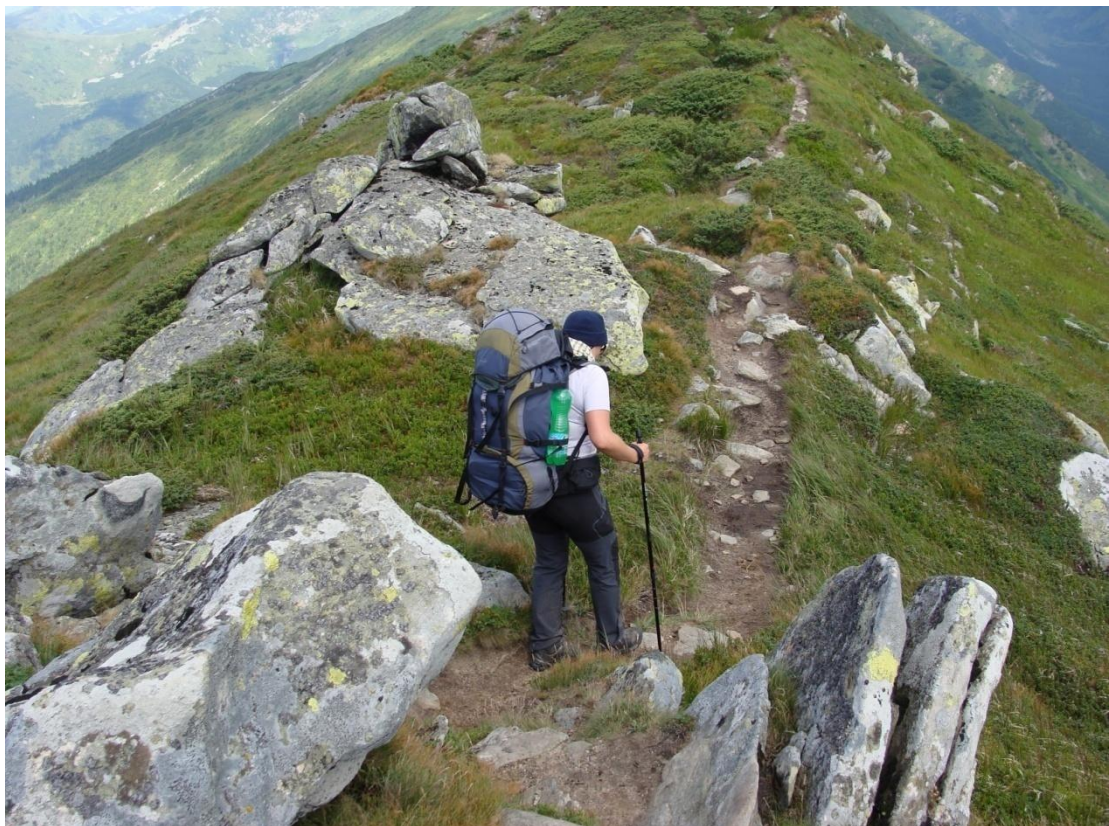
Miejscami grań się ciekawie zaostrza...