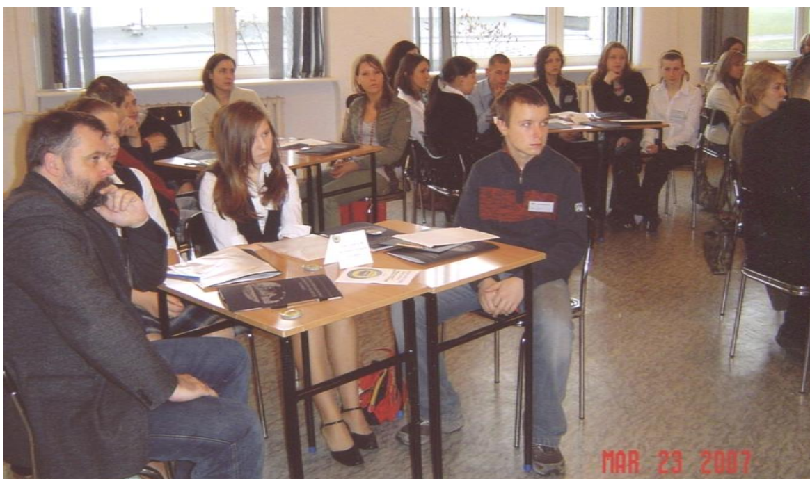
Delegacja Samorządu Uczniowskiego PG 6 w trakcie zajęć I Sejmiku