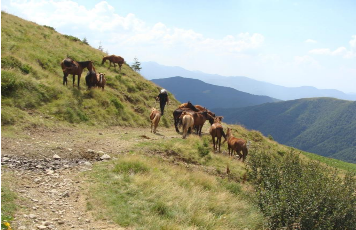
Miłe spotkanie na szlaku