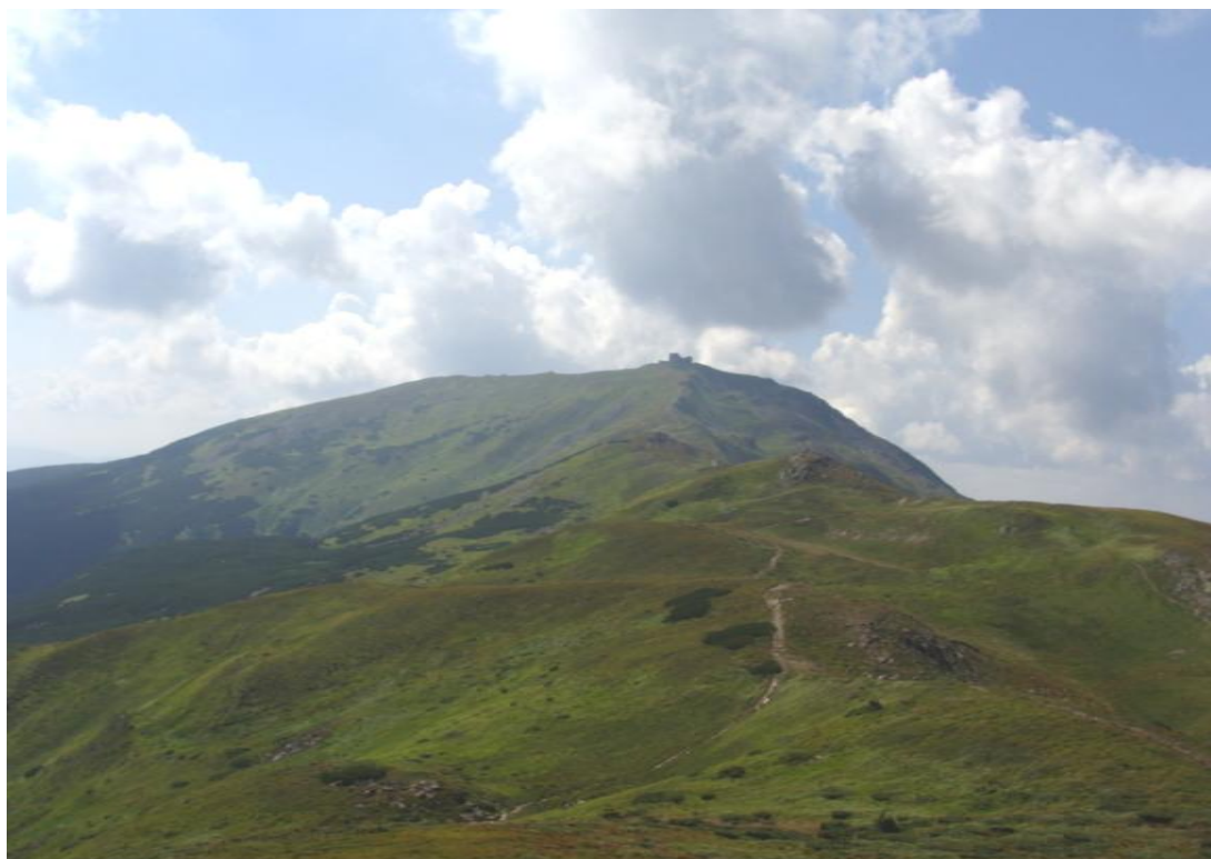
Pop Iwan – trzecia góra Ukrainy. Na szczycie widoczne ruiny polskiego, przedwojennego obserwatorium zwanego Białym Słoniem

Dziesięcioosobowa grupa, składająca się z klubowej kadry i przyjaciół, odwiedziła Ukrainę na początku sierpnia. Wędrowaliśmy głównym grzbietem pasma Czarnohora od miejscowości Dzembronia do wioski Kwasy. W tym czasie weszliśmy między innymi na Popa Iwana z ruinami polskiego obserwatorium ( 2022 m n.p.m. ) oraz Pietrosa ( 2020 m n.p.m. ) – drugi szczyt Ukrainy. Natomiast dwudniowa wycieczka w pasmo Świdowca zaowocowała zdobyciem najwyższej Bliźnicy (1883 m n.p.m.). Zamiast dokładnego opisu wyprawy proponujemy kilka zdjęć.