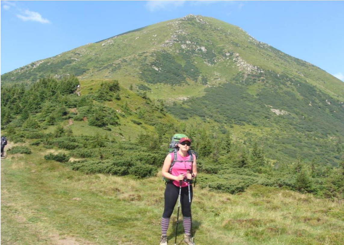
Pani profesor przed wejściem na czwartą górę Ukrainy – Pietros ( 2020 m n.p.m. )