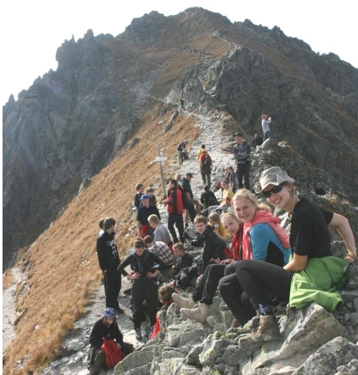
Na zdjęciu obok: grupa na Szpiglasowej Przełęczy

6 października – dzisiaj zejście z Piątki, kurs na Słowację i marsz jedynym szlakiem turystycznym przez Tatry Bielskie na nocleg w Dolinie Kieżmarskiej. Zrealizowaliśmy go w 100%. Zaraz po śniadaniu ruszyliśmy w dół Doliny Rزتoki. Między Wodogrzmotami Mickiewicza a Palenicą spory ruch – wycieczki dzielnie szosują asfaltem do Morskiego Oka. A my akurat w przeciwnym kierunku. Na parkingu czeka na nas autokar i przewozi do słowackiego Żdziaru. Tu rozpoczynamy przygodę z Tatrami Bielskimi. Żmudna, ale ciekawa i uroczą trasą na Szeroką Przełęcz Bielską (1826