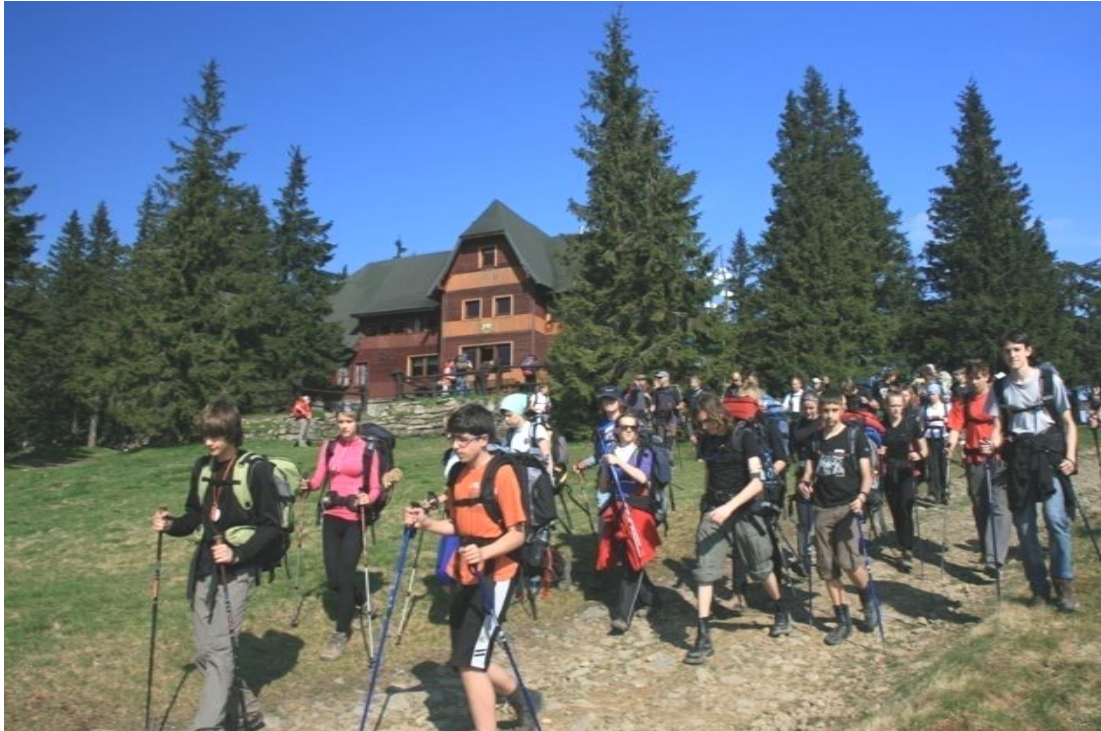
Grupa, jak widać, była wyjątkowo liczna