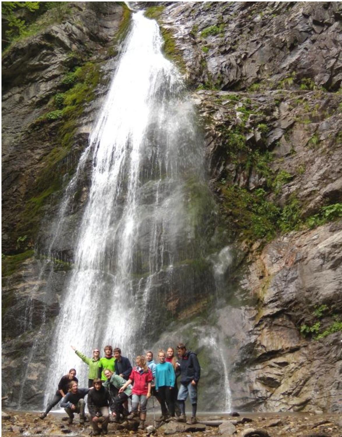
Na tle Szutowskiego Wodospadu. Urokliwy, prawda?