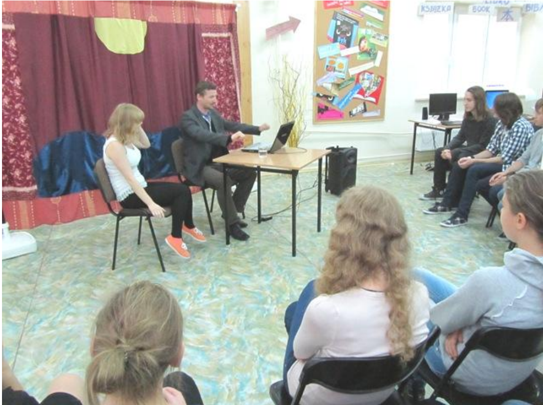
Fragment spektaklu „Mediatorka”