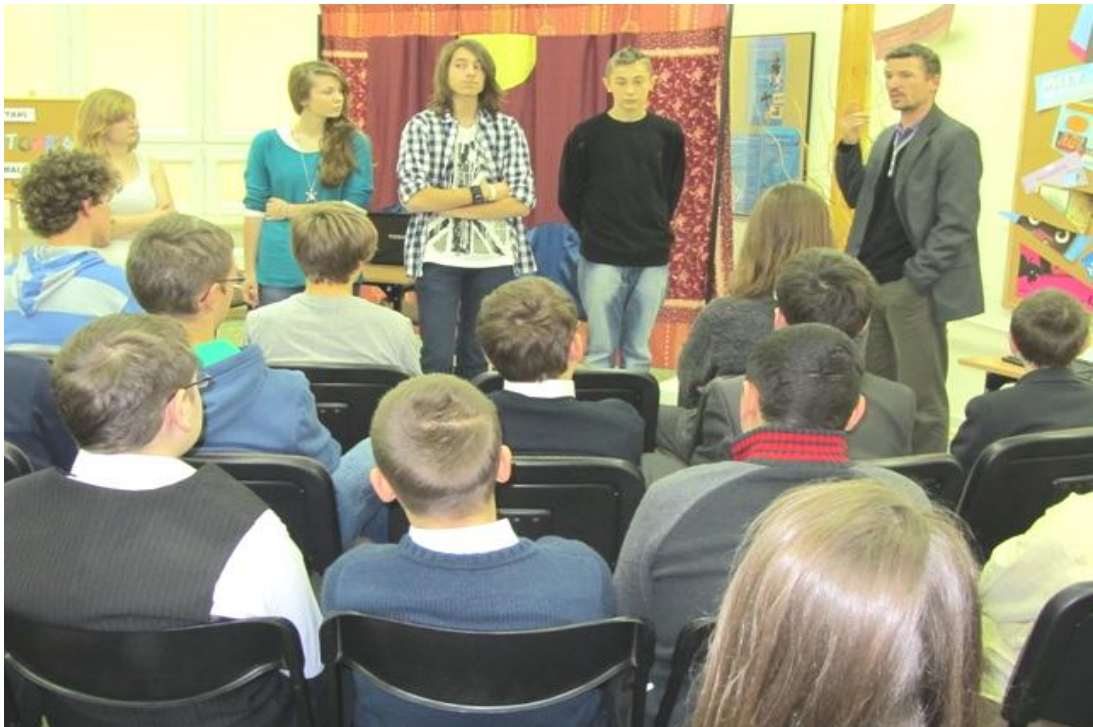
Zajęcia warsztatowe po przedstawieniu