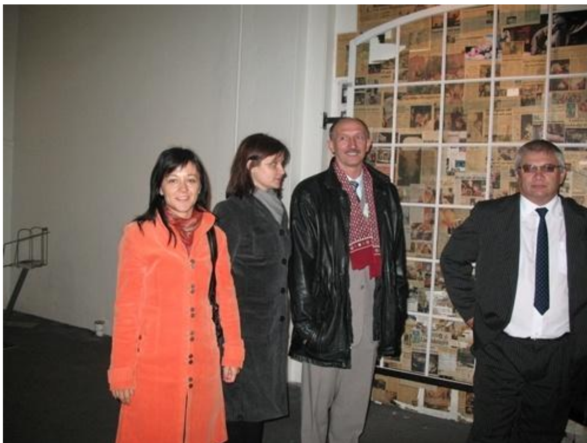
Wizyta w Centrum Nauki Tom Tits Experiment w Södertälje

Wspólne działania ze Szwecją nie skończyły się jednak. Rok później delegacja naszych przyjaciół z zagranicy gościła przez kilka dni w Łomży, a w grudniu tego samego roku miała miejsce kolejna wizyta przygotowawcza w Södertälje. Liczne spotkania i rozmowy skupiały się na kolejnym pomysle dotyczącym współpracy Łomży z Södertälje. Tym razem, biorąc pod uwagę fakt, że w Södertälje znajduje się główna siedziba firmy Scania AB, postawiono na współpracę między szkołami technicznymi. Opierając się na tym pomysle, postanowiono skorzystać z funduszy programu „Grundtvig”. Ustalenie to niestety automatycznie wykluczyło nasze liceum z możliwości wzięcia udziału akurat w tym projekcie, ponieważ jako szkoła ogólnokształcąca nie mogliśmy starać się o grant finansowy z tego źródła.