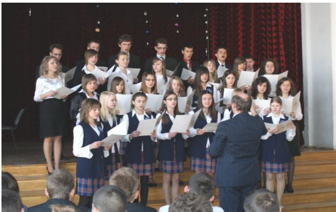
Wigilia 2009. Występ szkolnego chóru

W drugim półroczu roku szkolnego 2009/2010 Samorząd Uczniowski nadal realizował zadania wynikające z przyjętego planu pracy oraz kalendarza uroczystości szkolnych. I tak: