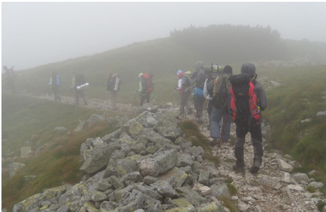
Na mglistym szlaku w Tatrach Niskich

25 lipca – jeszcze przed dotarciem do stolicy polskich Tatr zaczęło padać i lało cały dzień aż do północy. W tej sytuacji busem pojechaliśmy do Liptowskiego Mikulusza na Słowacji. Tam złapaliśmy autobus do Demianowskiej Doliny i późnym popołudniem, oczywiście w deszczu, rozbiliśmy namioty na kempingu Bystrina.