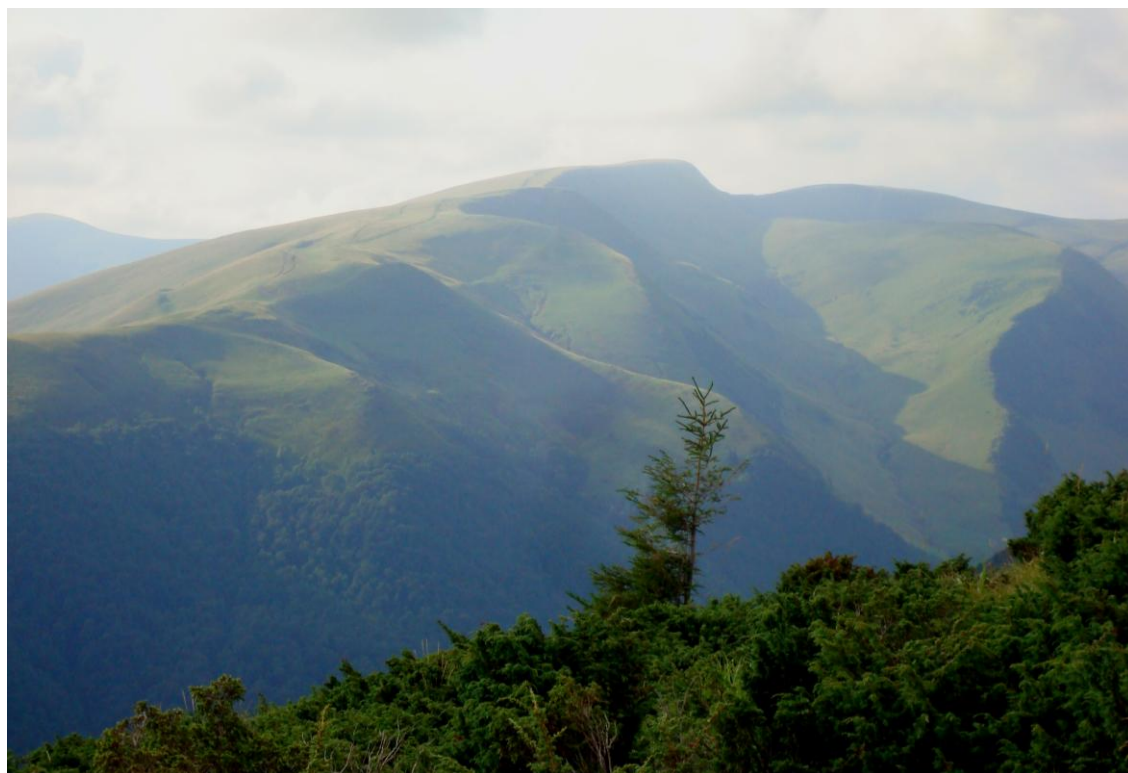
Zielone połoniny Świdowca