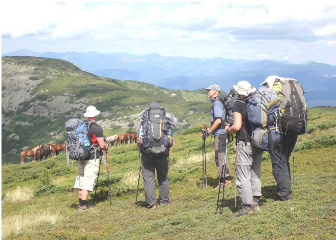
Sywula (1836 m n.p.m.) – królowa Gorganów To jest dopiero łono natury!