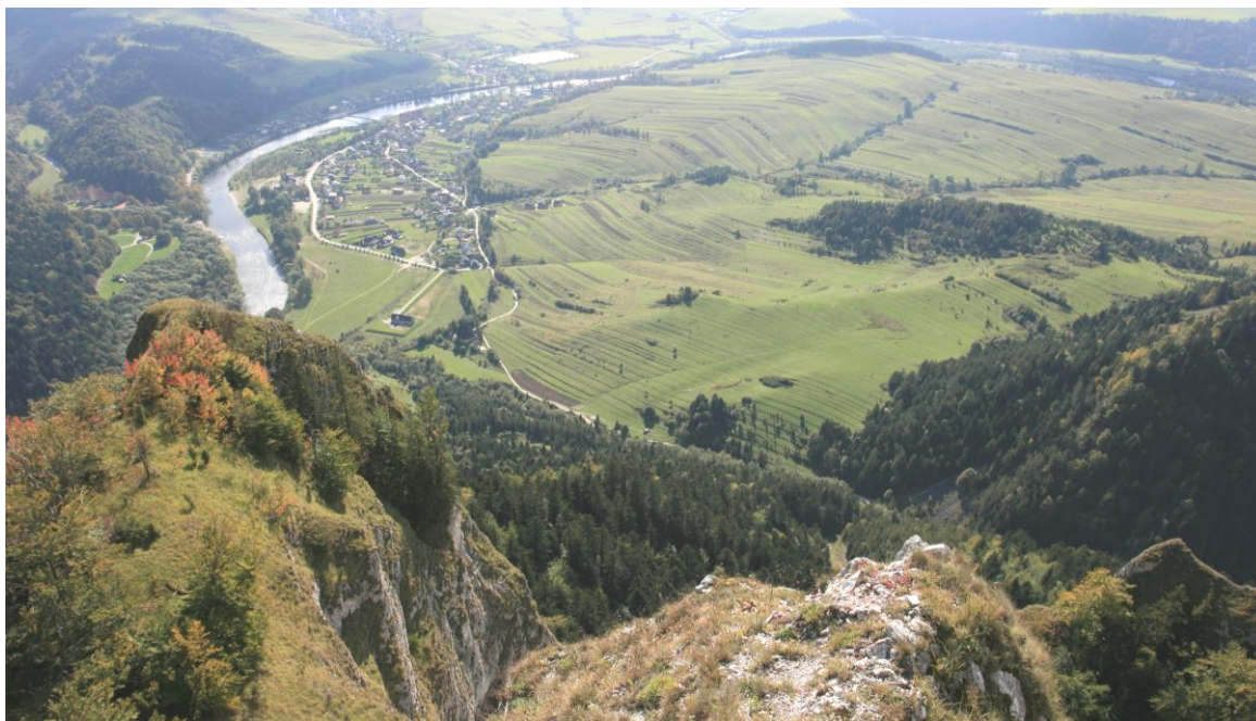
Jesienny widok z Trzech Koron