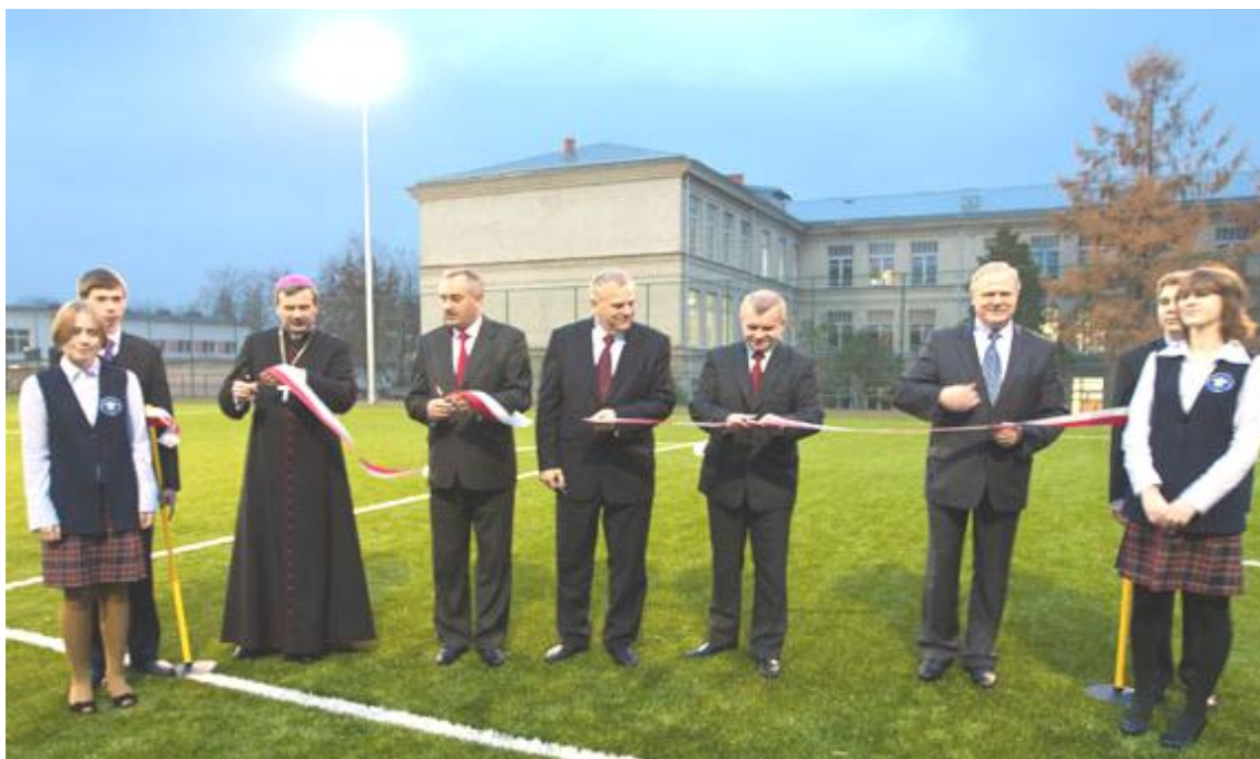
Oddanie do użytku nowych obiektów sportowych