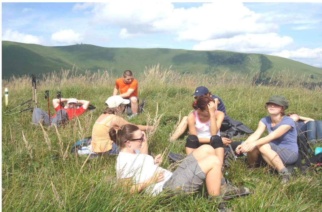
Nareszcie nie pada... Gdzieś na grani Wielkiej Fatry

28 lipca – pada... Co prawda do miejscowości Donovaly ok. 3 godziny, ale nie ma tam kempingu, a na pensjonaty nas nie stać. Zostajemy na przełęczy następny dzień! Pada z małymi przerwami. Dzień mija na grach świetlicowych, a nawet udaje się nam rozpaść ognisko. Co by nie mówić, pogoda grała sobie z nami w berka, a beczynne gnacie w namiotach nie należy do przyjemności. Zасыpiamy z postanowieniem, że rano ruszymy bez względu na pogodę.