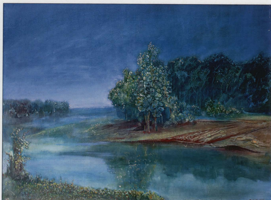
Dolina Narwi wiosną, olej/plótno, 1982, wł. Muzeum w łomży