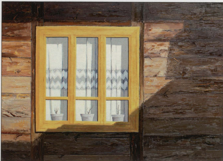
Warszawska 22 – okno, olej/plótno, 2016