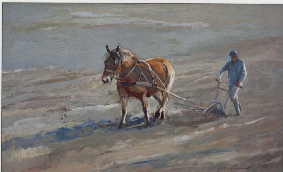
Orka, olej/ptyta, 2018