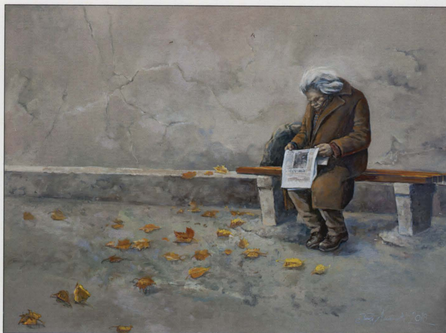
Jesienne wiadomości, olej/ptyta, 2018