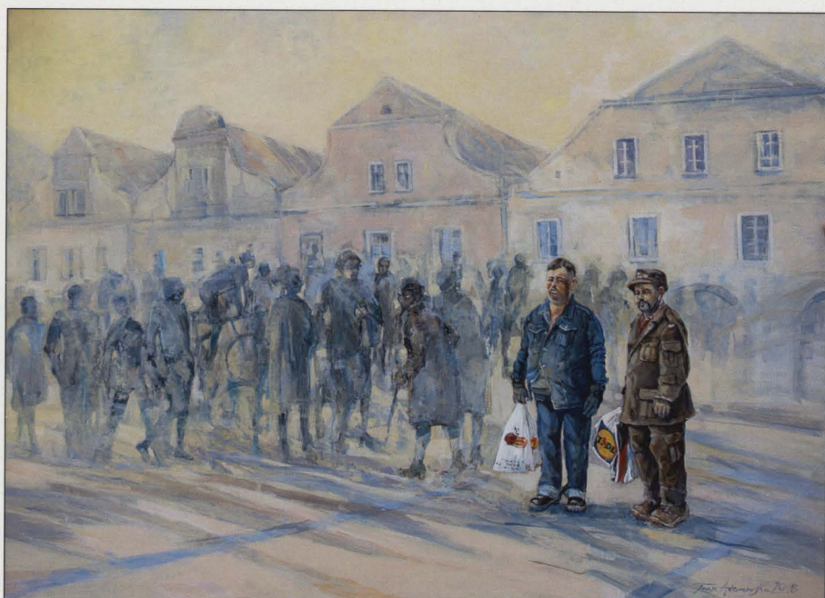
Na Rynku, olej/ptyta, 2018