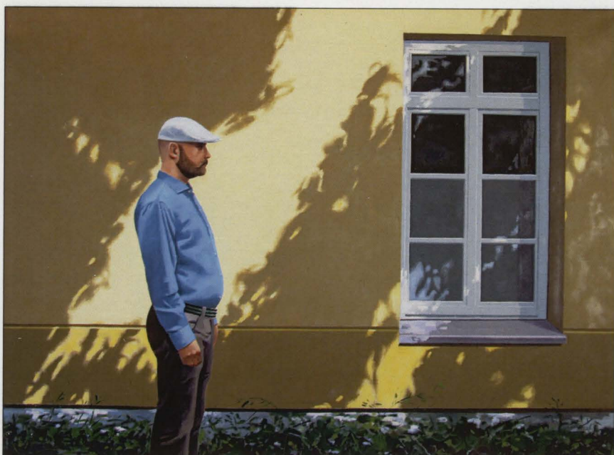
Krakowskie Przedmieście 5, olej/plótno, 2016