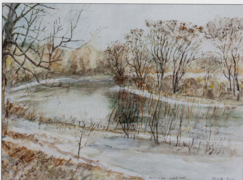
Narew zimą – zakole rzeki, akwarela, 2008, wł. Muzeum w łomży