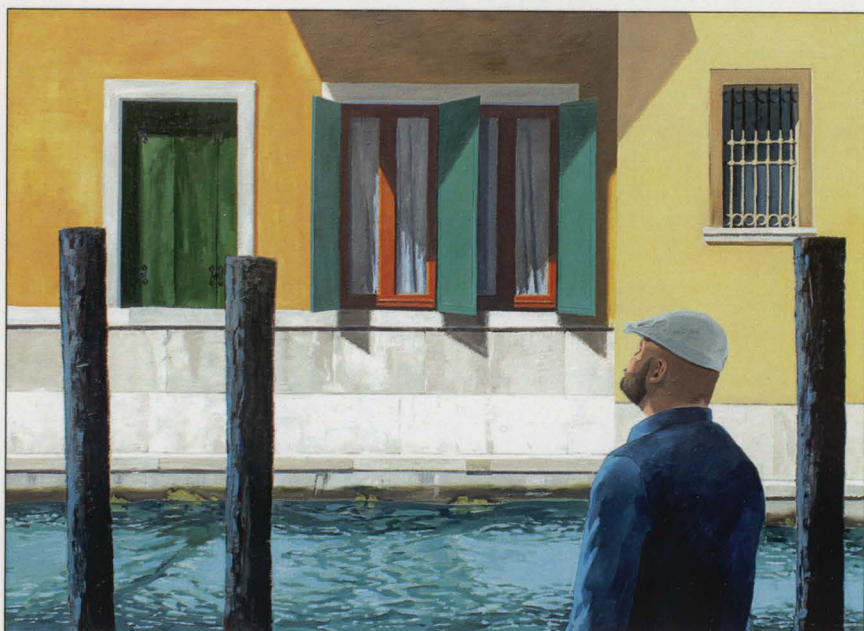
Wenecja, olej/plótno, 2017