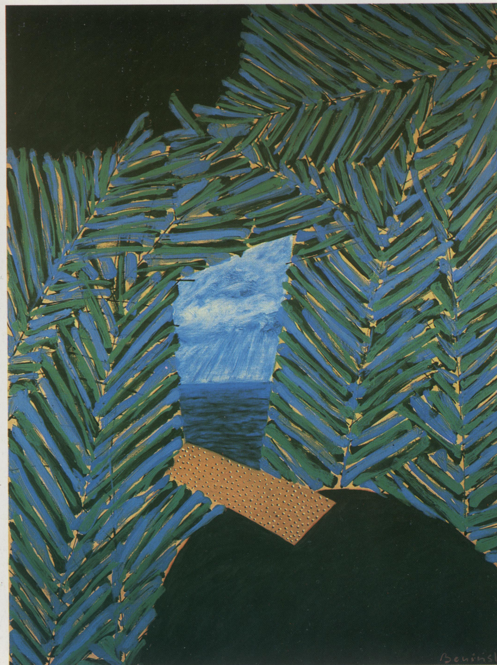
Bez tytułu, olej płótno 97 x 130 , 1990