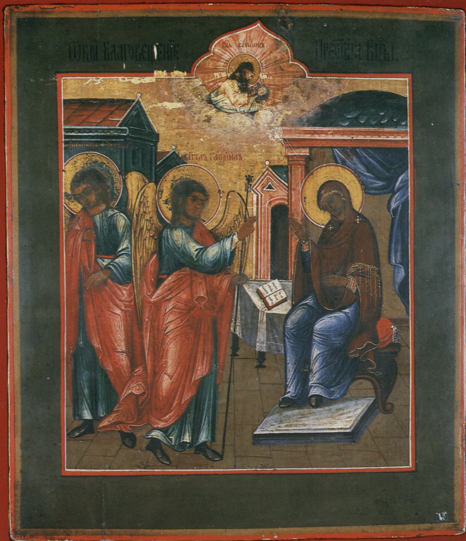
Ikona „Zwiastowanie”, deska, tempera, Rosja XIX w. Nr inw. MB/S/2200