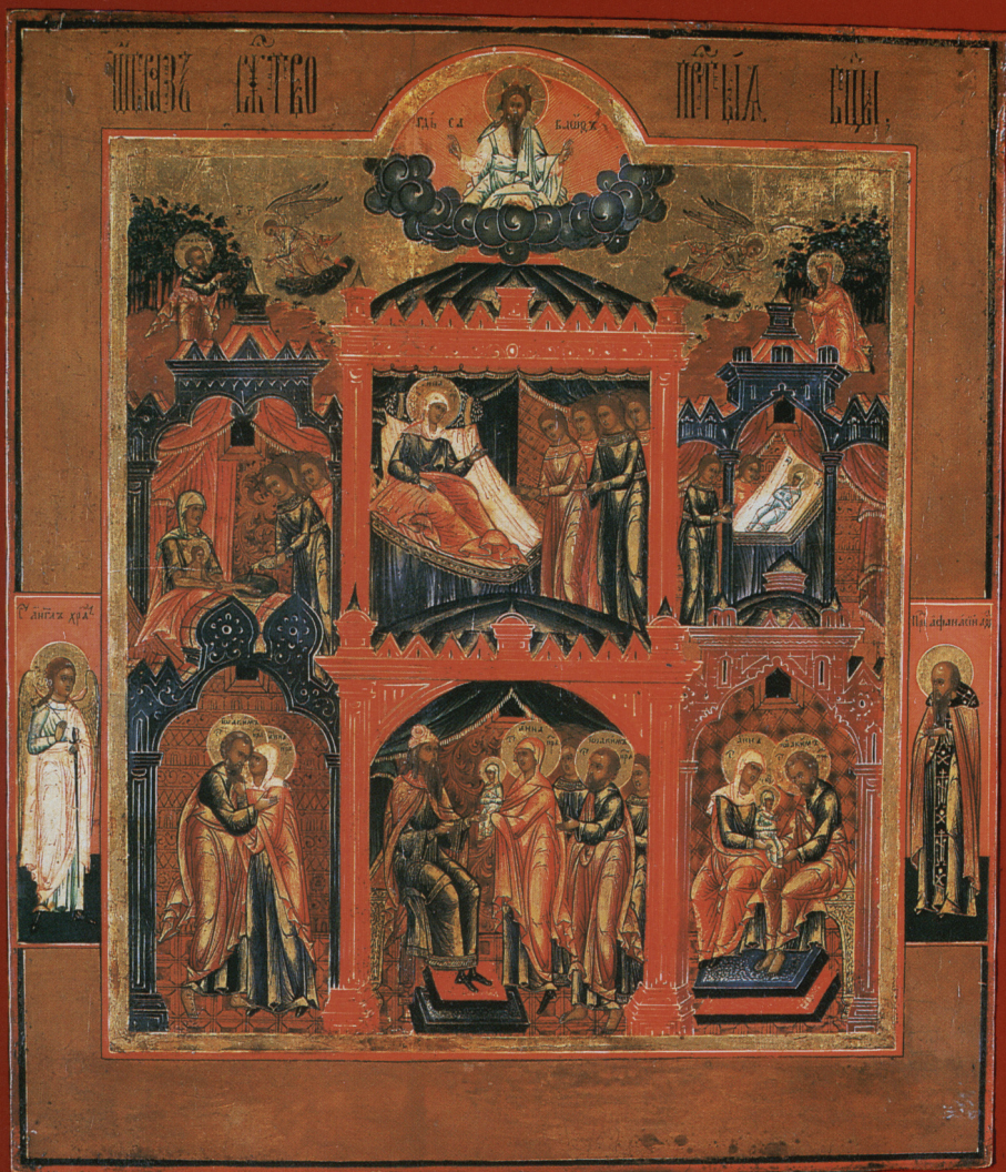
Ikona „Sceny z życia Joachima i Anny”, deska, tempera Rosja k. XVIII w. MB/S/2179