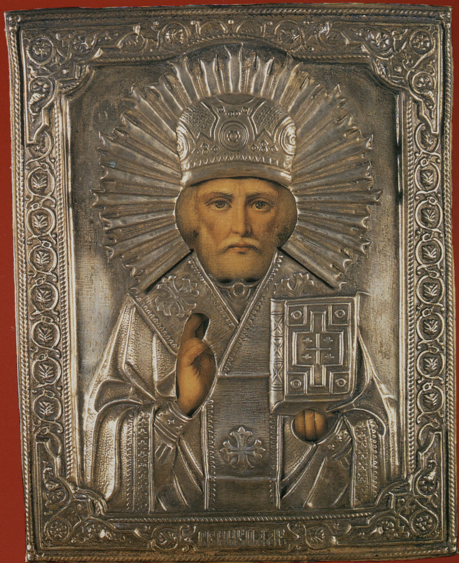
Ikona „Św. Mikołaj Cudotwórca”, deska, oleodruk, okład mosiężny, Rosja pocz. XX w. Nr. inw. MB/S/2208