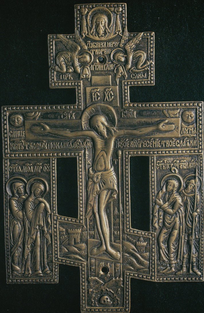
Krzyż. mosiądz. Rosja XIX w. Nr inw. MB/S/2243