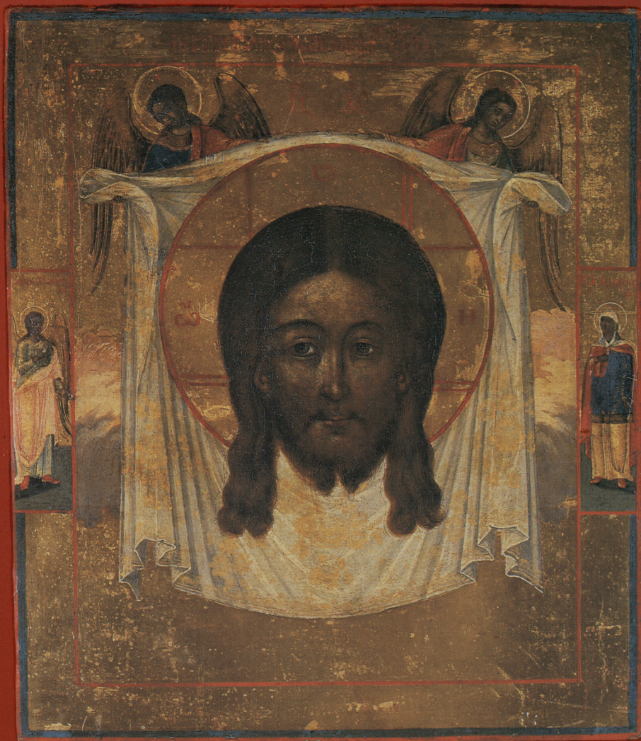
Ikona „Mandylion”, deska, tempera, Rosja pocz. XIX w. Nr inw. MB/S/528