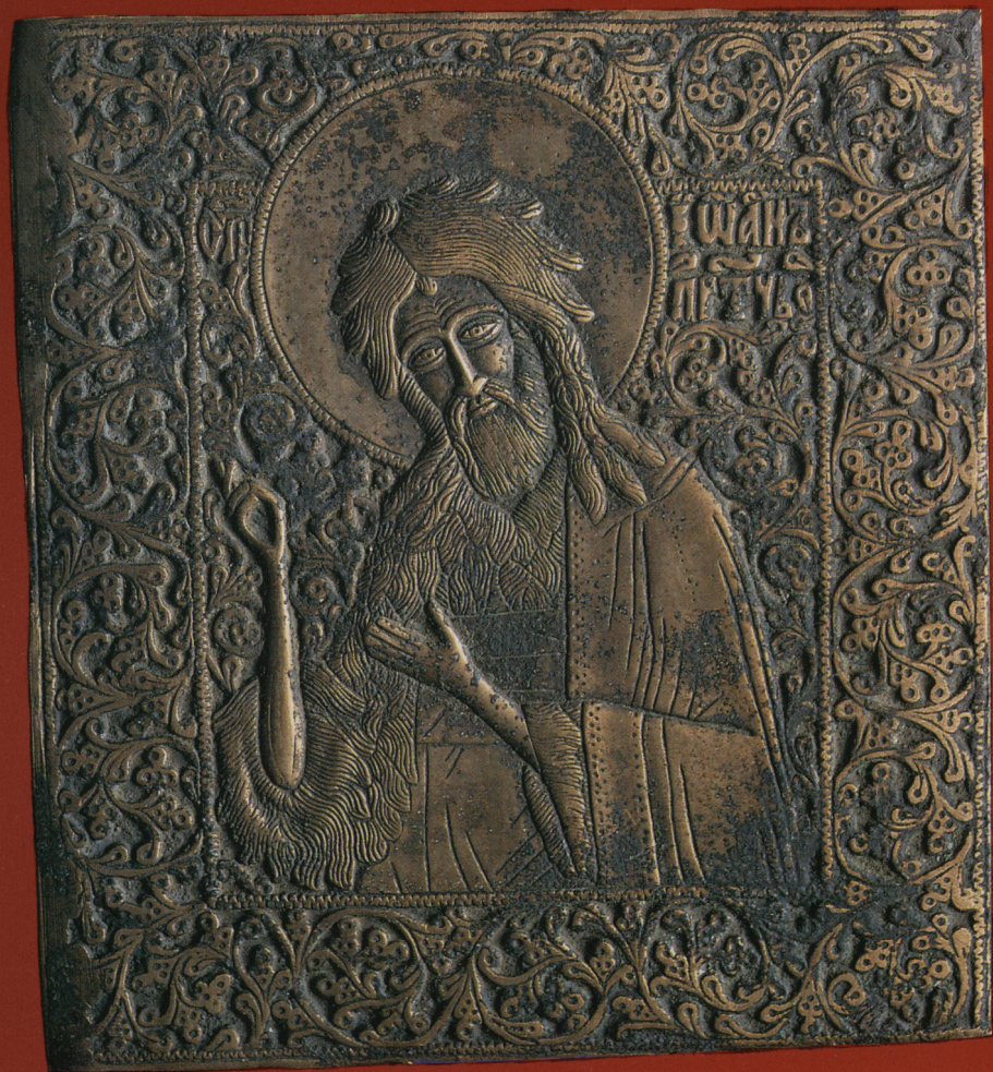
Sw. Jan Chrzciciel, mosiądz, Rosja XIX w. Nr inw. MB/S/2526