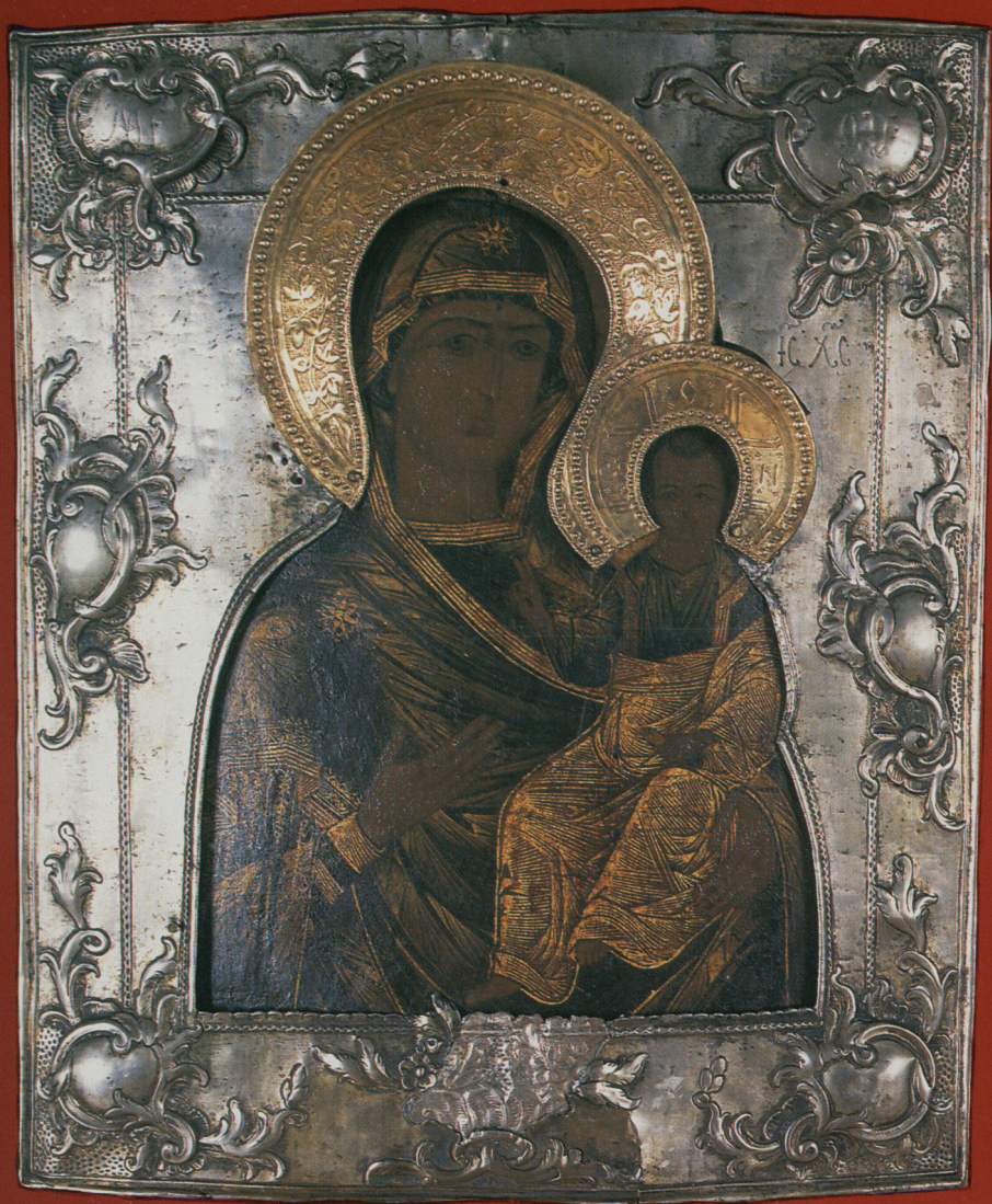
Ikona „Matka Boska Tychwińska”, deska, tempera, ryzta srebrna, Rosja 1771 r. Nr inw. MB/S/2182