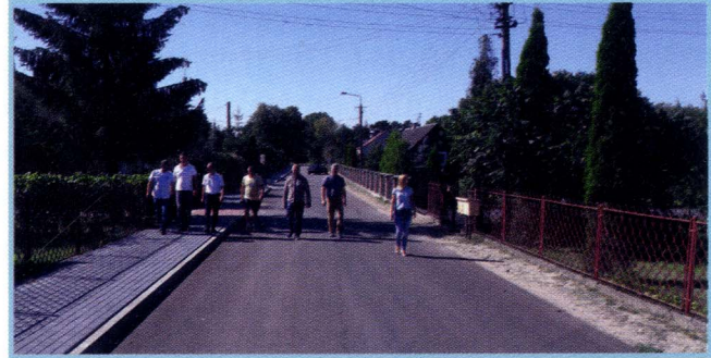
Śniadowo, ul. Stara Stacja