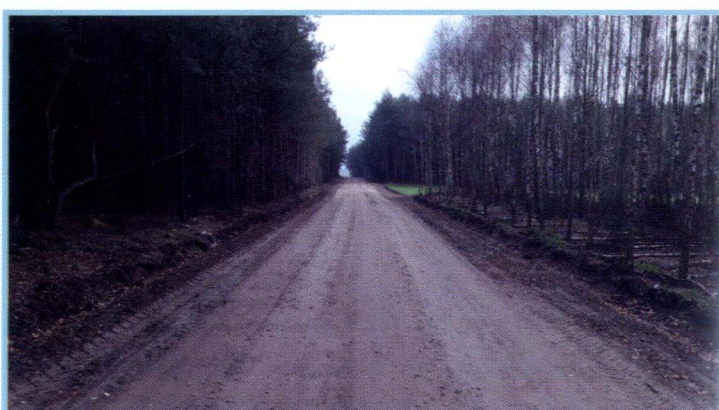
Uśnik Kolonia - Dębowo