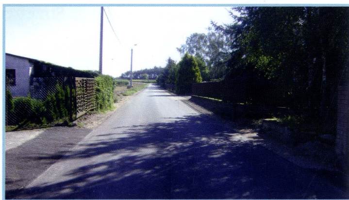
Jakać Młoda Kolonia