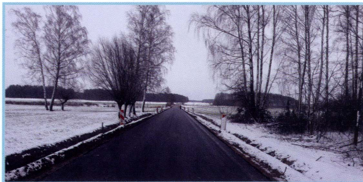
Jakać Borki - Stare Szabły