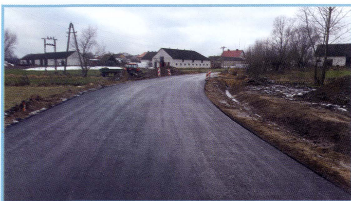
Radgoszcz Dwór - Dębowo

Aktualnie są opracowywane projekty budowlano – wykonawcze na przebudowę dróg z planowaną realizacją na lata 2017 – 2019.