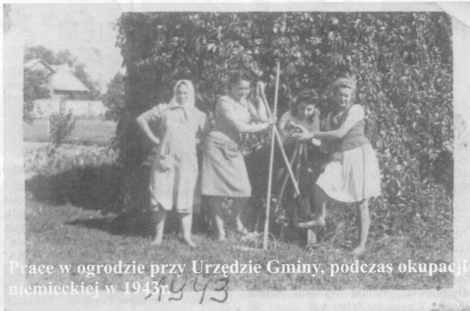
Prace w ogrodzie przy Urzędzie Gminy, podczas okupacji niemieckiej w 1943r.