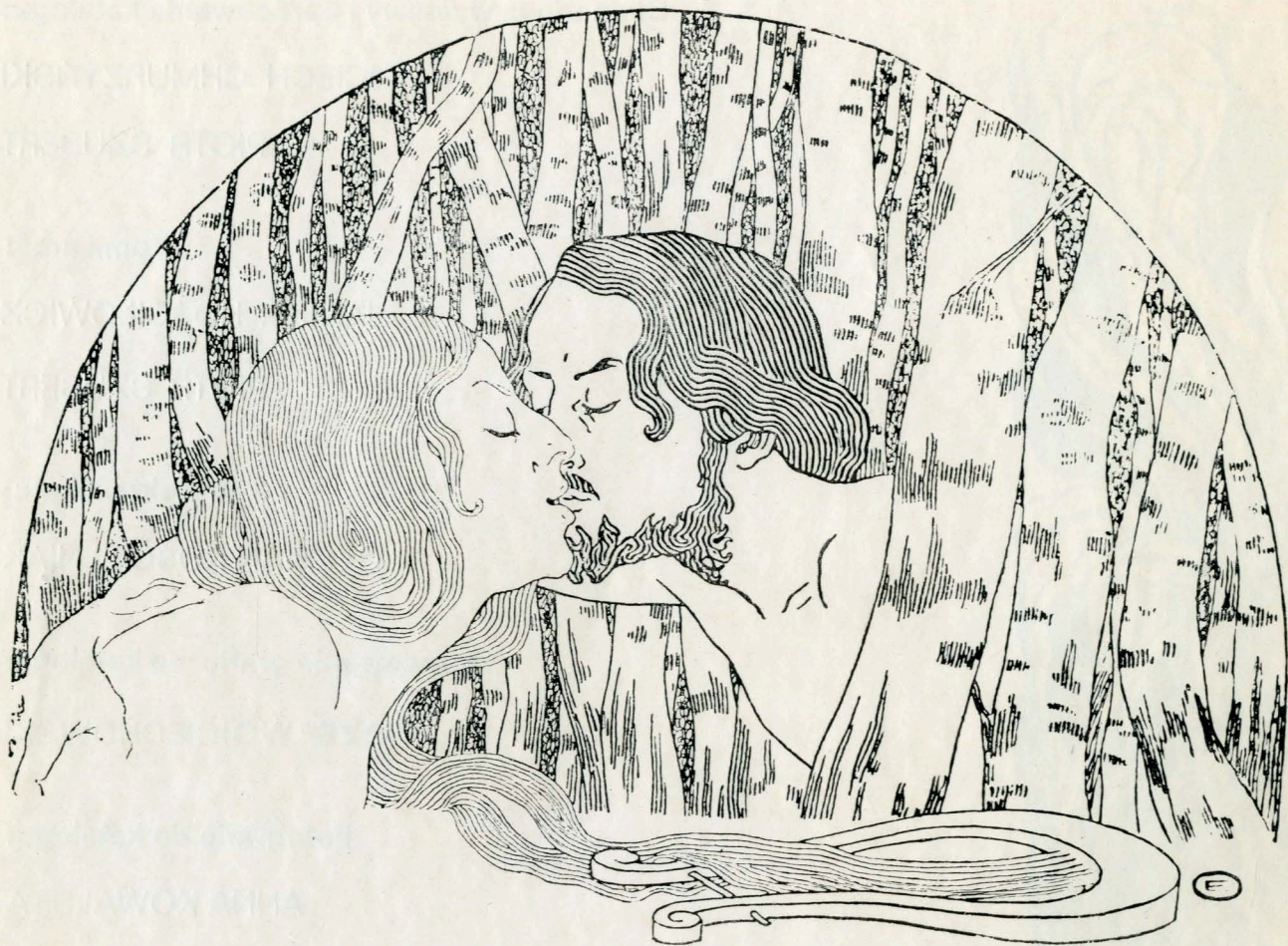
6. Edward Okuń, Winieta okładkowa z pierwszego numeru „Chimery”, kat. 200