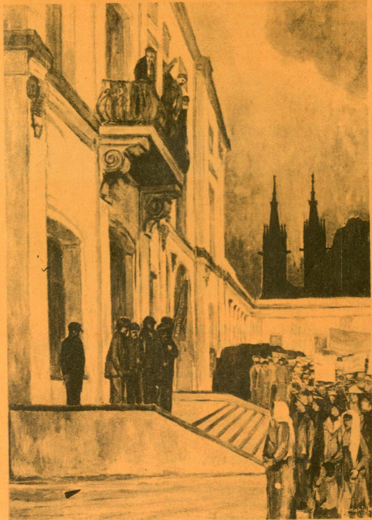
ANTONI SZYMANIUK – DZIERŻYŃSKI W BIAŁYMSTOKU