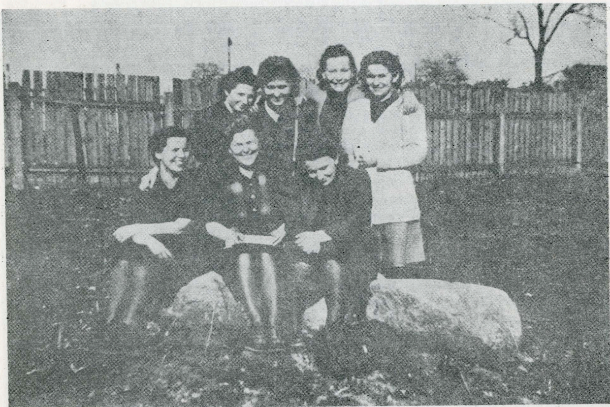
Członkinie koła Ligi Kobiet przy Fabryce Włókienniczej