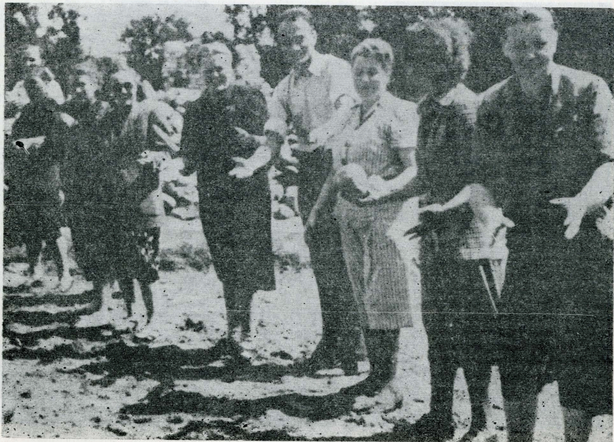
Udział kobiet przy odgruzowywaniu Białegostoku