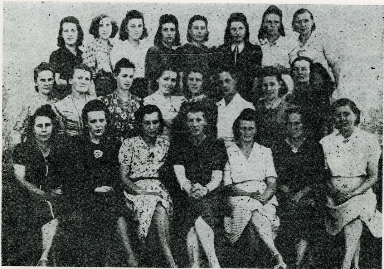
Uczestniczki pierwszego kursu kroju i szycia