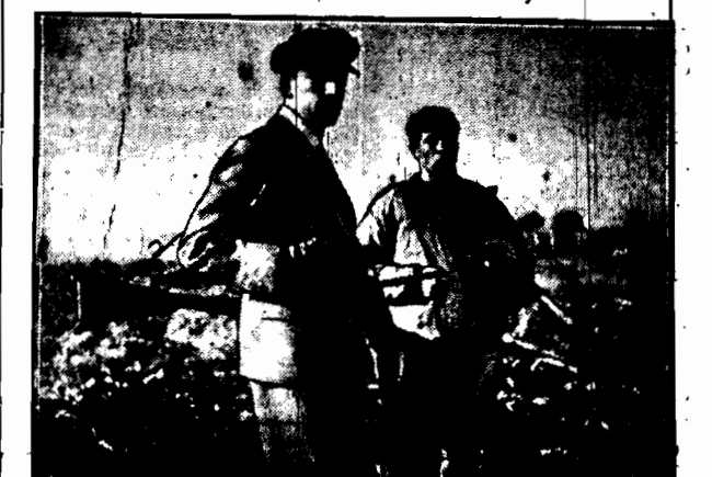
Król Borys Bułgarski, czekając na zwierzynę na polowaniu w Dolinie Orny, i jego sobolizy rozmawiają z chłopem.