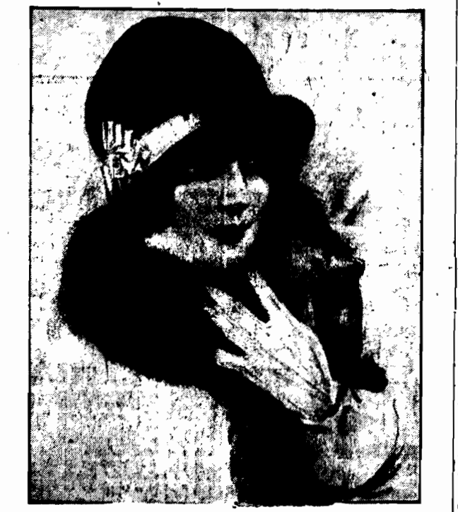
KWIAT WIOSENNY NA MROZIE

Następca tronu ks. Walii wygłosi przez radio wezwanie do obywateli Wielkiej Brytanii, aby nieśli pomoc nieszczęśliwym górnikom.