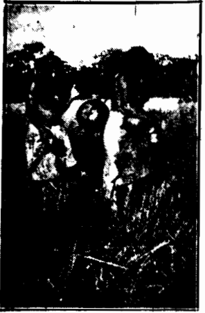
W Chaco paragwajskim, które jest przyczyną obecnego zatargu zbrojnego między Boliwią i Paragwajem, mieszka jeszcze dzikie plemię indyjskie. Fotografia przedstawia indiańki niosące wodę do koczowiska. Fot. kot. Fularski.

zaliczował niezwykle zaiste konkurs, będący przeciwieństwem konkursu, urządzanego w innym miasteczku angielskim w Dunmow, w hrabstwie Essex, gdzie wrecza się wielki połączony małżeństwu, które w ubiegłym roku żyło ze sobą w największej zgodzie.