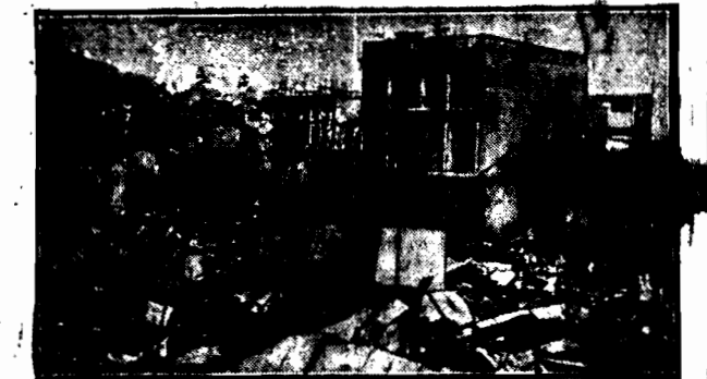
Przeważająca część z wielkiej katastrofy trzęsienia ziemi, która przed kilkadziesiąt dniami nawiedziła Chnę, zrównała niemal z ziemią blisko 1000 domów i 10000 mieszkańców. Pod gruzami znalazło śmierć 130 ludzi.