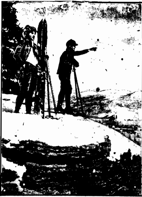
Dwu dzielnych narciarzy po parogodzinnej wędrówce w górę, wydobyli się z nizin, która rozciąga się u ich stóp, na wyniosły szczyt skalny.