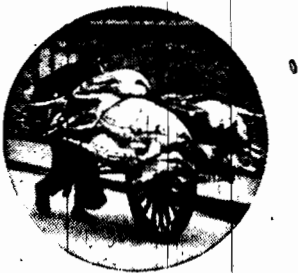
Handlarz wieprzowina w drodze na targ.