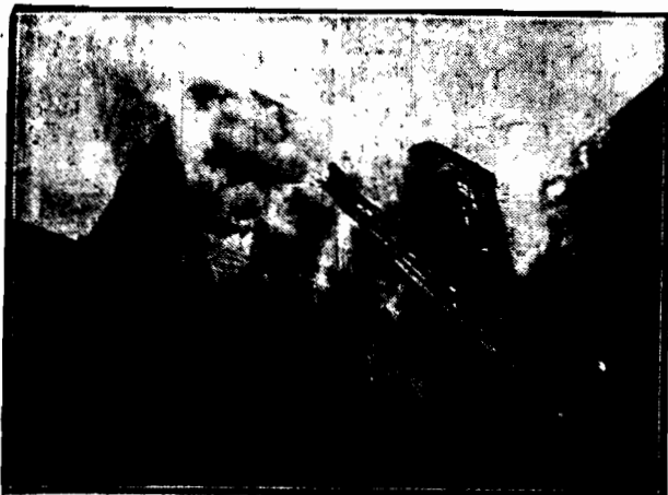
Katastroficzne rozmiary przybrał pożar, który wybuchł w Berlinie w fabryce przyborów radiowych dr. Baeckera. Plomienie, natrafiający na łatwopalne materiały, ogarnęły w ciągu niewiele minut cały czteropiętrowy budynek, oddalając drogę kilkudziesięciu osobom. 15 osób doznało ciężkich obrażeń.