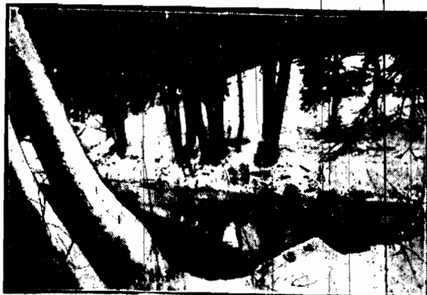
Las i stawek kolo kolonii Grotzera.