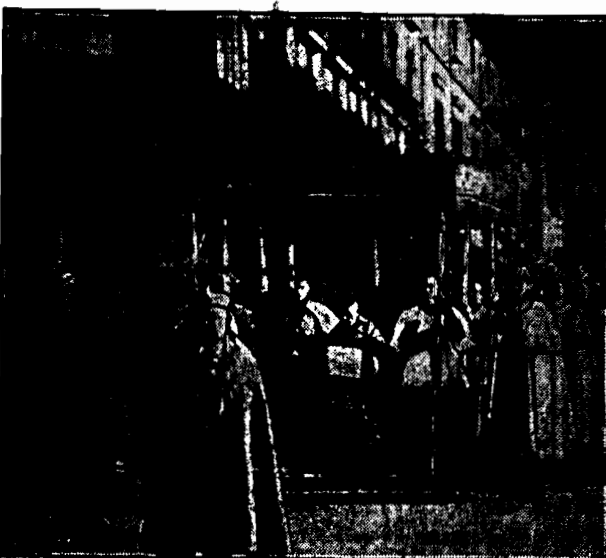
Procesja żąda do nowego kościoła, nosząc pod baldachimem bullę papieską.