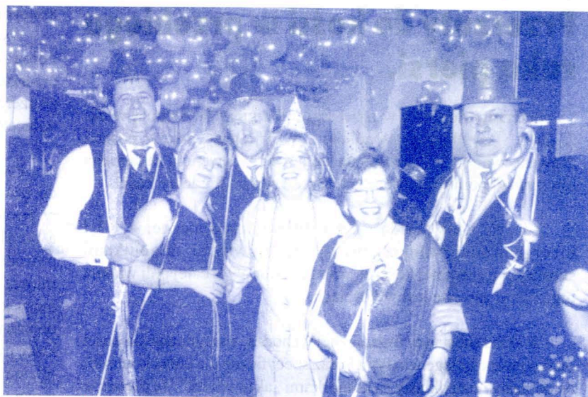
My zawsze lubimy bawić się i szaleć w karnawale. Tak trzymać! Już dawno po czwartej. Zaraz świt.