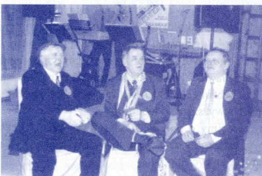
Przy pracy komisja oceniająca konkursowiczów.