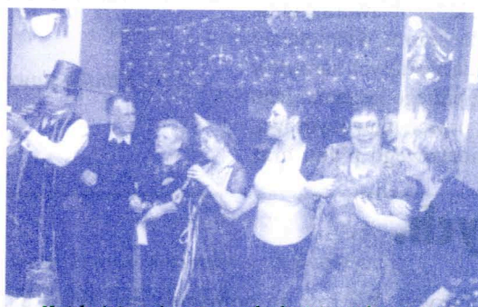
Każdy śpiewać może, trochę lepiej, trochę gorzej.