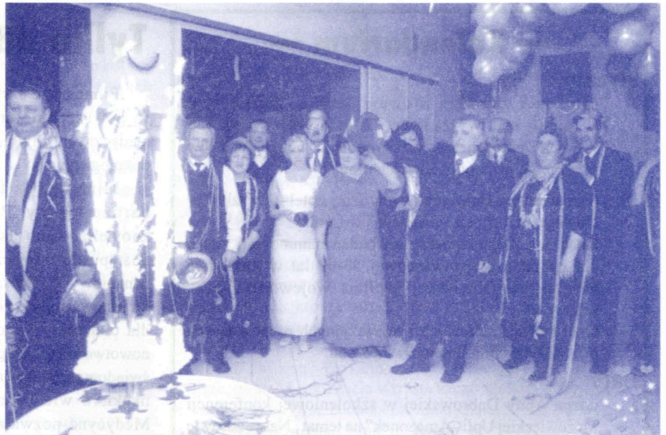
Tort z cukierni „Weronika” dodał uroku karnawałowemu wieczorowi.

Jednocześnie informujemy, że przedstawicielki Naszego Stowarzyszenia