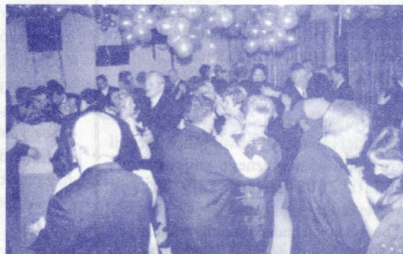
Goście znakomicie bawili się z zespołem „Savarez” z Suwałk