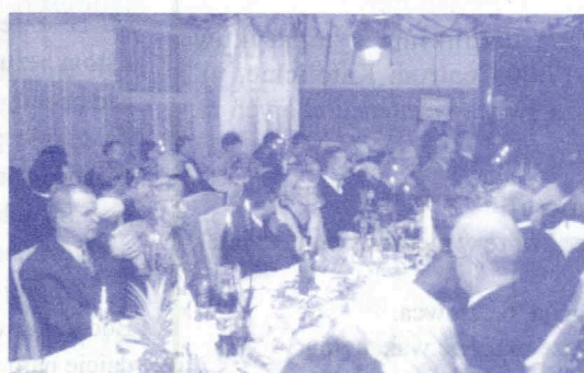
Wiele emocji dostarczyła aukcja prac plastycznych prowadzona przez Wandę Wałkuską.