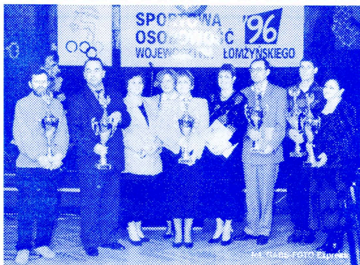
Laureaci Rankingu Sportowa Osobowość Roku 1996 województwa łomżyńskiego