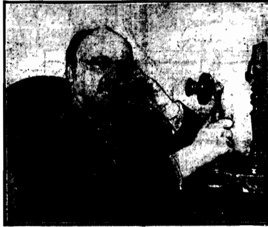
wybrany wiceprezydentem Stanów Zjednoczonych