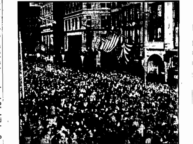
Mieszkańcy Nowego Jorku z entuzjazmem przyjęli wiadomość o zawieszeniu broń w wojnie światowej. Ulice miasta do późnej nocy przepełnione były tłumami manifestantów.

SZTOKHOLM 14.11. — Nagrodę literacką Nobla na rok 1928 przyznano Francuzowi, Henri Bergsonowi, oraz szwedkiej powieściopisarce Hildset