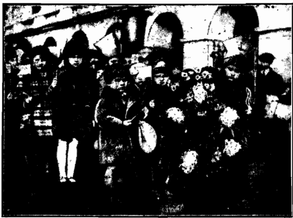
Dzieci, uczęszczające do przedszkola miejskiego w Warszawie złożyły wczoraj popołudniu wieniec na grobie Nieznanego Żołnierza. Maleństwa przemaszerowały z chorągiewkami narodowymi w dłoniach. Uwagę zwracali krzycząc na czele trzyletni ulani.