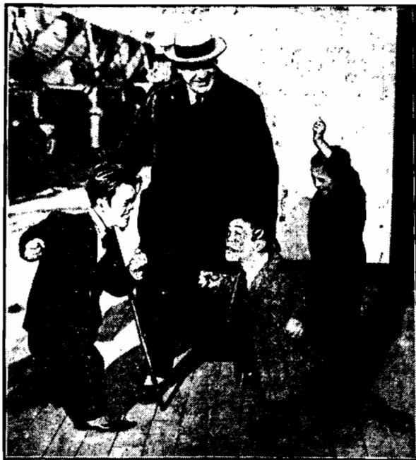
Mecz bokserski dwóch karzelek, który na arenie wywoływałby śmiechu, za kulisami jest traktowany na serio, ku ciesze dyrektora.