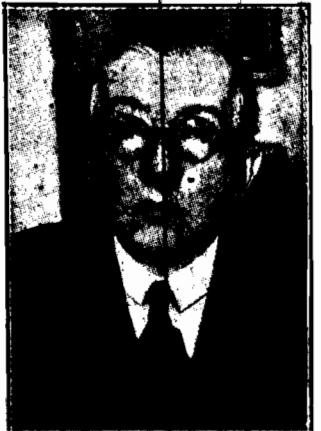
Ambasador amerykański w Londynie podał się do dymisji

rzy doradzą prezydentowi powzięcie misji utworzenia nowego gabinetu ponownie Poincaremu, niezmiennem ciężącemu się zaufaniem większości ciała ustawodawczych.