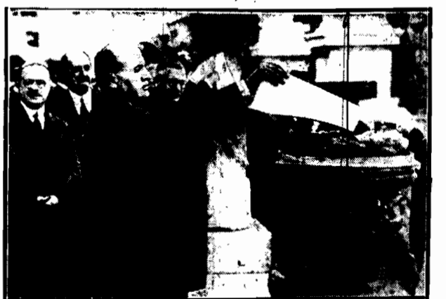
Mussolini pali na ołtarzu ojczyzny u stóp grobu Nieznanego Żołnierza obciążenie długów państwowych na sumę 60.000.000 złotych, wykupione ze składek ludności włoskiej.