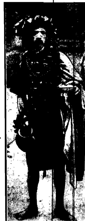
Jedna z najpopularniejszych postaci na ulicach miast indyjskich.