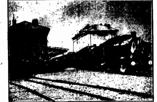
Otwarcie linii kolejowej Nicea — Coni, prowadzącej do Turynu, odbyło się w obecności ministra francuskiego Tardieu i włoskiego Giuratti. Uroczyste wycieczki na stacji Breil skąd rozpoczęto budowę nowej linii.