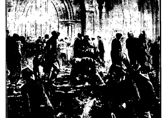
Przy wybuchu rektora Uniwersytetu w Glasgowie na miejsce s.r. Austen Chamberlana wybuchła między studentami wielka bitwa, w której najpotężniejsza broń była znieję jaika. 60 000 tych nieszkodliwych nabojęw zostało zużyte. Zwyciężyła partja Stanleya Baldwinia znakomity mał stanu został wybrany rektorem na przeciąg 3-ch lat.