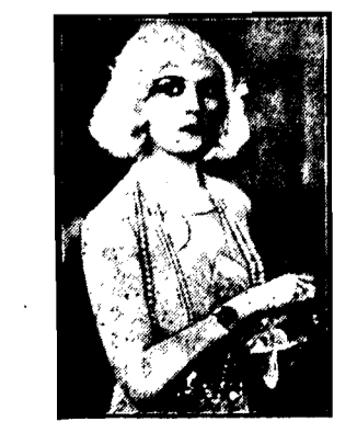
W swej nowej roli „Drugie życie”, wygładza krocie z białej peruki.