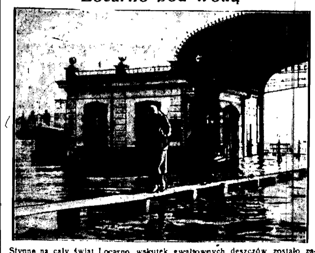
Stymne na cały świat Locarno wskutek gwałtownych deszczów zostało zalane tak, że komunikacja odbywa się przy pomocy improwizowanych kładek.