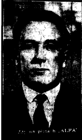
Int. JOZEF WOLKANOWSKI, naczelnik wydziału architektury ministerstwa komunikacji.