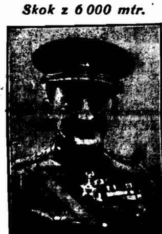
Willy Coppens, lotnik belgijski, wykonał z samolotu ze spadochronem z wysokości 6000 mtr., co świadczy o niezwykłej wprost odwadze i śmiałości król.