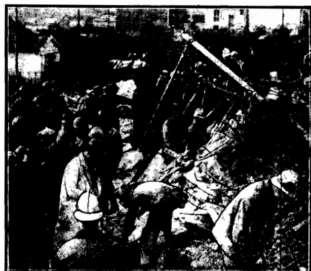
Jeszcze nie minęły echa straszliwej katastrofy budowlanej w Pradze, a już z przedmieścia Paryża—Vincennes nadeszły wiadomości o podobnym wypadku. Budujący się siedmiopiętrowy dom zawalił się, grzebiąc pod gruzami 23 robotników. Na zdjęciu widzimy straż i wojsko w poszukiwaniu ołiar niedobrych stwa budowniczych.