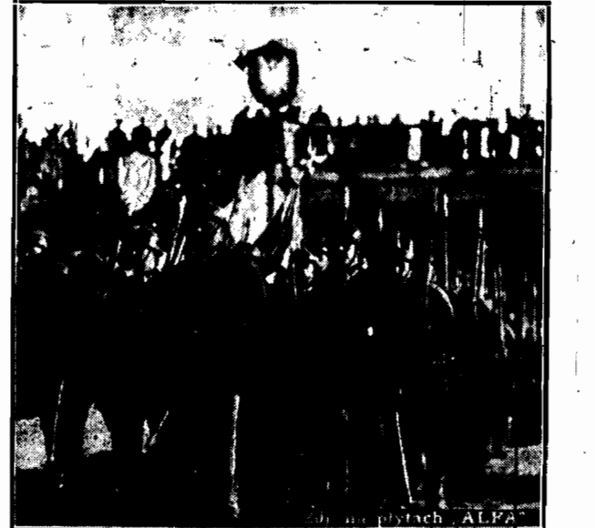
Komponowa honorowa B. S. p. leg. asystująca przy uroczystościach otwarcia wiaduktu kolejowego