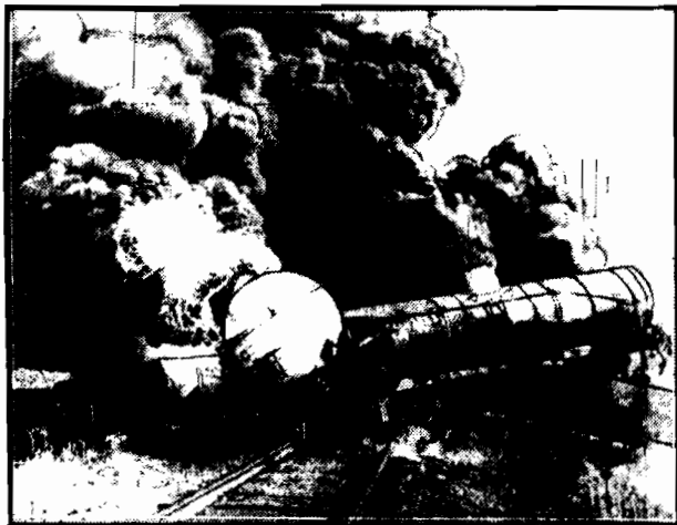
Pożar pociągu towarowego z naftą w Kansas (Ameryka). Pasażerów ognia padła ropa wartości 60.000 dolarów. Widok był w swej groźbie wspaniały.