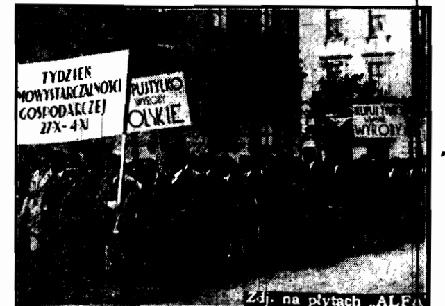
Zdj. na płytach „ALFA”

W sprawie podnerania wytwórczości krajowej.