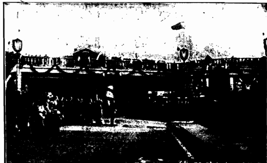
Wiadukt kolejowy w Lublinie otwarty uroczystość w dn. 22 b. m. przez ministra Kühna