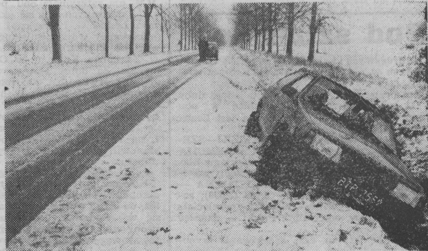
Jak co roku zima zaskoczyła drogowców. W sobotę międzynarodowa droga z Białegostoku do Kuźnicy bardziej przypominała lodowisko do jazdy figurowej niż międzynarodowy trakt. (Szczegóły o sytuacji na drogach na str. 2.)

DZIS zachmurzenie małe i umiarkowane, stopniowo wzrastające do dużego z opadami śniegu, przechodzącego w deszcz. Temperatura maks. 1-3 st. C., minimalna 0-2 st. C. Wiatr słaby i umiarkowany południowo-zachodni i zachodni. JUTRO zanikające opady deszczu, cieplej. (ela)