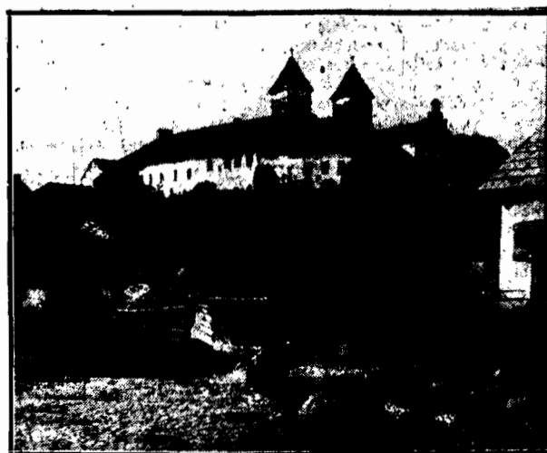
Zburzony w czasie wojny, odbudowany nocmie starostą O.O. Salczajewym.